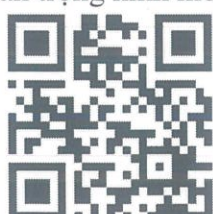
Quét mã QR để truy cập Hệ thống bỏ phiếu điện tử

Trân trọng kính mời Quý Cổ đông đến tham dự ĐHCĐ!