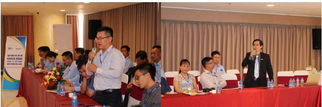
Các nhà phân phối đóng góp ý kiến tại buổi họp mặt

Giống như Hội nghị khách hàng tại miền Bắc, các nhà phân phối miền Nam đã được đại diện quản lý cấp cao của công ty giới thiệu chi tiết về DCL, về công ty mẹ FIT Group, về sản phẩm và chính sách bán hàng, đặc biệt là các dự án lớn và định hướng của DCL trong thời gian sắp tới. Bên cạnh đó, Ban lãnh đạo công ty luôn đề cao những ý kiến đóng góp của các nhà phân phối để giúp DCL có những phương án cải thiện, để tiếp tục thắt chặt mối quan hệ hợp tác, đồng hành của công ty với khách hàng.