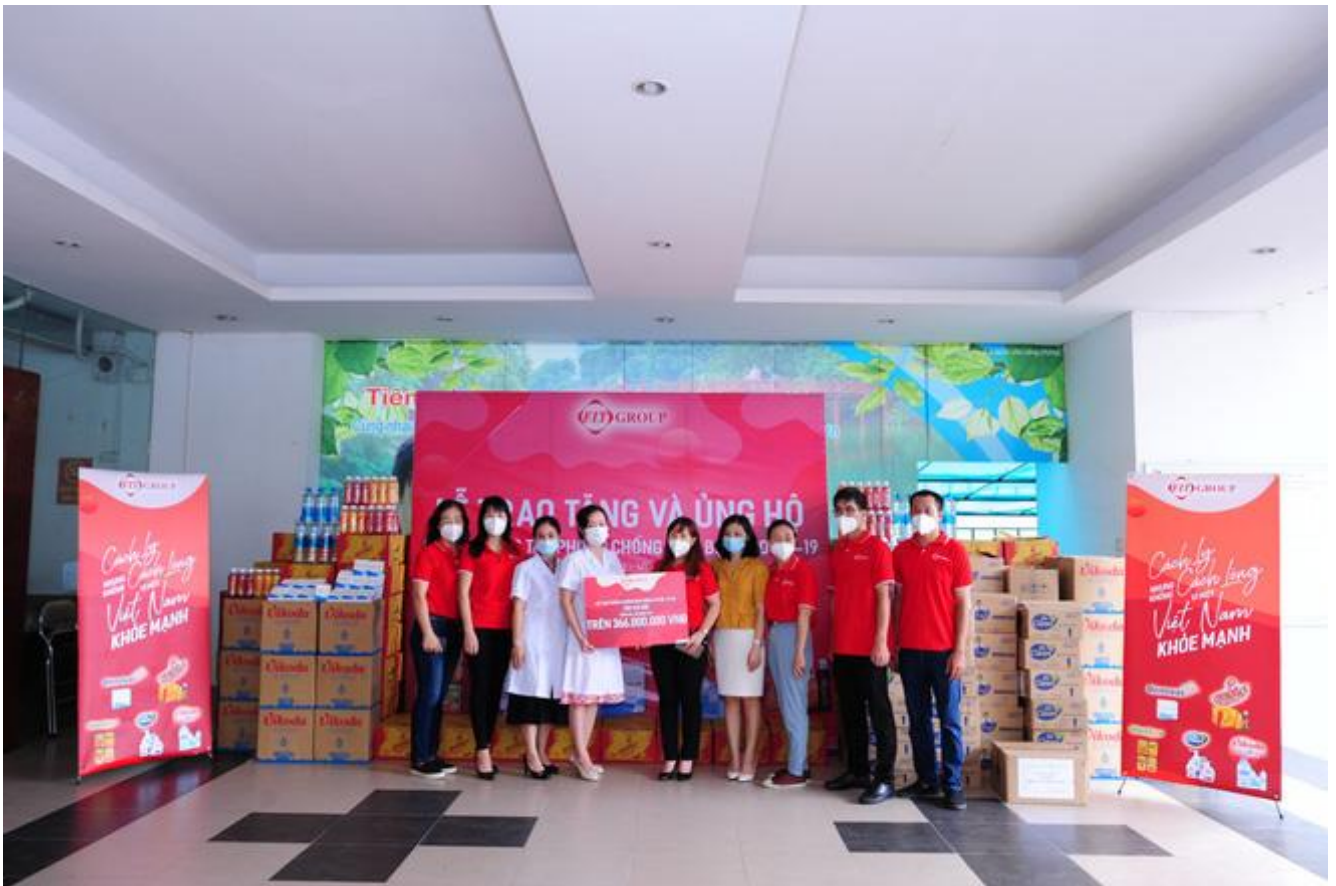
Đại diện F.I.T Group trao tặng 366 triệu đồng tiền mặt cùng hàng chục ngàn sản phẩm thiết yếu tới các bác sĩ tại Trung tâm Kiểm soát bệnh tật TP. Hà Nội.