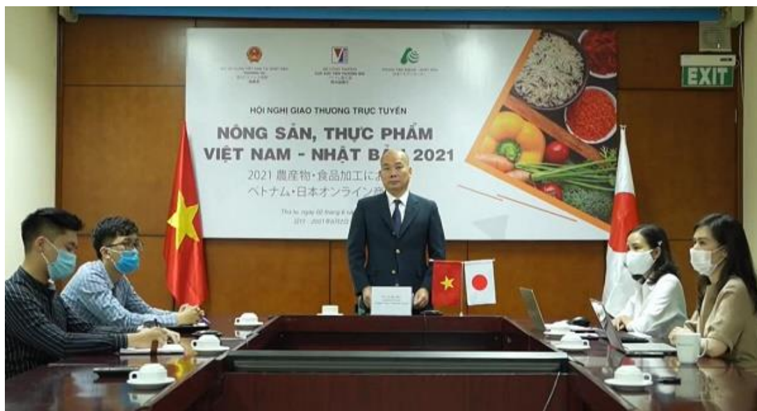
Quang cảnh hội nghị tại điểm cầu Bộ Công Thương.

Tại hội nghị, các doanh nghiệp được thông tin về tình hình thị trường nông sản, thực phẩm Nhật Bản trong năm 2021 và những năm tiếp theo và cập nhật những tiêu chuẩn khi xuất khẩu vào thị trường Nhật Bản. Đây được xem là kim chỉ nam để các doanh nghiệp xuất khẩu của Việt Nam thâm nhập vào thị trường được đánh giá là khó tính nhất thế giới này.