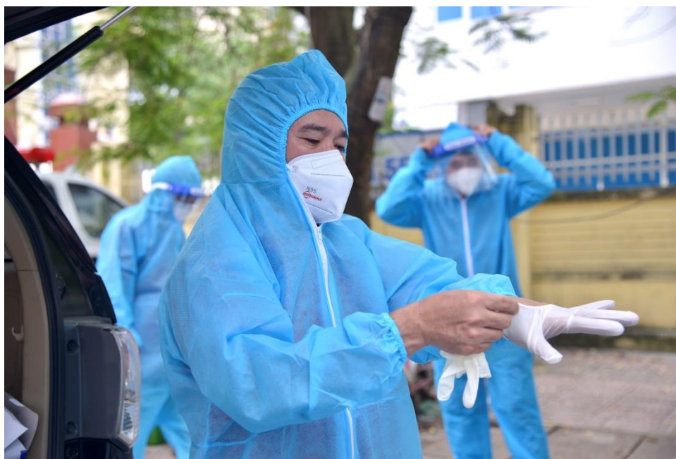
FIT Group khoác áo bảo hộ trước khi đến hỗ trợ Bệnh viện dã chiến Bắc Giang

Với đặc điểm có nhiều khu công nghiệp quy mô lớn, hiện đại, mật độ công nhân cư trú cao, trong những ngày này, các lực lượng quân đội, an ninh, đội ngũ y tế cùng với người dân Bắc Giang phải hành động hết công suất để nhanh chóng đẩy lùi dịch bệnh. Trước diễn biến dịch bệnh căng thẳng tại Bắc Giang, ngày 2/6/2021 đoàn hỗ trợ của FIT Group đã kịp thời vận chuyển hàng nghìn vật phẩm thiết yếu hỗ trợ cho các lực lượng y tế, bác sỹ và người dân nơi đây.