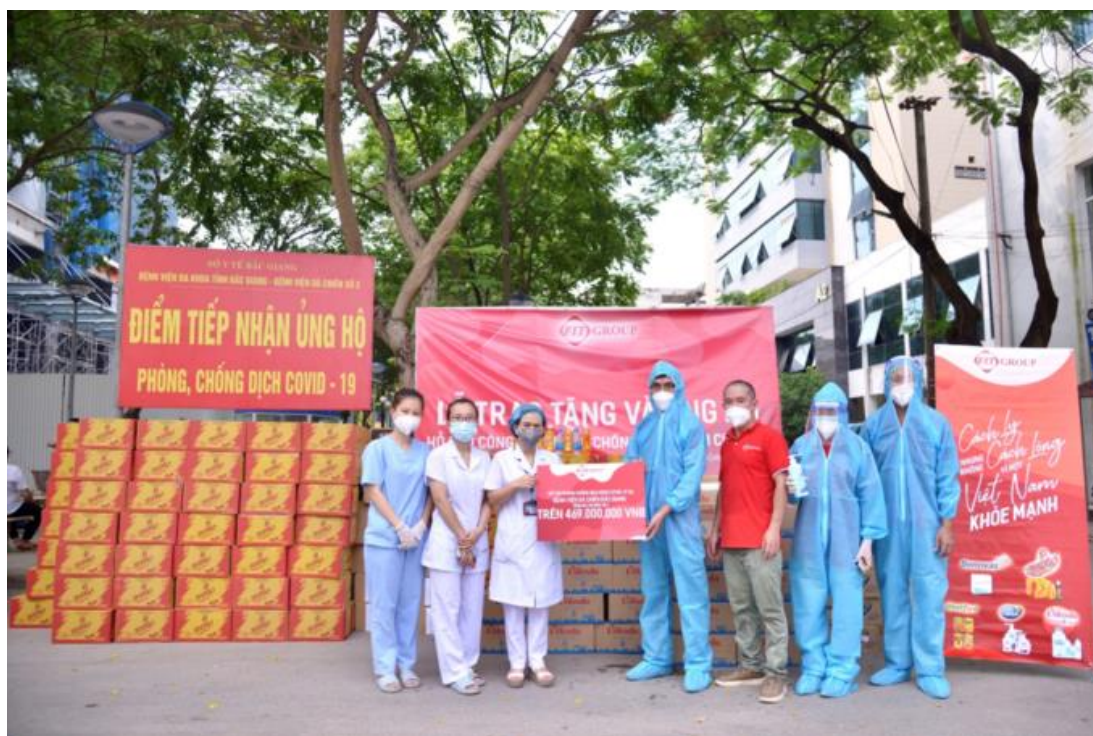
FIT Group trao tặng vật phẩm cho đại diện Bệnh viện dã chiến Bắc Giang.

Cụ thể, đoàn hỗ trợ của FIT Group trao tặng cho Bệnh viện dã chiến Bắc Giang và UBND huyện Lục Nam, Bắc Giang gồm 543 thùng nước Vikoda các loại; 1.298 thùng nước khoáng tăng lực Sumo; 5.616 sản phẩm là gel rửa tay không dùng nước, dung dịch rửa tay Dr.Clean; 1.742 sản phẩm trái cây đóng lon Westfood các loại; 2.212 hộp thuốc. Trong đó chủ yếu là thuốc giảm đau hạ sốt Panalgan, vitamin C tăng sức đề kháng; 4.500 khẩu trang y tế N95. Tổng giá trị hàng hóa, vật phẩm tài trợ hơn 838 triệu đồng.