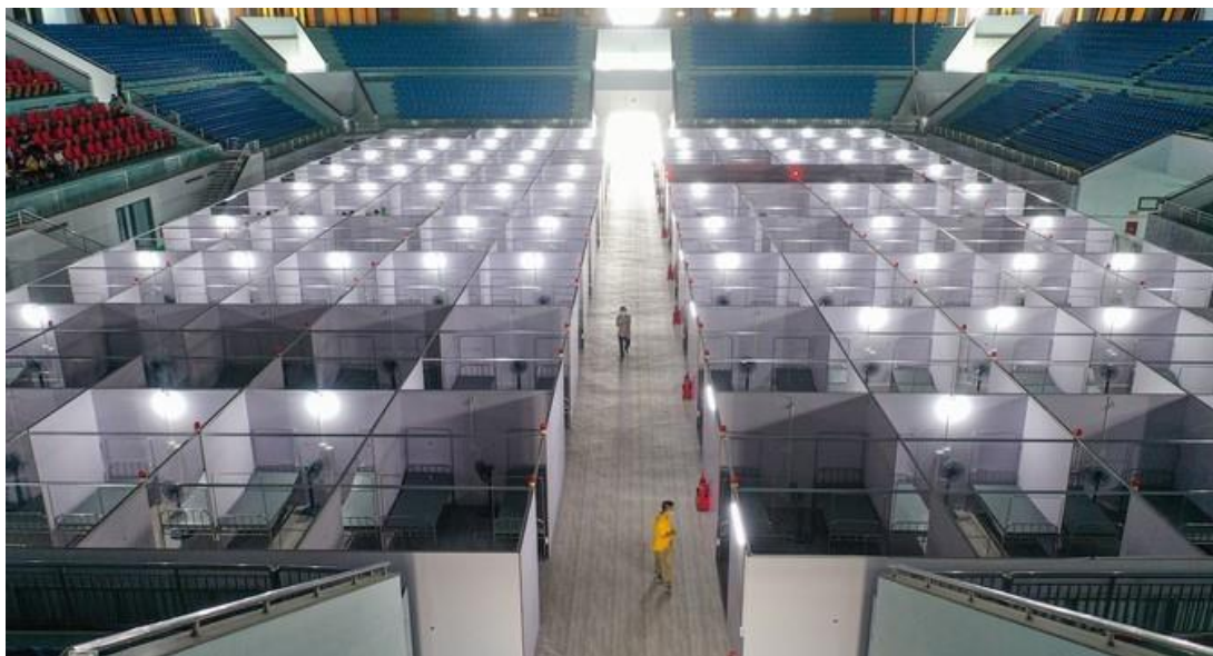
Bệnh viện dã chiến tại tỉnh Bắc Giang

Hiện nay, Bắc Giang đang là tâm dịch của cả nước khi đứng đầu đứng đầu về số ca nhiễm Covid – 19. Theo số liệu thống kê của Bộ Y Tế, hiện Bắc Giang có hơn 2400 ca nhiễm. UBND tỉnh Bắc Giang cũng đã dự báo trong những ngày tới, số lượng ca F0 vẫn tiếp tục tăng do hiện nay đang tiến hành xét nghiệm lần 3, lần 4 đối với các khu vực, đối tượng có nguy cơ nhiễm cao.