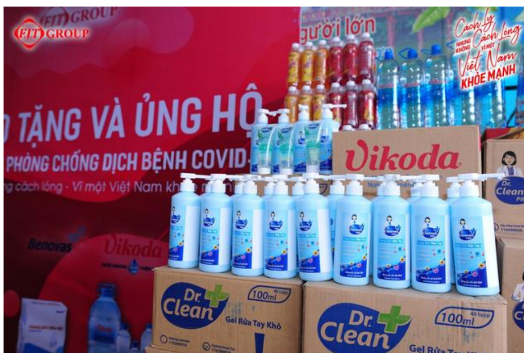
Cận cảnh các sản phẩm gel rửa tay không dùng nước của FIT Group gửi tặng các y, bác sĩ, nhân viên y tế tại CDC Hà Nội

Theo bà Nguyệt, dịch COVID-19 năm 2020 đã ảnh hưởng tới hoạt động sản xuất kinh doanh của toàn xã hội nói chung và FIT cùng các đơn vị thành viên nói riêng, tuy nhiên, tin rất vui là trong năm 2020, doanh thu của Tập đoàn vẫn đạt mốc 1.200 tỷ với lợi nhuận sau thuế khoảng 80 tỷ. Số này vượt rất xa so với năm 2019. Năm 2021, FIT Group đặt chỉ tiêu doanh thu trước thuế khoảng 1.350 tỷ và lợi nhuận sau thuế gấp đôi năm 2020, với khoảng 176 tỷ.