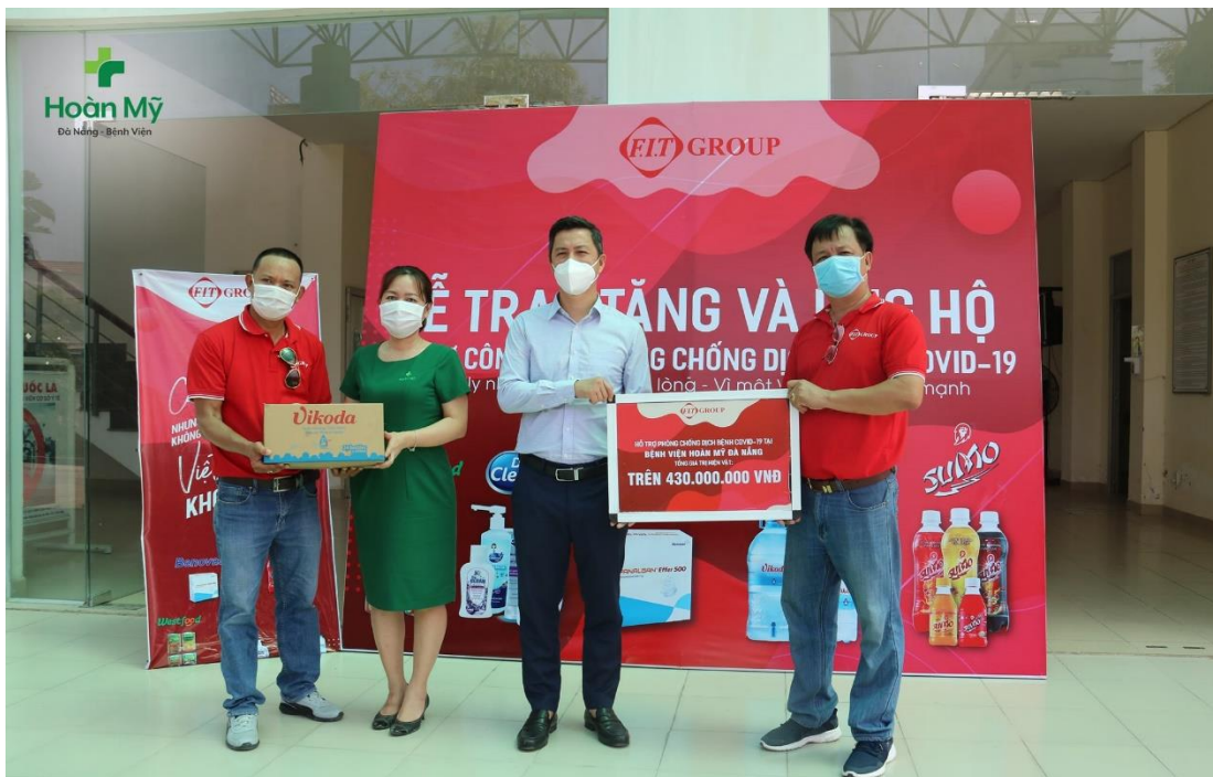
FIT Group trao quà cho Bệnh viện Hoàn Mỹ Đà Nẵng

Bên cạnh đó, cũng ngay tại Sở Y tế Đà Nẵng, FIT Group cũng trao tặng các vật phẩm cho đại diện Bệnh viện Hoàn Mỹ Đà Nẵng – một trong những bệnh viện bị cách ly trong đợt bùng dịch lần thứ 4 nhằm hỗ trợ các y bác sĩ và bệnh nhân đang điều trị tại đây vượt qua khó khăn. Các vật phẩm tài trợ bao gồm 287 thùng nước khoáng thiên nhiên Vikoda các loại, 554 thùng nước khoáng tăng lực Sumo, 2.280 sản phẩm gel, dung dịch và sữa rửa tay Dr.Clean; 1.500 khẩu trang y tế N95; 2.052 hộp thuốc, bao gồm các sản phẩm thuốc rất cần thiết cho người bệnh đang cần điều trị tại các khu cách ly thuốc Giảm đau hạ sốt Panalgan, vitamin C, Topralsin; Ceplor PVC 500; 562 sản phẩm nha đam đóng lon thương hiệu Westfood. Tổng giá trị tài trợ gần 430 triệu đồng.