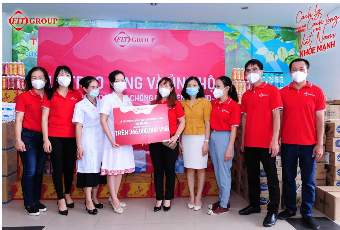
FIT Group trao vật phẩm cho CDC Hà Nội trong chương trình “FIT Group chung tay đẩy lùi Covid – 19”

Thời gian thực hiện chương trình từ ngày 14/6/2021 đến ngày 30/6/2021.