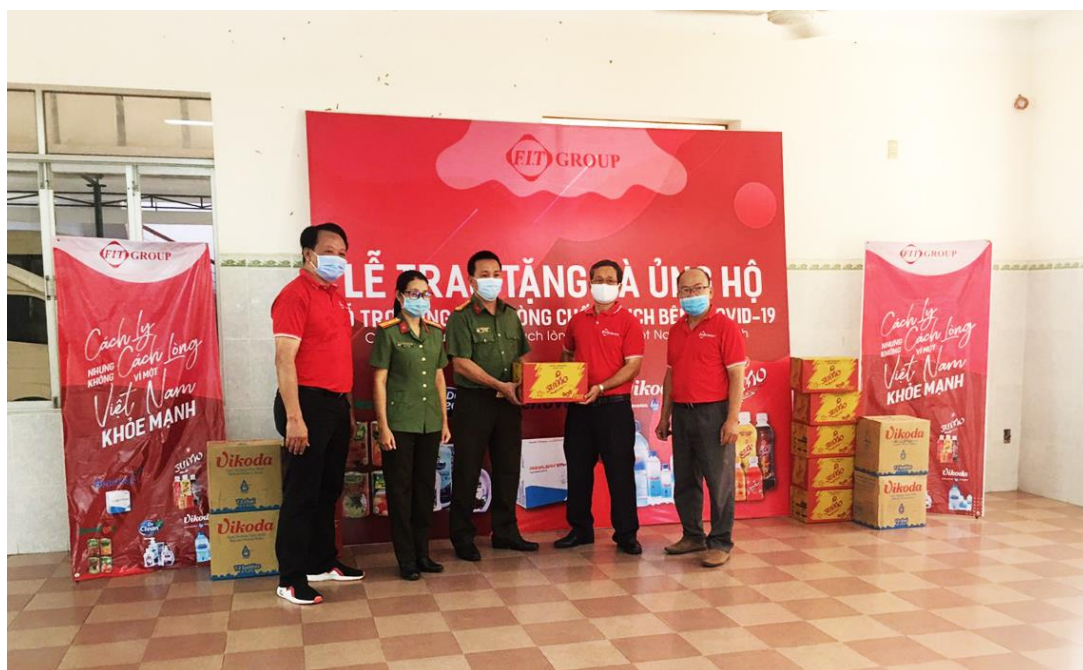
FIT Group trao quà cho Công an tỉnh Khánh Hòa

Hoạt động hỗ trợ tại Khánh Hòa nằm trong chiến dịch “FIT Group chung tay đẩy lùi Covid – 19” do Tập đoàn F.I.T và các công ty trong hệ thống cùng thực hiện với tổng ngân sách hỗ trợ trên 10 tỷ đồng. Đại dịch COVID-19 thực sự là thách thức rất lớn đối với toàn nhân loại. Nhưng đây cũng là dịp để chứng minh rằng chỉ cần cả cộng đồng cùng đoàn kết, chung tay nỗ lực, chúng ta có thể cùng nhau vượt qua những thách thức như đại dịch COVID-19. Với khẩu hiệu “Cách ly nhưng không cách lòng – Vì một Việt Nam khỏe