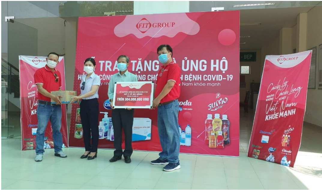
FIT Group trao quà cho Sở Y Tế Đà Nẵng

đóng lon thương hiệu Westfood. Tổng giá trị hỗ trợ hơn 303 triệu đồng.