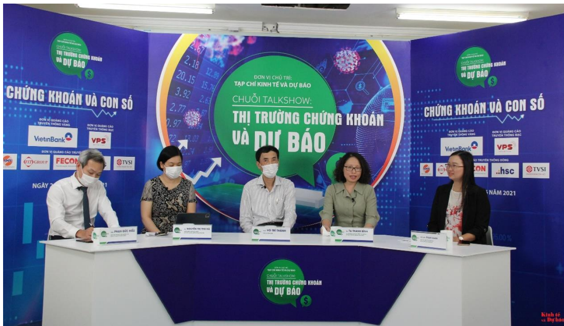
chuyên gia tham dự talkshow.

Chiều nay (ngày 28/6), Chuyên đề 1 với chủ đề: “Chứng khoán và những con số” đã diễn ra tại Hà Nội, mở đầu cho chuỗi talkshow “Thị trường chứng khoán và dự báo”, do Tạp chí Kinh tế và Dự báo, cơ quan ngôn luận của Bộ Kế hoạch và Đầu tư tổ chức. Chuỗi talkshow này liên tiếp diễn ra từ ngày 28/6 đến 30/6/2021.