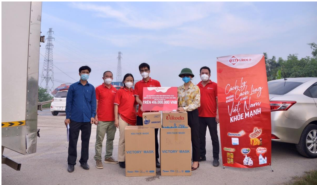
Đại diện huyện Thuận Thành, Bắc Ninh nhận quà tài trợ

Những ngày qua, hình ảnh các lực lượng tuyến đầu chống dịch ở Bắc Ninh kiệt sức sau những nỗ lực quên mình để khám chữa bệnh, xét nghiệm, truy vết, vận chuyển người cách ly... khiến cho bất cứ ai cũng không khỏi xúc động. Với tinh thần “Cách ly nhưng không cách lòng – Vì một Việt Nam khỏe mạnh” , FIT Group mong muốn chung tay, góp sức cùng với xã hội đẩy lùi dịch bệnh Covid – 19, và hi vọng tinh thần này sẽ lan tỏa mạnh mẽ đến cộng đồng.