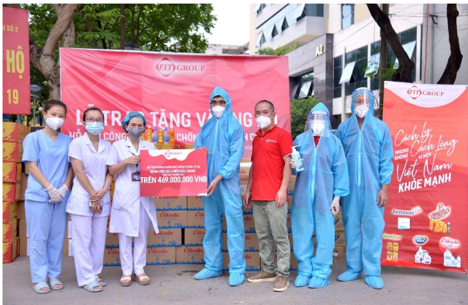
FIT Group trao tặng vật phẩm cho đại diện Bệnh viện dã chiến Bắc Giang

phẩm là gel rửa tay không dùng nước và dung dịch rửa tay Dr.Clean; 1.742 sản phẩm trái cây đóng lon Westfood các loại; cùng 2.212 hộp thuốc, trong đó chủ yếu là thuốc giảm đau hạ sốt Panalgan, vitamin C tăng sức đề kháng; và 4.500 khẩu trang y tế N95. Đây là 2 địa điểm trọng yếu trong công tác đẩy lùi dịch bệnh của tỉnh. Tổng giá trị hàng hóa, vật phẩm tài trợ hơn 838 triệu đồng.