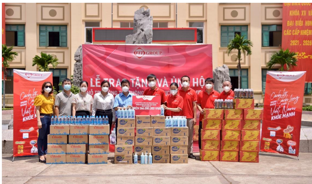
Đại diện UBND huyện Lục Nam tiếp nhận vật phẩm hỗ trợ từ FIT Group

Các hàng hóa, vật phẩm vô cùng thiết yếu, hỗ trợ đắc lực cho công tác đẩy lùi dịch bệnh. Công tác vận chuyển, tiếp nhận thực hiện theo đúng quy tắc đảm bảo an toàn dịch bệnh của các cơ sở được hỗ trợ.