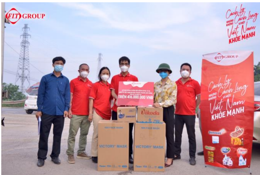
Đại diện Mặt trận Tổ quốc huyện Thuận Thành, Bắc Ninh nhận quà tài trợ.

Tại các điểm trao quà tại Bắc Giang và Bắc Ninh, đại diện đơn vị tiếp nhận ủng hộ cảm kích trước tấm lòng của FIT Group. Đơn vị đã quan tâm đến tinh thần của anh, chị em ngày đêm chiến đấu trong bối cảnh dịch ngày càng phức tạp.