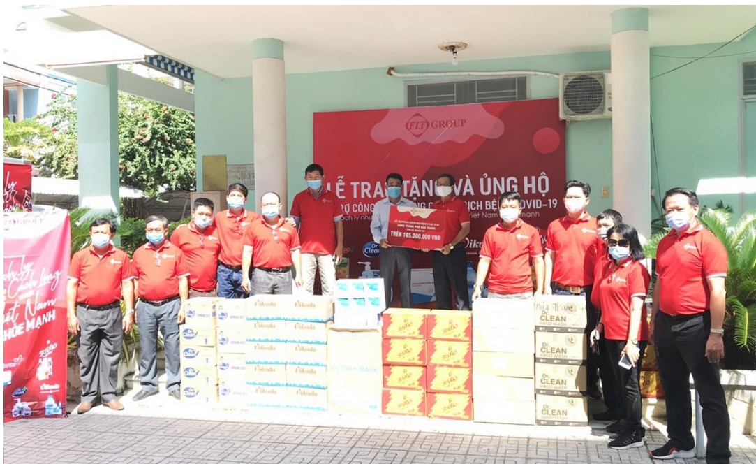
FIT Group trao quà cho đại diện UBND TP. Nha Trang

Tiếp nhận và trò chuyện cùng đại diện đoàn hỗ trợ FIT Group, đại diện của Trung tâm Kiểm soát bệnh tật tỉnh Khánh Hòa, UBND thành phố Nha Trang, Công an tỉnh Khánh Hòa đều bày tỏ sự kích thích, sự động viên về vật chất lẫn tinh thần của tập đoàn F.I.T đã tiếp thêm sức mạnh để các lực lượng y tế, lực lượng chức năng của tỉnh Khánh Hòa có ý chí, nguồn lực để đẩy lùi dịch bệnh.