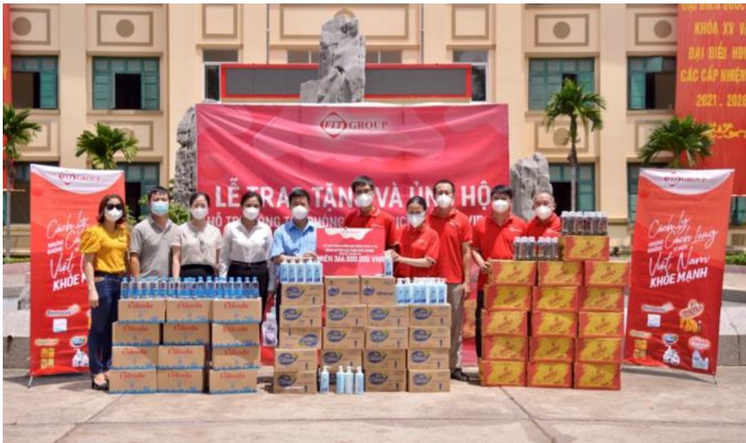
Đại diện UBND huyện Lục Nam tiếp nhận vật phẩm hỗ trợ từ FIT Group.

Tại các điểm trao quà tại Bắc Giang và Bắc Ninh, đại diện đơn vị tiếp nhận ủng hộ cảm kích trước tấm lòng của FIT Group. Đơn vị đã quan tâm đến tinh thần của anh, chị em ngày đêm chiến đấu trong bối cảnh dịch ngày càng phức tạp.