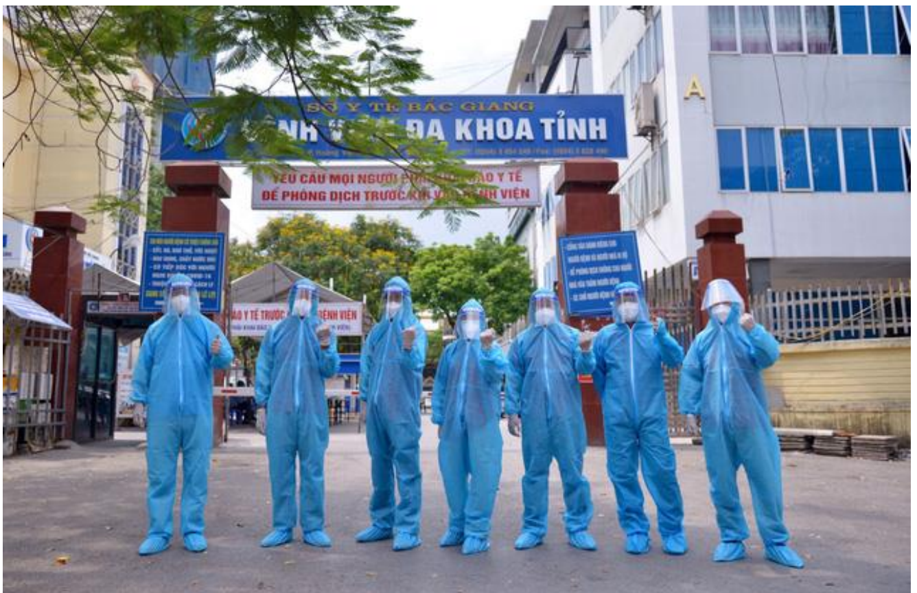
Đoàn thiện nguyện phần chấn, tự tin khi mang vật phẩm tài trợ vào “tâm dịch” Bắc Giang