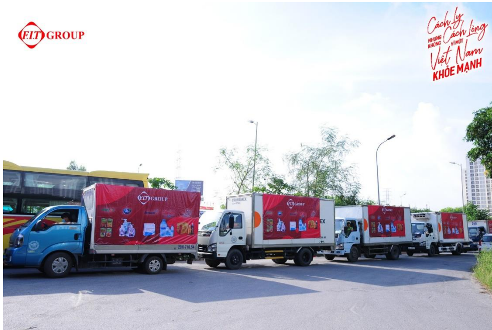
Đoàn xe hỗ trợ của FIT Group đến các tỉnh, thành

với sự khó khăn, thiếu thốn cả về vật chất lẫn tinh thần. Vì vậy, chúng tôi hy vọng những đóng góp nhỏ bé của chúng tôi sẽ đáp ứng tốt nhất nhu cầu của người bệnh cũng như góp phần lớn cho hệ thống y tế hỗ trợ đẩy lùi đại dịch”.