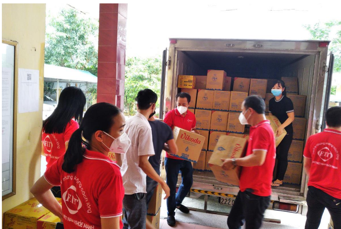
FIT Group vận chuyển hàng hóa ủng hộ 2 tỉnh Vĩnh Phúc và Hưng Yên

Vĩnh Phúc và Hưng Yên là 2 địa phương có ghi nhận ca nhiễm Covid – 19 trong đợt dịch thứ 4 này. Nhiều địa phương, cơ sở y tế của 2 tỉnh này đã bị cách ly, giãn cách. Tuy nhiên, do có sự vào cuộc đồng bộ của các cơ quan hữu quan và sự đồng lòng của người dân nên dịch bệnh Covid-19 tại Vĩnh Phúc và Hưng Yên đã được kiểm soát.