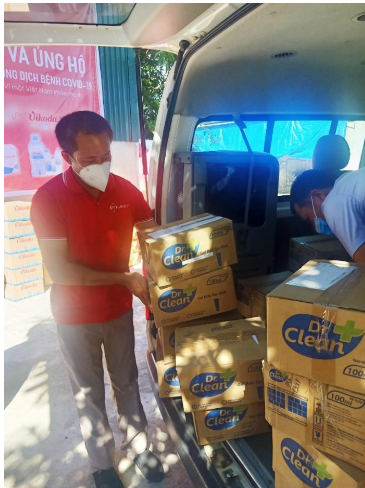
FIT Group vận chuyển hàng hóa lên xe tiếp nhận của Sở Y Tế Hà Tĩnh

Cụ thể đoàn đã trao tặng Sở Y tế Hà Tĩnh 112 thùng nước khoáng thiên nhiên Vikoda; 290 thùng nước khoáng tăng lực Sumo; 1152 tube gel rửa tay Dr.Clean; 80 hộp thuốc Giảm đau hạ sốt Panalgan cùng 2000 khẩu trang y tế N95. Tổng giá trị hỗ trợ hơn 139 triệu đồng.