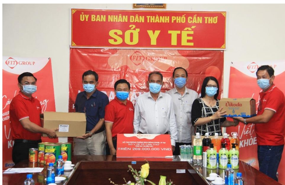
Đại diện FIT Group đến trao quà cho Sở Y Tế Cần Thơ

Cụ thể, FIT Group đã trao tặng Sở Y tế Thành phố Cần Thơ 3451 sản phẩm trái cây đóng lon thương hiệu Westfood; 141 thùng nước khoáng thiên nhiên Vikoda; 305 thùng nước khoáng tăng lực Sumo; 1212 tube gel rửa tay Dr.Clean; 60 hộp thuốc Giảm đau hạ sốt Panalgan cùng 1000 khẩu trang y tế N95.