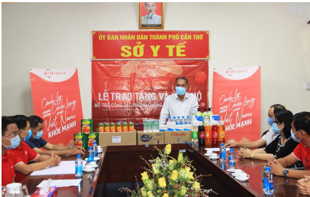
Đại diện Sở Y Tế Cần Thơ gửi lời cảm ơn FIT Group

cường năng lực xét nghiệm cũng như đầu tư các thiết bị, sản phẩm, các vật tư tiêu hao để phục vụ công tác phòng chống dịch. Bên cạnh đó, TP Cần Thơ đã khởi động toàn bộ hệ thống, các tổ truy vết trong cộng đồng, thường xuyên tăng việc “đi từng ngõ, gõ từng nhà”, rà soát các đối tượng di chuyển đến địa phương, để qua đó theo dõi danh sách, khai báo y tế kịp thời.