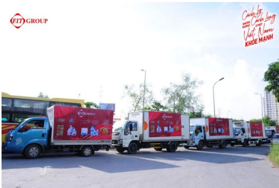
Đoàn xe hỗ trợ của FIT Group đến các tỉnh, thành.

góp nhỏ sẽ đáp ứng nhu cầu của người bệnh, góp phần lớn cho hệ thống y tế hỗ trợ đẩy lùi đại dịch.