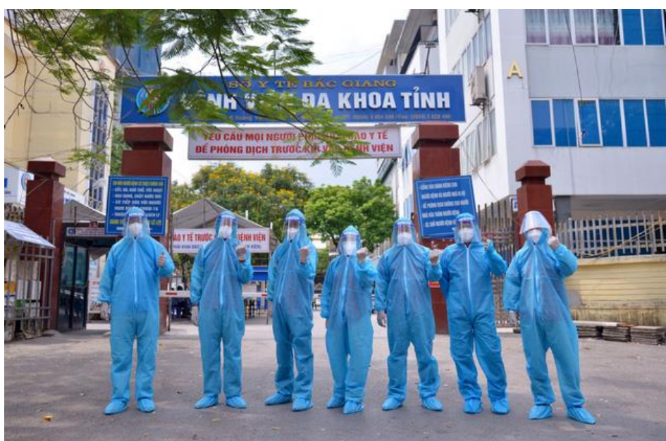
Đoàn thiện nguyện phần chần, tự tin khi mang vật phẩm tài trợ vào “tâm dịch” Bắc Giang.

Việc thực thi trách nhiệm xã hội không phải doanh nghiệp nào cũng có thể và có tâm để thực hiện bởi đó là một sự đánh đổi giữa tài chính ngắn hạn và tương lai dài hạn. Các nghiên cứu thực tiễn về thực hành trách nhiệm xã hội cũng cho thấy mối liên hệ giữa giá trị doanh nghiệp và các hoạt động trách nhiệm xã hội.