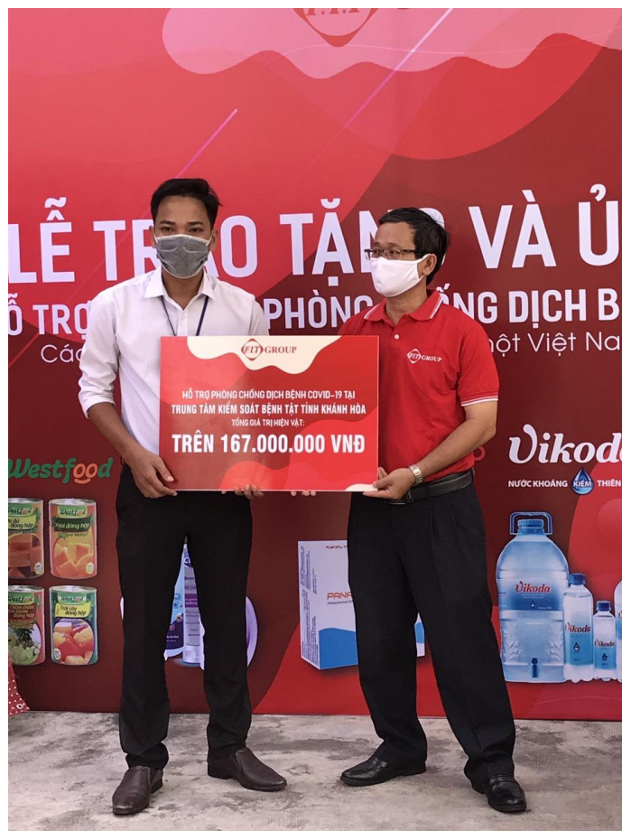
FIT Group trao quà cho đại diện CDC Khánh Hòa

Cụ thể, FIT Group đã trao tặng Trung tâm Kiểm soát bệnh tật tỉnh Khánh Hòa, UBND thành phố Nha Trang, Công an tỉnh Khánh Hòa tổng cộng 387 thùng nước Vikoda các loại; 554 thùng nước khoáng tăng lực Sumo; 2.208 sản phẩm là gel, dung dịch rửa tay và sữa rửa tay Dr.Clean; 561 sản phẩm Nha đam đóng lon thương hiệu Westfood; 60 hộp thuốc Giảm đau hạ sốt Panalgin cùng 3.000 khẩu trang y tế N95.