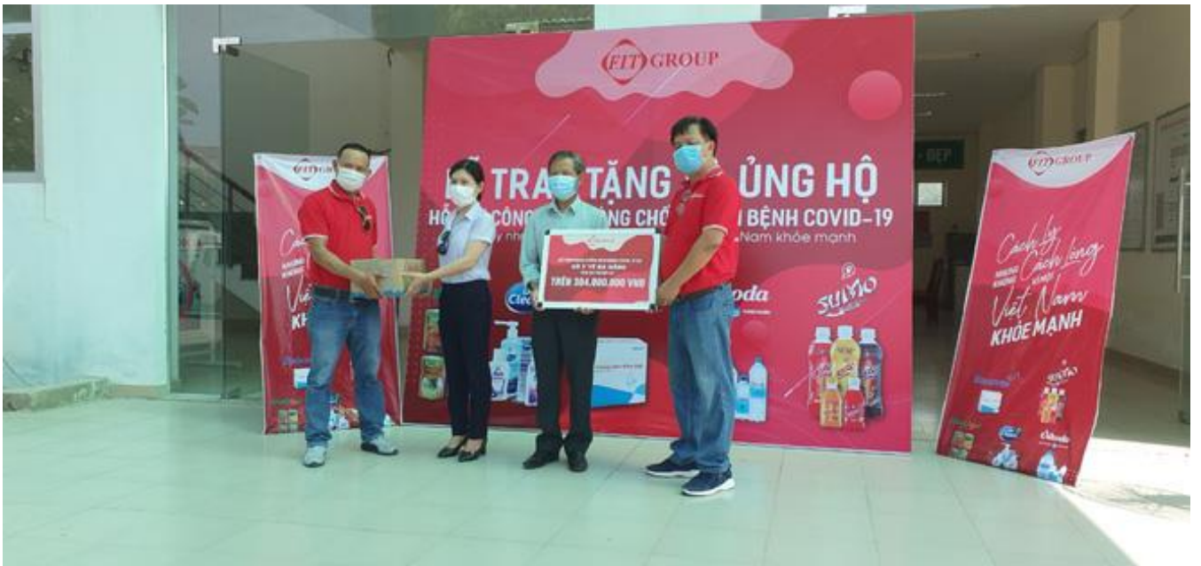
F.I.T Group trao quà cho đại diện Sở Y tế Đà Nẵng và Bệnh viện Đa khoa Hoàn Mỹ.

Bên lề chương trình, F.I.T Group còn có nhiều hoạt động cộng đồng ý nghĩa hướng đến hỗ trợ bộ máy y tế, giảm tải khó khăn và gia tăng sự chủ động trong việc kiểm soát dịch bệnh. Điển hình là nghĩa cử trao tặng cho Trung tâm Y tế TP. Vĩnh Long, tỉnh Vĩnh Long máy xét nghiệm Covid-19 Real-Time PCR trị giá hơn 3 tỷ đồng, có khả năng phân tích cùng lúc 32 mẫu xét nghiệm trong vòng 20 – 45 phút, đáp ứng khối lượng từ 300 – 400 mẫu/ngày.