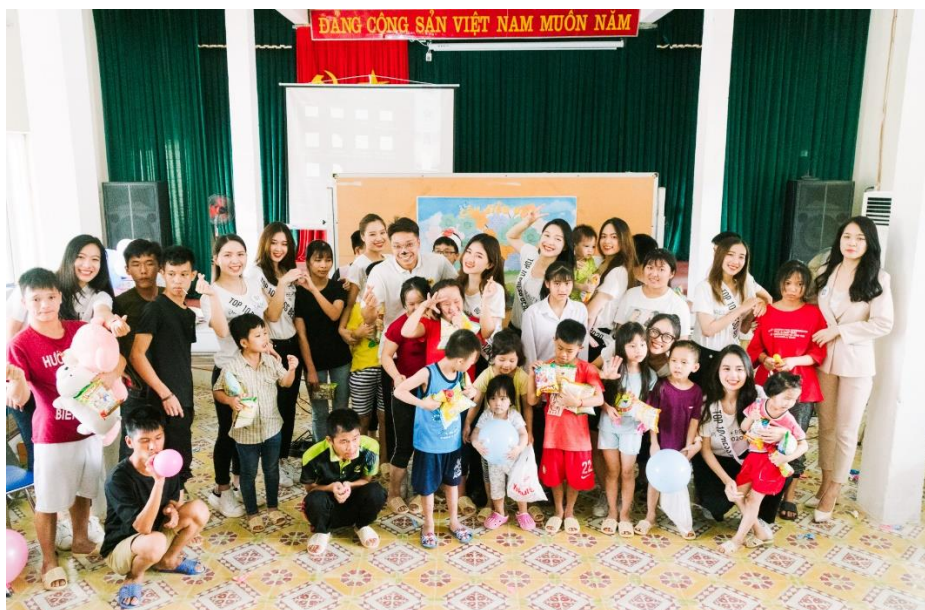
Top 10 thí sinh tại vòng thi Miss Nhân Ái – Press Beauty 2020 tặng quà cho các em nhỏ

truyền, qua đó Top 10 thí sinh vòng thi Miss Nhân Ái sẽ cùng với các nhà tài trợ tổ chức chuyến thăm hỏi, tặng quà giao lưu với các em nhỏ mồ côi tại Trung tâm Bảo trợ Xã hội IV thuộc thị trấn Tây Đằng, huyện Ba Vì, Hà Nội nhằm hỗ trợ những thiếu thốn về cơ sở vật chất và tinh thần cho các bạn nhỏ tại Trung Tâm.