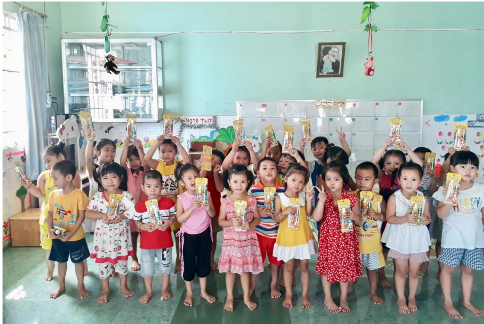
Hình ảnh các bé thích thú khi nhận được bộ quà tặng dễ thương thiết yếu từ Dr. Kool

Trường mầm non Hoa Lan là một trong những điểm trường đạt chuẩn Quốc gia của tỉnh Vĩnh Long. Kể từ ngày thành lập, trường không ngừng phấn đấu trong công tác giảng dạy và chăm sóc trẻ để các em đến trường luôn nhận được những tiêu chuẩn tốt nhất. Tuy nhiên, ảnh hưởng của dịch Covid 19 thời gian vừa qua khiến các bé phải nghỉ học trong thời gian dài, nếp sinh hoạt, học tập bị gián đoạn, cùng với đó phần lớn gia đình của các em cũng bị giảm thu nhập kinh tế. Thấu hiểu và mong muốn chia sẻ cùng nhà trường và gia đình các em nhỏ, nhân dịp ngày Quốc tế Thiếu nhi 1/6, nhãn hàng Dr.Kool của CTCP FIT Cosmetics đã phối hợp với Ban Lãnh đạo nhà trường trao tặng 480 phần quà bao gồm Kem đánh răng Dr.Kool Kids và Bàn chải đánh răng trẻ Dr.Kool cá ngựa. Đây là những phần quà xinh xắn, thiết thực hàng ngày, giúp các bé yêu thích hơn với công việc chăm sóc răng miệng, từ đó nâng cao ý thức giữ gìn vệ sinh răng miệng cá nhân của các em.