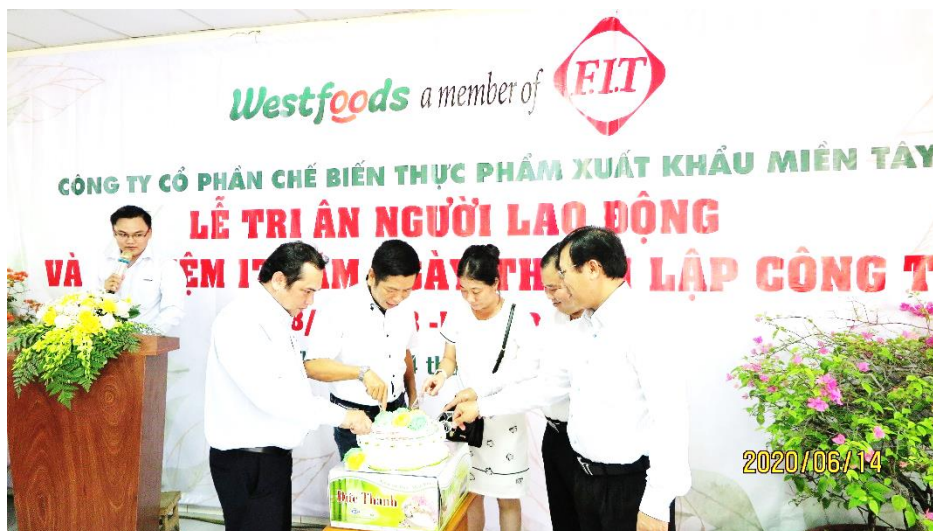
Đại diện Ban Lãnh đạo cùng cắt bánh kỷ niệm ngày thành lập công ty

đã sở hữu một trong những nhà máy hiện đại bậc nhất Việt Nam với 4 dây chuyền IQF, 2 dây chuyền đóng lon thanh trùng theo công nghệ sản xuất tiêu chuẩn Châu Âu và xuất khẩu đa dạng các mặt hàng nông sản sang các thị trường khó tính như Mỹ, Nhật, Hàn Quốc và các nước Châu Âu... Đặc biệt, kể từ khi trở thành một thành viên của F.I.T Group, với năng lực tài chính và sự tham vấn, định hướng của Tập đoàn, Westfood ngày càng hoàn thiện năng lực sản xuất, kinh doanh và gặt hái thêm nhiều thành tựu vượt trội, góp phần khẳng định uy tín, giá trị thương hiệu của Westfood trong mắt bạn bè quốc tế.