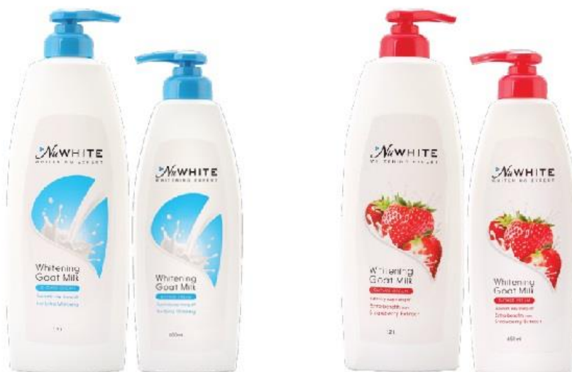
Sữa Tắm NuWhite Whitening Goat Milk từ tinh chất sữa dê

NuWhite được ra đời xuất phát từ mong muốn là sữa tắm làm sáng các vùng da tối và loại bỏ hắc sắc tố trên da, làm cho làn da mịn đẹp và trắng sáng một cách tự nhiên nhờ kết hợp với phương pháp tắm bằng sữa truyền thống của các bậc vua chúa ngày xưa, là cứu tinh cho làn da phụ nữ Việt Nam trong những ngày hè oi bức.