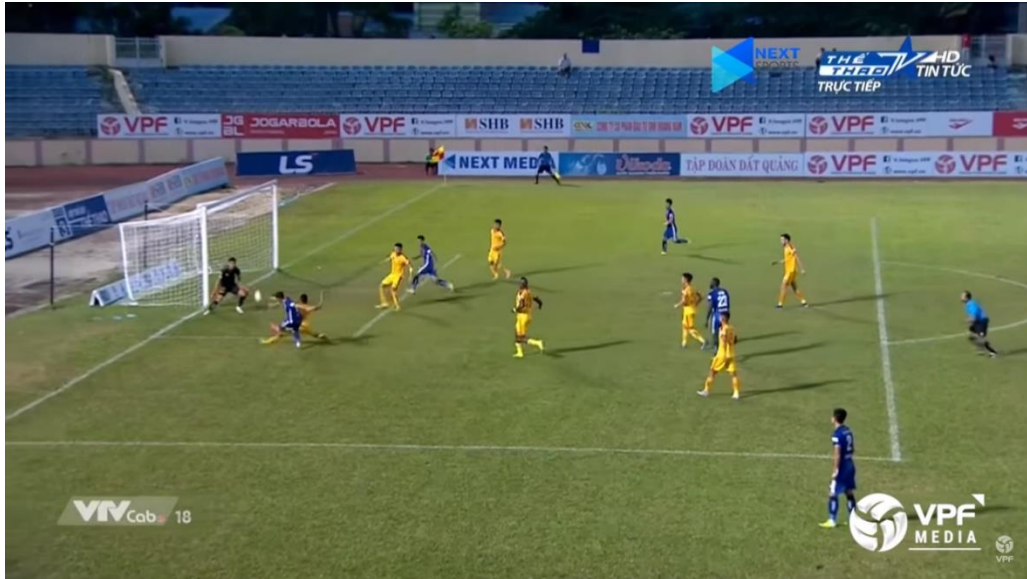
Biển hiệu nhà tài trợ Vikoda trên sân thi đấu

Với lối chơi vượt trội và chủ động, Quảng Nam đã giành thắng lợi với tỷ số 2 – 1 trong cảm xúc vỡ òa của người hâm mộ. Hai cầu thủ ghi bàn lần lượt là tân binh Ibou Kebe ở phút thứ 52 và Như Tuấn ở phút thứ 67. Dù Thanh Hóa rút ngắn cách biệt sau đó bằng một bàn thắng khá đẹp của Hoàng Dương nhưng cuối cùng cũng phải ngậm ngùi chịu thua trước đội bóng xứ Quảng. Ngày 11/06 tới đây, CLB Quảng Nam sẽ gặp mặt SHB Đà Nẵng, hứa hẹn sẽ mang tới cho người hâm mộ trận đấu đầy cam go và thử thách.