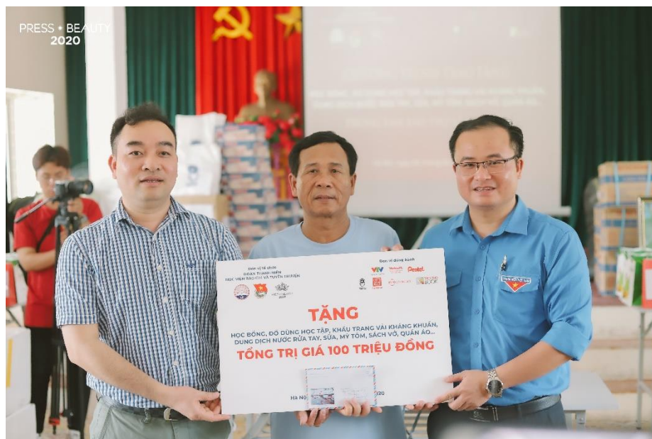
Đại diện chương trình Press Beauty tặng quà cho trung tâm

Trung tâm Bảo trợ xã hội IV hiện đang chăm sóc, nuôi dưỡng khoảng 180 trẻ em mồ côi từ 5 – 18 tuổi trên địa bàn thành phố Hà Nội. Đồng hành với phần thi “Miss Nhân ái” trong khuôn khổ chương trình Press Beauty 2020 – Tài sắc nữ sinh báo chí , F.I.T Group đã mang đến cho các em nhỏ những phần quà ý nghĩa, thiết thực trong cuộc sống hàng ngày, bao gồm 100 chai Sữa rửa tay Dr.Clean và 100 bàn chải đánh răng Dr.Kool. Những món quà từ F.I.T Group mang ý nghĩa chia sẻ, gửi gắm yêu thương, đồng thời là nguồn động viên to lớn, để cho những trái tim nhỏ bé tin rằng: xã hội sẽ luôn đồng cảm và quan tâm sâu sắc đến các em.