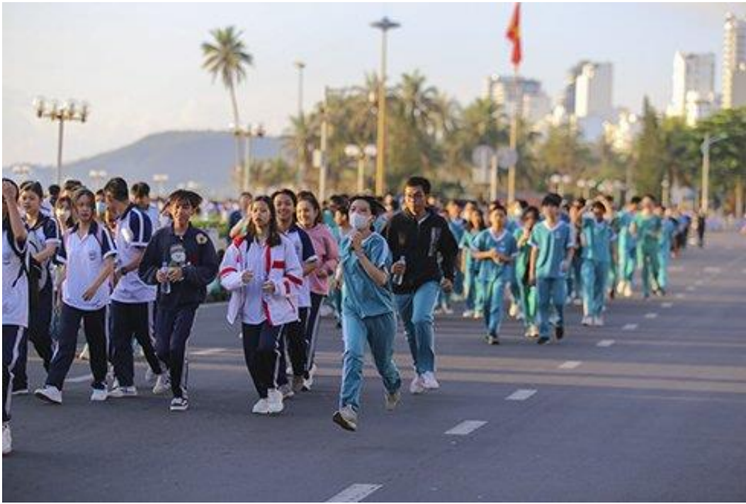
Người dân tham gia “Ngày chạy Olympic vì sức khỏe toàn dân năm 2021

Tại thành phố Nha Trang, những năm qua, cuộc vận động “Toàn dân rèn luyện thân thể theo gương Bác Hồ vĩ đại” luôn được các cấp chính quyền và các doanh nghiệp trên địa bàn quan tâm. Điển hình năm nay, Vikoda – doanh nghiệp uy tín hàng đầu tỉnh Khánh Hòa, chuyên sản xuất và cung cấp các loại nước uống bắt nguồn từ nguồn khoáng Đảnh Thạnh có độ pH từ 8.5 đến 9.5 vô cùng quý hiếm, đã tham gia tài trợ cho Lễ phát động và Ngày chạy Olympic vì sức khỏe toàn dân năm 2021. Với tinh thần ủng hộ người dân rèn luyện thể dục, thể thao nâng cao sức khỏe, như sứ mệnh và công ty Vikoda vẫn luôn theo đuổi đó là nâng cao sức khỏe của cộng đồng, Vikoda đã cung cấp nước uống cho các Đại biểu, Ban tổ chức và toàn bộ người tham gia chạy trong buổi lễ phát động.