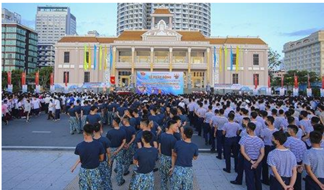
Quang cảnh các tầng lớp chiến sỹ, nhân dân tham gia lễ phát động

Đây là hoạt động thiết thực kỷ niệm 74 năm Ngày thành lập ngành thể dục thể thao Việt Nam và Ngày Bác Hồ viết bài “Thể dục và sức khỏe” kêu gọi đồng bào tập thể dục, thể thao. Đây là năm thứ 6, UBND thành phố Nha Trang triển khai trong phạm vi toàn thành phố nhằm động viên các tầng lớp nhân dân tham gia tập luyện thể dục, thể thao, hưởng ứng Cuộc vận động “Toàn dân rèn luyện thân thể theo gương Bác Hồ vĩ đại”, góp phần nâng cao sức khỏe để phục vụ học tập, lao động sản xuất, xây dựng và bảo vệ Tổ quốc.