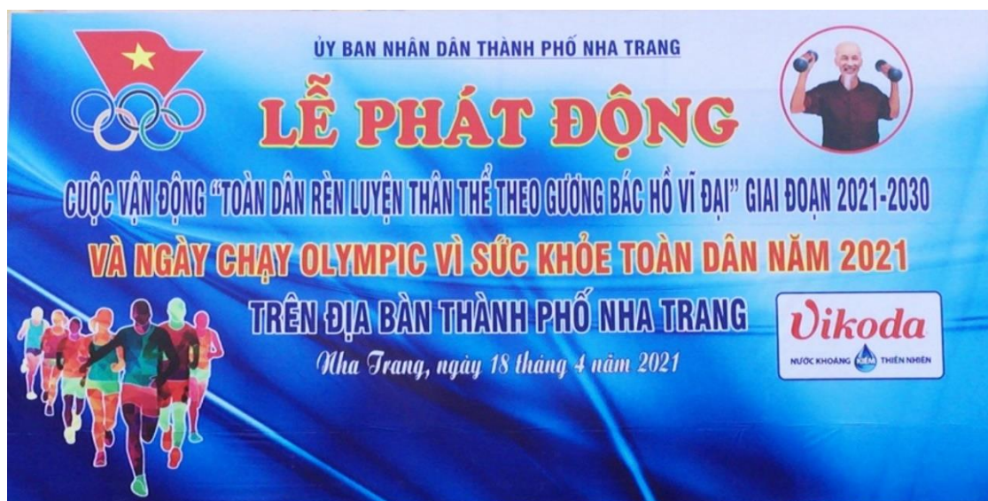
Backdrop của chương trình phát động

Lễ phát động Cuộc vận động “Toàn dân rèn luyện thân thể theo gương Bác Hồ vĩ đại giai đoạn 2021 – 2030” và Ngày chạy Olympic vì sức khỏe toàn dân năm 2021 trên địa bàn thành phố Nha Trang đã được tổ chức tại Quảng trường 2 tháng 4, phường Lộc Thọ, thành phố Nha Trang vào trung tuần tháng 4/2021.