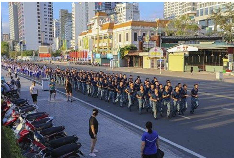
Đông đảo chiến sỹ, học sinh sinh viên nhiệt tình hưởng ứng Ngày chạy

Tại thành phố Nha Trang, những năm qua, cuộc vận động “Toàn dân rèn luyện thân thể theo gương Bác Hồ vĩ đại” luôn được các cấp chính quyền và các doanh nghiệp trên địa bàn quan tâm. Điển hình năm nay, Vikoda – doanh nghiệp uy tín hàng đầu tỉnh Khánh Hòa, chuyên sản xuất và cung cấp các loại nước uống bắt nguồn từ nguồn khoáng Đảnh Thạnh có độ pH từ 8.5 đến 9.5 vô cùng quý hiếm, đã tham gia tài trợ cho Lễ phát động và Ngày chạy Olympic vì sức khỏe toàn dân năm 2021. Với tinh thần ủng hộ người dân rèn luyện thể dục, thể thao nâng cao sức khỏe, như sứ mệnh và công ty Vikoda vẫn luôn theo đuổi đó là nâng cao sức khỏe của cộng đồng, Vikoda đã cung cấp nước uống cho các Đại biểu, Ban tổ chức và toàn bộ người tham gia chạy trong buổi lễ phát động.