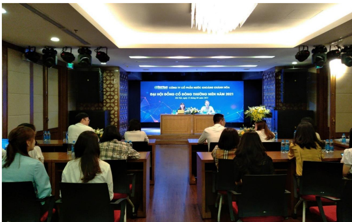
Toàn cảnh đại hội

Trong năm 2020, trước sự tác động của đại dịch Covid – 19, ngành nước uống tại Việt Nam đã bị ảnh hưởng đáng kể, không ngoại trừ Vikoda. Nhưng Hội đồng quản trị đã tăng cường chỉ đạo Ban điều hành đẩy mạnh các hoạt động sản xuất kinh doanh của Công ty như ổn định cơ cấu tổ chức, xây dựng thêm xưởng máy, kho bãi; phát triển kênh phân phối, nghiên cứu phát triển sản phẩm mới, mở rộng thêm nhiều thị trường. Chính vì vậy, doanh nghiệp vẫn đạt tổng doanh thu 247,88 tỷ đồng, giảm 14% so với năm 2019, lợi nhuận đạt 2,610 tỷ đồng.