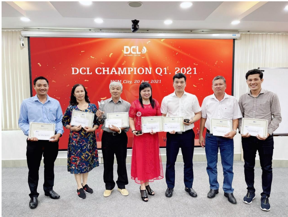
Giải thưởng dành cho Chi nhánh Xuất Sắc Quý I Đạt Trên 120% Chỉ Tiêu: Chi nhánh Cần Thơ và Chi nhánh Cà Mau