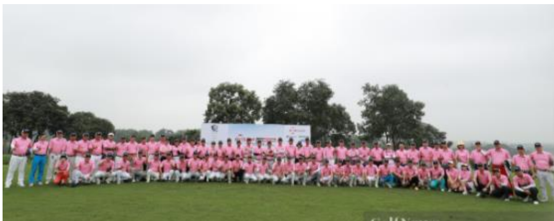
Hơn 130 Golfer tham dự giải

Đây là giải đấu nằm trong chuỗi các sự kiện Kỷ niệm 25 năm ra trường của khóa K34 Trường đại học Kinh Tế quốc dân, nhằm mang đến cho các golfer một sân chơi gặp gỡ, giao lưu. Và với sự đồng hành của Nhà tài trợ chính F.I.T, CLB K34 Kinh tế quốc dân đã tổ chức một giải đấu lớn nhất từ trước đến nay của CLB.