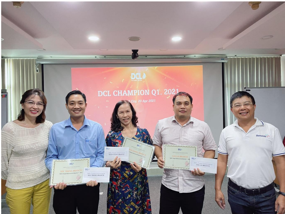
Giải thưởng dành cho Chi nhánh đạt trên 100% chỉ tiêu quý I: Chi nhánh Kiên Giang, Chi nhánh Gia Lai, Chi nhánh Sóc Trăng