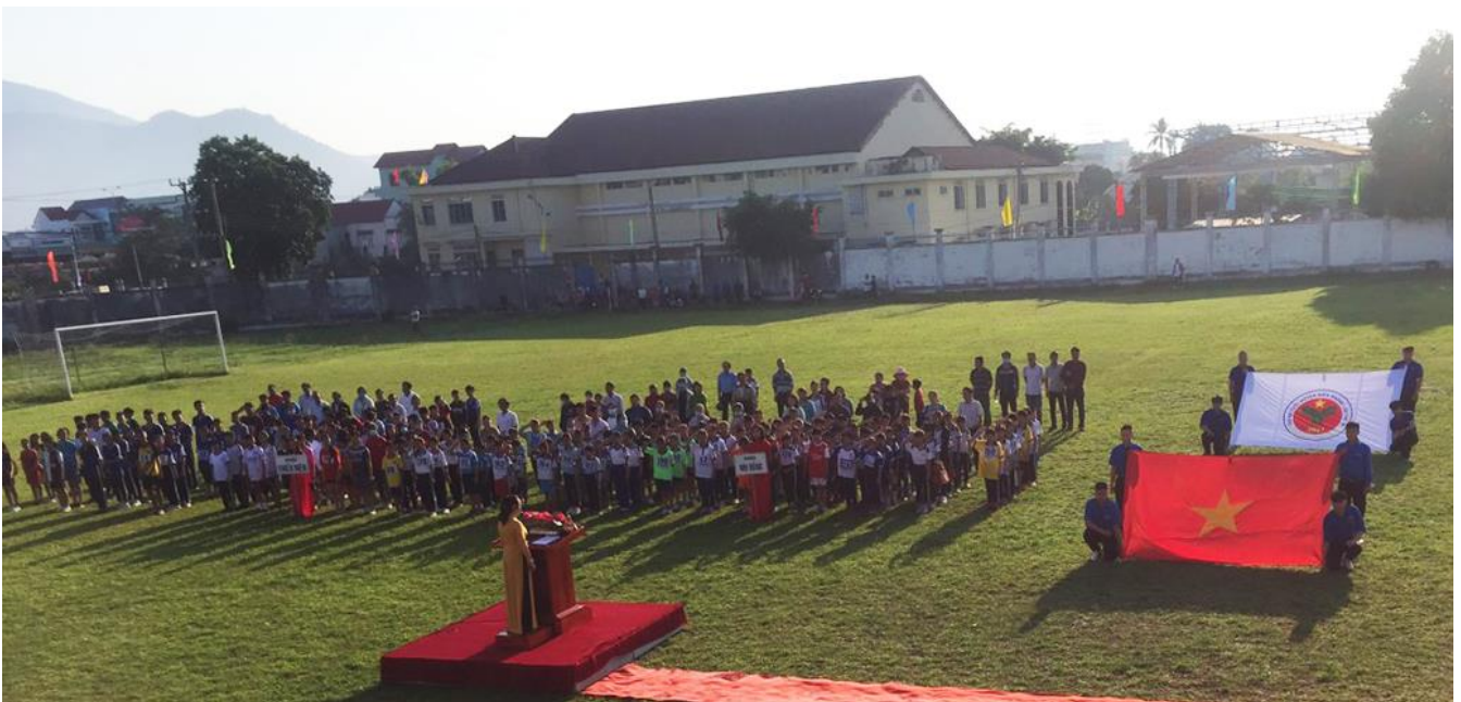
Quang cảnh Lễ khai mạc

Ngày 25/4/2021 vừa qua, tại sân vận động Trần Quý Cáp, huyện Diên Khánh đã diễn ra Lễ khai mạc Đại hội Thể dục Thể thao huyện Diên Khánh lần thứ IX năm 2021 và giải Việt già Cúp Vikoda lần thứ 44 do CTCP Nước khoáng Khánh Hòa (Vikoda) tài trợ.