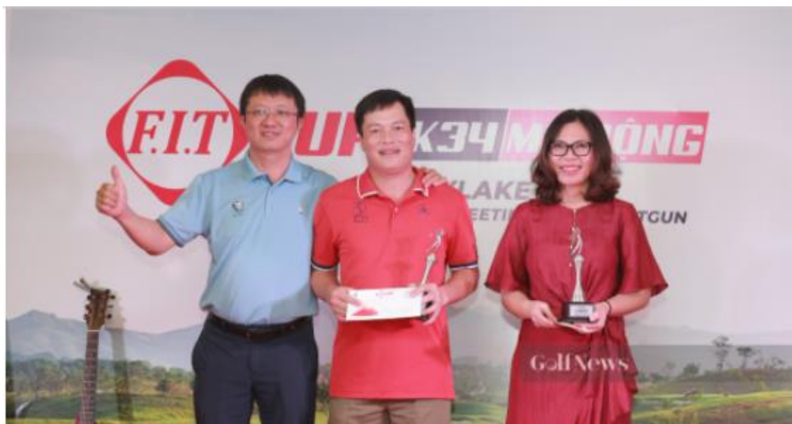
Hai golfer đạt giải kỹ thuật