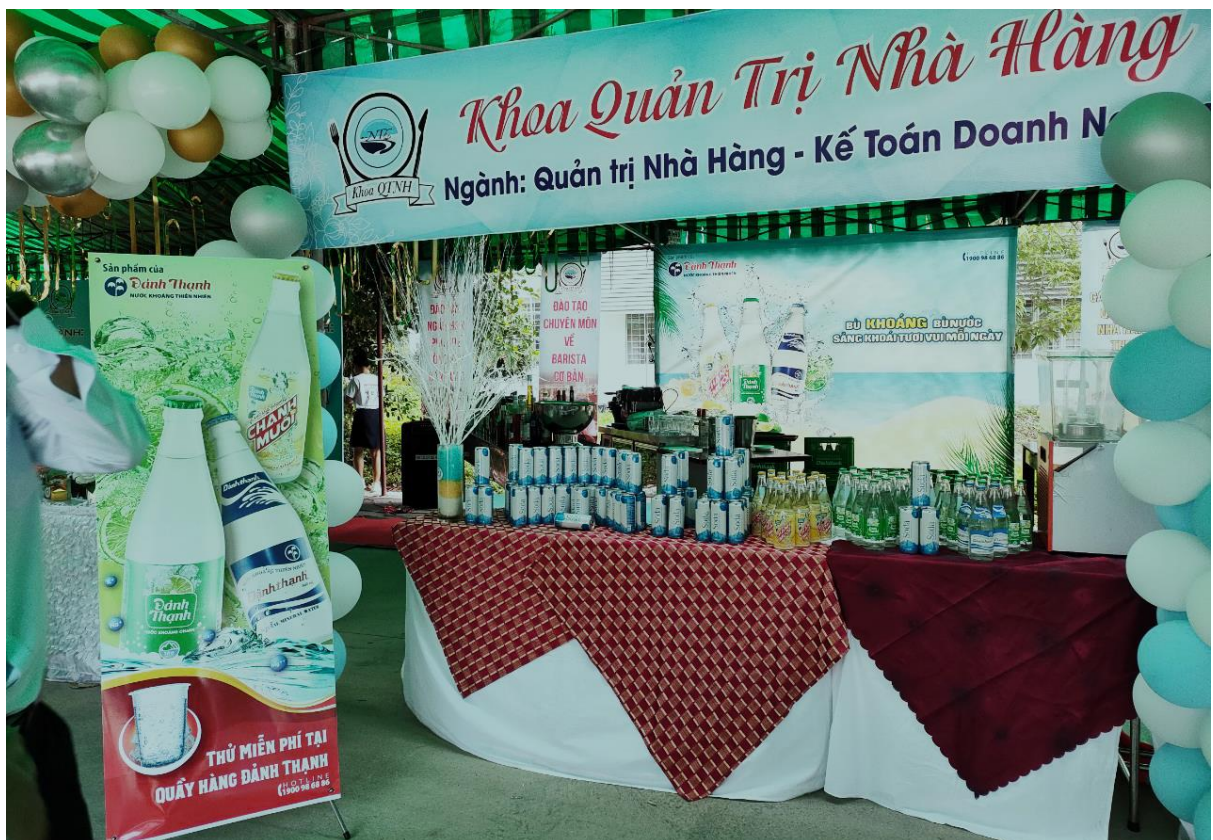
Vikoda tài trợ các sản phẩm cho các gian hàng trong Ngày hội của trường CĐ Du lịch Nha Trang

Tại chương trình, Vikoda đã đồng hành cùng gần 1.500 học sinh của 30 trường phổ thông trung học trên địa bàn tỉnh trong các hoạt động tư vấn hướng nghiệp các ngành, nghề mà Trường Cao đẳng Du lịch Nha Trang đang đào tạo (trong đó có 7 ngành theo tiêu chuẩn quốc tế và 1 ngành theo chuẩn ASEAN); cũng như các hoạt động trình diễn các ngành, nghề đào tạo do các khoa chuyên ngành của trường thực hiện.