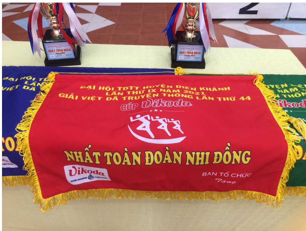
Băng khen giải Việt dã truyền thống Cúp Vikoda lần thứ 44

trong việc nâng cao sức khỏe, thể lực và xây dựng một lối sống khỏe mạnh tại địa phương, giúp Vikodathực hiện sứ mệnh cải thiện và nâng cao sức khỏe của người Việt.