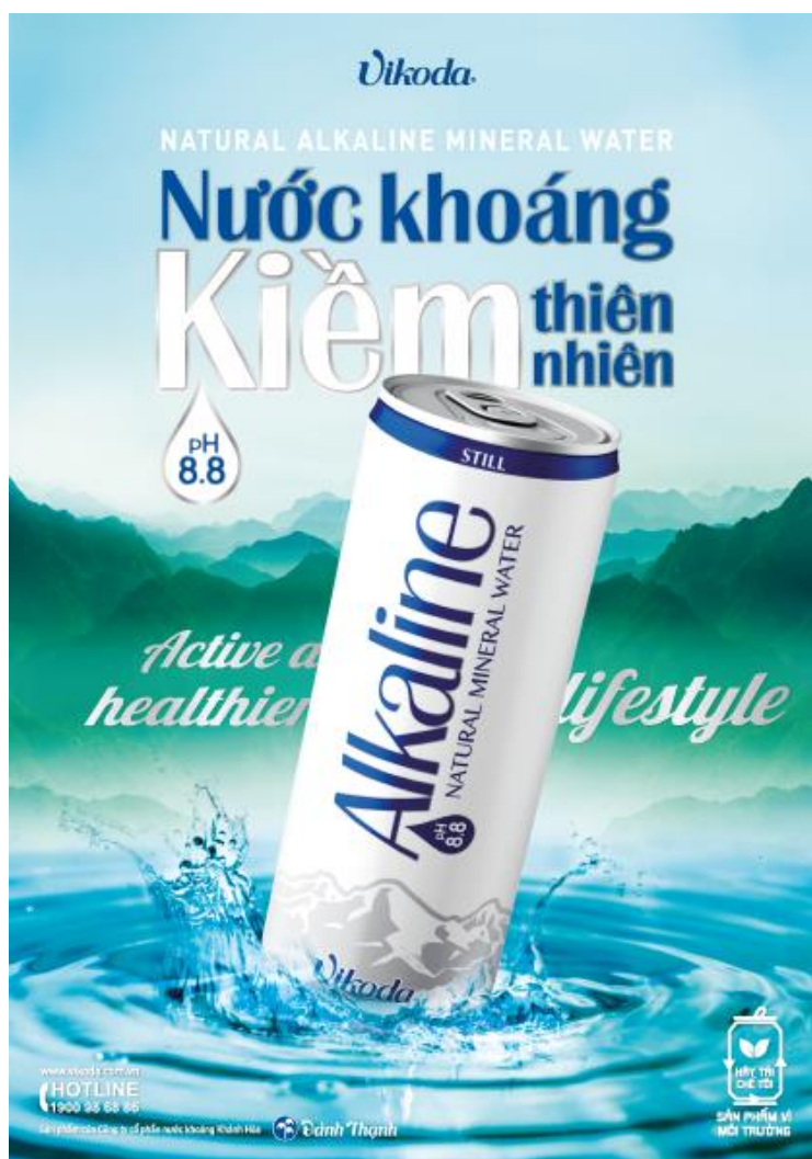
Hình ảnh lon nước khoáng thiên nhiên Vikoda Alkaline