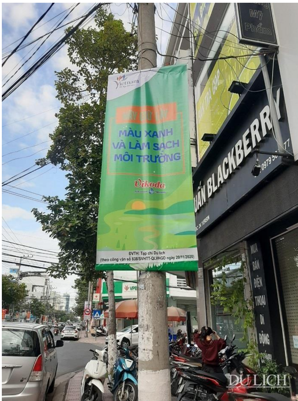
Vikoda cùng BTC tuyên truyền công tác bảo vệ môi trường