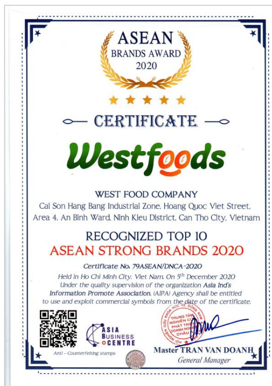
Giấy chứng nhận Westfood là thương hiệu mạnh Asean – 2020