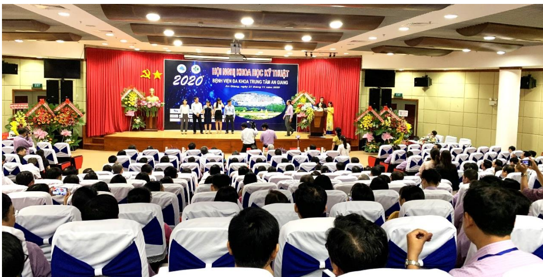
Hội nghị Khoa học Kỹ thuật năm 2020 tại Bệnh viện Đa khoa Trung Tâm An Giang

Tại hội thảo, các đại biểu đã chia sẻ các nghiên cứu, như: lịch bộ nhiễm sắc thể- sàng lọc và chẩn đoán; đánh giá kết quả điều trị suy hô hấp cấp ở trẻ sơ sinh bằng thở áp lực dương liên tục qua mũi tại Khoa Nhi – Bệnh viện Đa khoa Khu vực tỉnh; nghiên cứu tình hình và đánh giá kết quả điều trị thiếu máu, thiếu sắt ở phụ nữ mang thai 3 tháng đầu tại Khoa Khám bệnh – Bệnh viện Phụ sản TP. Cần Thơ; đánh giá kết quả và tìm hiểu một số yếu tố liên quan đến chăm sóc trẻ sơ sinh non tháng bằng phương pháp Kangaroo – Bệnh viện Đa khoa Khu vực tỉnh.