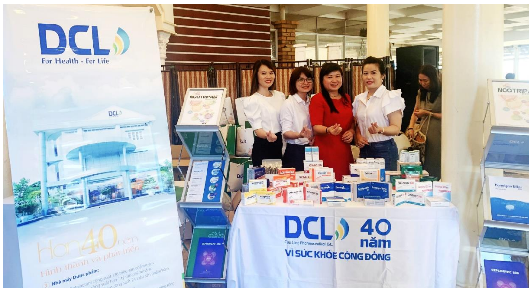
Dược Cửu Long tại các Hội nghị