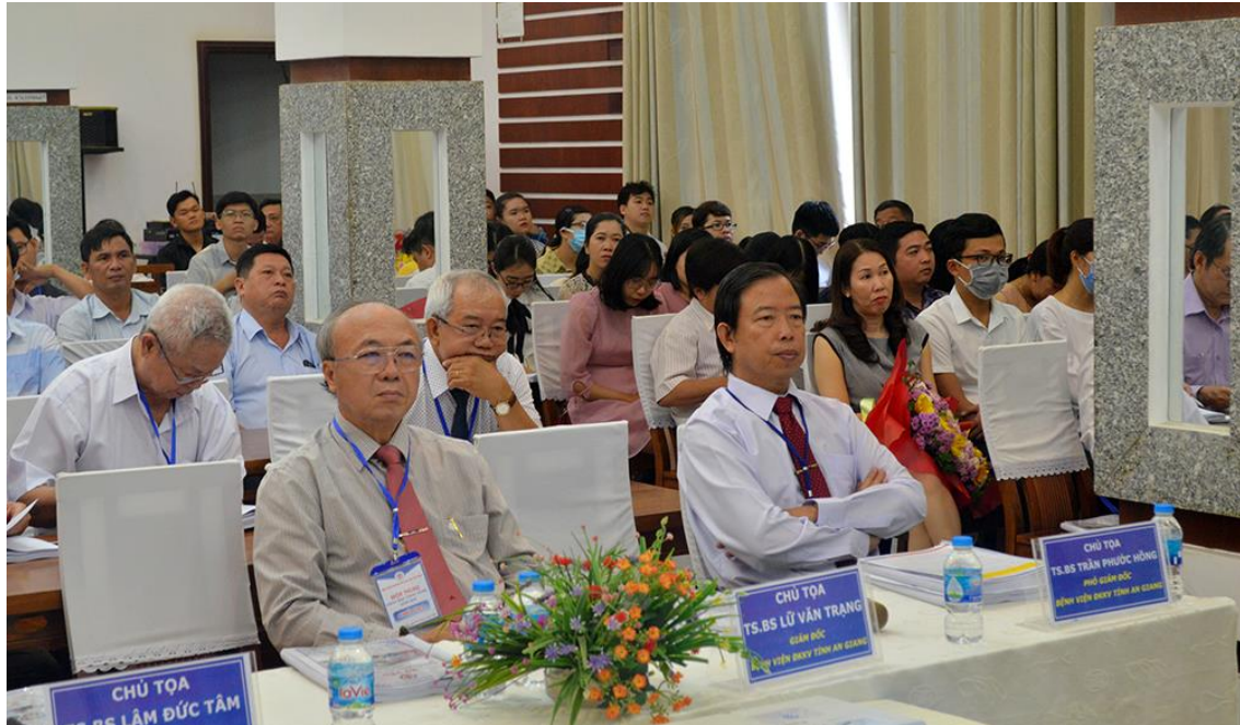
Hội nghị khoa học công nghệ tại bệnh viện Bệnh viện Đa Khoa tỉnh An Giang ngày 4/11

Cụ thể, ngày 6/11/2020, Dược Cửu Long đã tài trợ cho Hội nghị Khoa học Công nghệ năm 2020 của Bệnh viện Đa Khoa khu vực tỉnh An Giang diễn ra tại TP. Châu Đốc. Hội nghị có sự tham gia trên 500 bác sĩ, dược sĩ trên toàn tỉnh và các tỉnh lân cận.