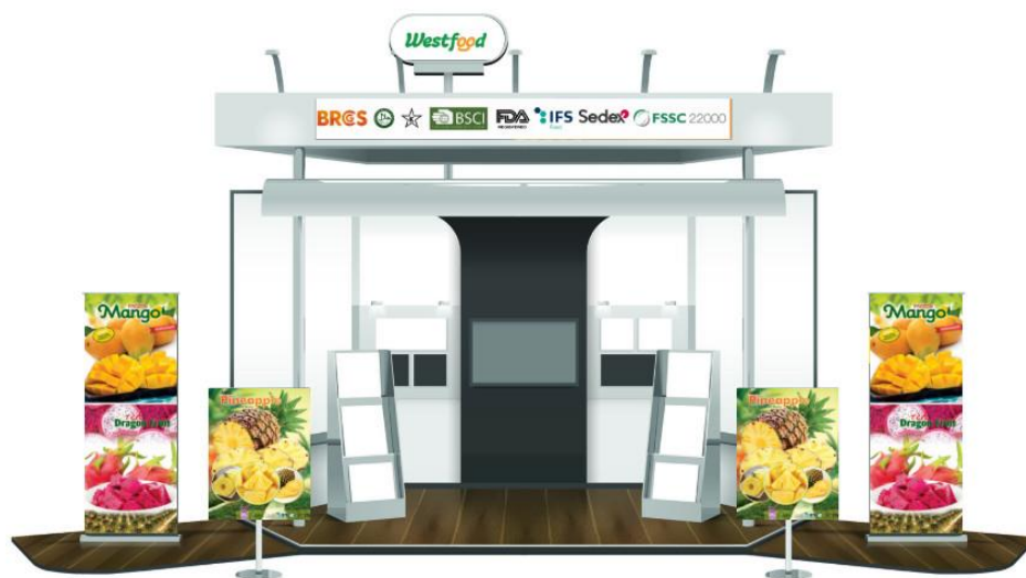
Gian hàng của Westfood tại Vietnam Foodexpo 2020 phiên bản trực tuyến

chức trực tuyến để đảm bảo an toàn cho các doanh nghiệp trong nước và quốc tế.