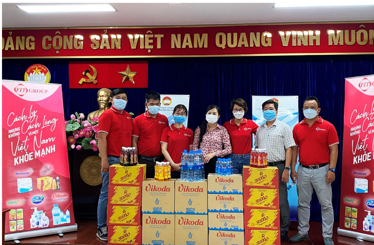
Đại diện FIT Group trao quà cho Ủy Ban Mặt Trận Tổ Quốc Việt Nam TP. Hồ Chí Minh

Ngay khi dịch bệnh có dấu hiệu bùng phát tại Tp Hồ Chí Minh, ngày 27/5/2021, FIT Group đã trao tặng cho Sở Y Tế TP. Hồ Chí Minh, Ủy Ban Mặt Trận Tổ Quốc Việt Nam TP. Hồ Chí Minh những vật phẩm thiết yếu phục vụ công tác phòng chống dịch bệnh như nước khoáng thiên nhiên Vikoda, nước tăng lực khoáng Sumo, dung dịch rửa tay và sữa rửa tay Dr.Clean các loại, trái cây đóng lon thương hiệu Westfod, khẩu trang y tế N95 và các loại thuốc thiết yếu, trong đó chủ yếu là thuốc Giảm đau hạ sốt Panalgan – loại thuốc rất cần thiết cho các bệnh viện, cơ sở y tế. Tiếp đó, trong tháng 7/2021, FIT Group cũng trao tặng Bệnh viện Nhiệt đới TP. HCM, bệnh viện tuyến đầu điều trị Covid-19 của Thành phố cũng cùng chủng loại các loại vật phẩm thiết yếu trên. Tổng giá trị của 2 lần tặng quà là 579 triệu đồng.