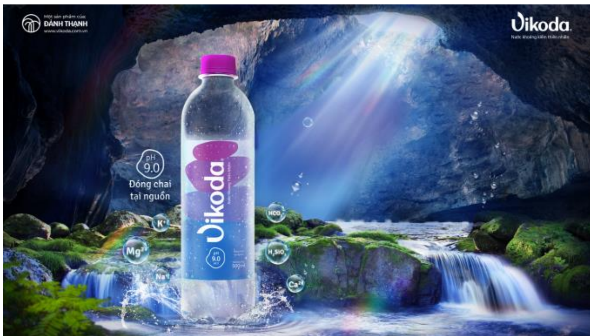
Nước khoáng kiềm thiên nhiên Vikoda.