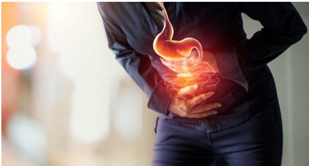
Axit dạ dày ảnh hưởng đến sức khỏe, tiềm ẩn nhiều nguy cơ bệnh lý.

Chỉ số pH (Potential of Hydrogen) mô tả tỷ lệ giữa axit và kiềm. Thang đo này dao động từ 1 đến 14, trong đó, 7 là mức trung tính, dưới 7 thiên về axit, còn trên 7 là kiềm. Khi cơ thể ở trạng thái axit, viêm loét dạ dày mãn tính có thể xảy ra.