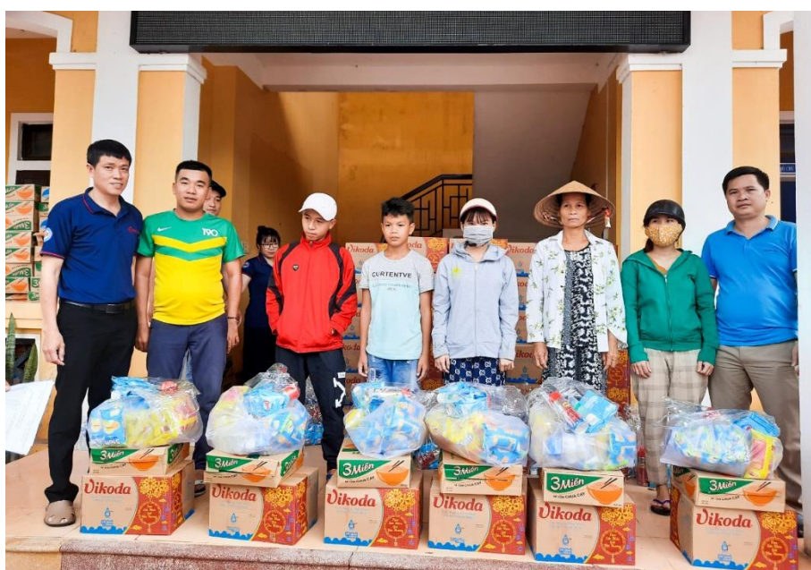
FIT Group trao quà tại xã Phú Mậu, huyện Phú Vang, Huế

Sau điểm đầu tiên tại 3 xã Cẩm Duệ, Cẩm Mỹ, Cẩm Quan thuộc huyện Cẩm Xuyên, tỉnh Hà Tĩnh, đoàn cứu trợ của FIT Group và các công ty thành viên vẫn tiếp tục thực hiện hành trình “FIT group hướng về miền Trung”, đến thăm hỏi trao tặng 300 suất quà đến bà con xã Phú Mậu, huyện Phú Vang, tỉnh Thừa Thiên Huế và xã Cam Thủy, huyện Cam Lộ, tỉnh Quảng Trị.