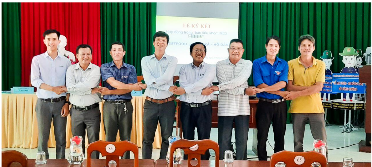
Westfood, chính quyền và các hộ nông dân xã Long Hưng tại buổi lễ ký kết.

Theo văn bản ký kết, Westfood sẽ cung cấp giống, hỗ trợ kỹ thuật và bao tiêu toàn bộ sản phẩm của các hộ dân với tổng diện tích trên 6ha. Hiện 1ha dứa MD2 theo mô hình Westfood cung cấp giống và bao tiêu sản phẩm, sau khi trừ hết chi phí người dân sẽ có thu nhập 80 triệu đồng/năm, còn nếu cộng cả công chăm sóc thì lên đến 110 triệu đồng/năm.