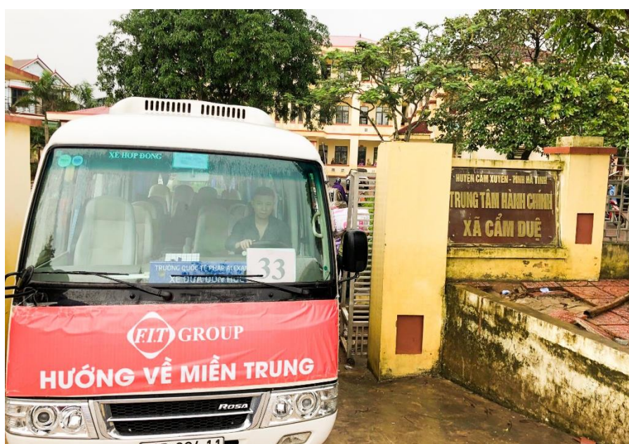
Đoàn xe cứu trợ của F.I.T Group

Trước đó, Tập đoàn đã phát động chương trình “F.I.T Group hướng về miền Trung” kêu gọi CBCNV toàn tập đoàn chung tay giúp sức ủng hộ đồng bào vùng lũ. Sau 01 tuần phát động, Tập đoàn đã quyên góp được trên 400 triệu đồng. Với số tiền này, F.I.T Group đã lập kế hoạch trao tặng 850 phần quà cho đồng bào miền Trung.