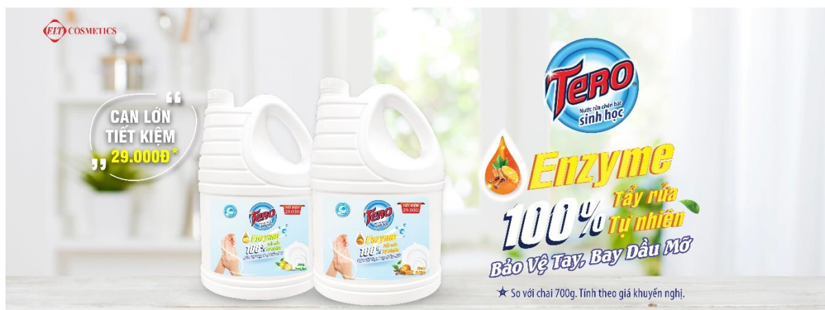
Nước rửa chén Tero can lớn 3.2kg hương Chanh và Quế cam

Nước rửa chén bát là một trong những dung dịch tẩy rửa không thể thiếu trong căn bếp của mỗi gia đình. Vì tiếp xúc với chén, đĩa, bát, xoong nồi... và nhiều vật dụng với các loại đồ vật chứa đựng, nấu nướng trực tiếp tới thực phẩm ăn uống hằng ngày, nên chất lượng của nước rửa bát cần có độ lành tính cao, đảm bảo an toàn với sức khỏe là yêu cầu tất yếu của người tiêu dùng.