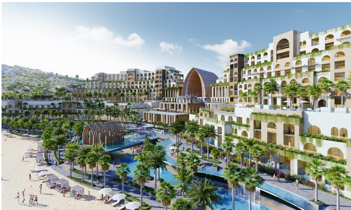
Dự án Mũi Dinh Ecopark được vinh danh tại lễ trao giải Cityscape 2019

lạc trên một địa hình độc đáo không đâu có tại Việt Nam với núi đá, các đồi cát, các tiểu sa mạc nằm ngay sát các bãi biển hình vòng cung đẹp như trong mơ.