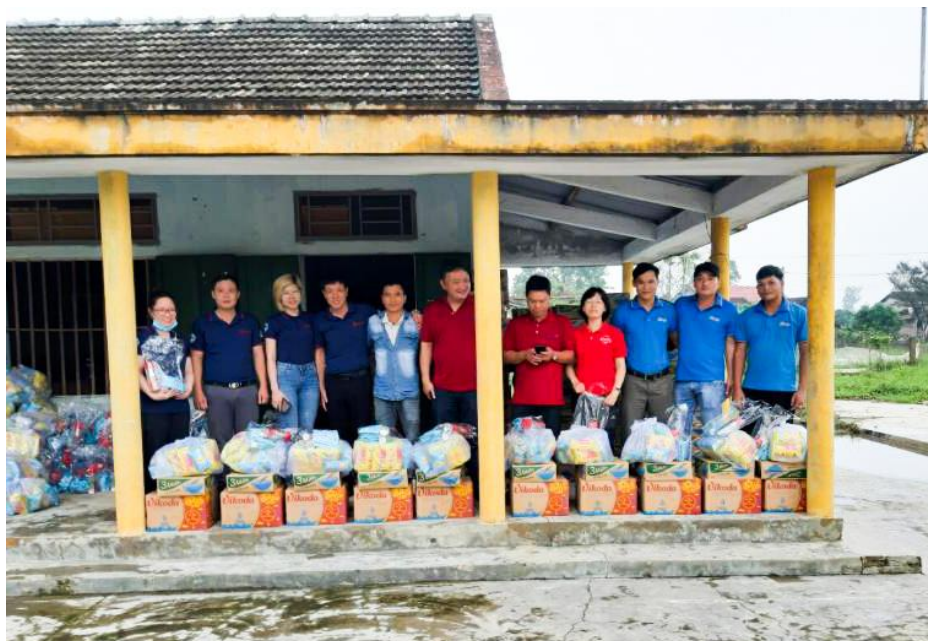
FIT Group trao quà cho người dân tại Xã Cam Thủy, huyện Cam Lộ, Quảng Trị

Mỗi suất quà đoàn cứu trợ trao tặng là những vật phẩm thiết yếu chứa đựng tấm lòng và tình cảm của CBCNV FIT Group dành cho đồng bào miền Trung. Các suất quà bao gồm thùng mì gói, bánh mì tươi, gel rửa tay khô diệt khuẩn, nước giặt và xịt muối, thuốc vitamin C tăng đề kháng, thuốc Berberin, thuốc Panalgan trị đau nhức và Panalgan trị cảm cúm.