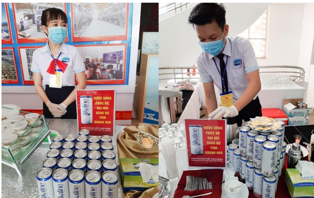
Khu vực phục vụ nước uống tại Đại hội

Suốt 30 năm hình thành và phát triển, thương hiệu Vikoda của CTCP Nước khoáng Khánh Hòa luôn nhận được sự tin tưởng ngày một lớn của người dân Khánh Hòa và người tiêu dùng cả nước. Bên cạnh các loại nước giải khát đang có mặt trên thị trường, Vikoda luôn tìm cách vươn lên xuất sắc bằng uy tín của một sản phẩm thuần khiết từ thiên nhiên, mang tâm huyết của những người sáng lập. Thương hiệu này của CTCP Nước khoáng Khánh Hòa đã trải rộng trên thị trường từ Hà Nội tới miền tây Nam Bộ, mũi Cà Mau.