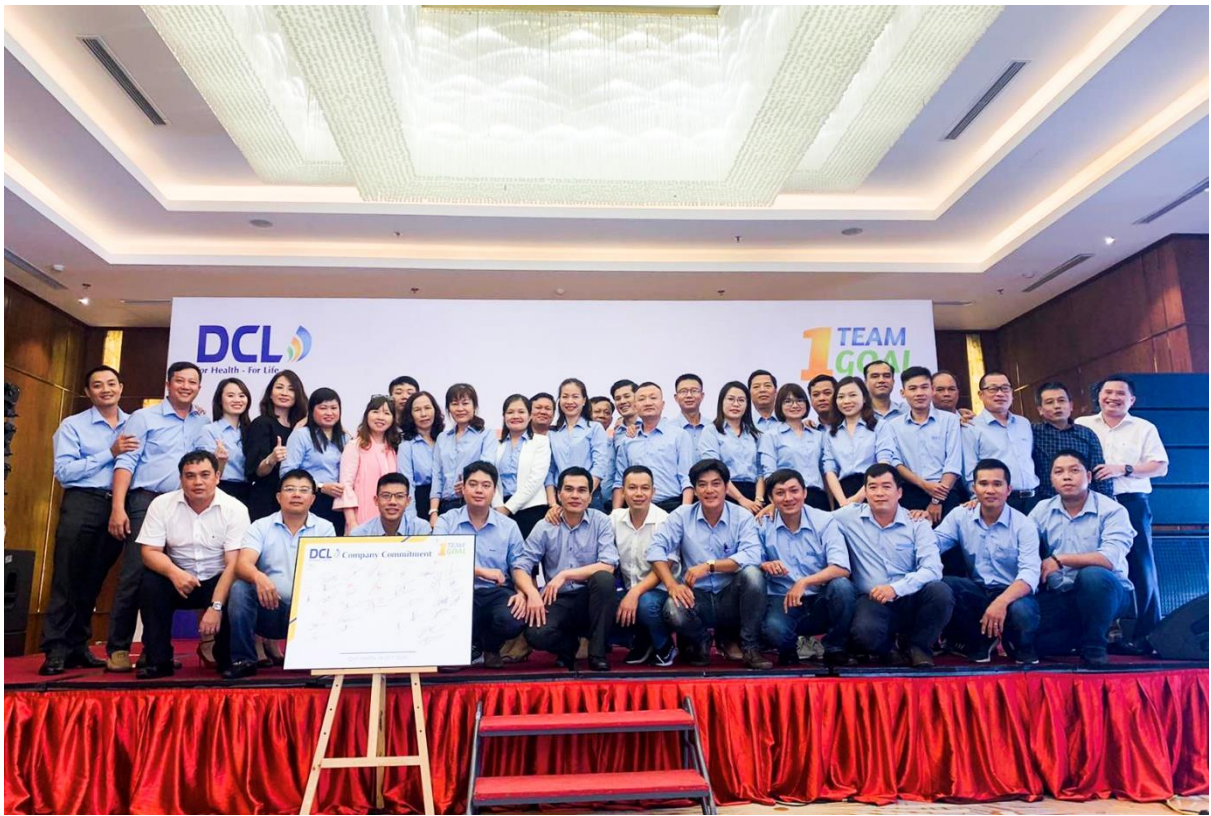
Ban lãnh đạo và đội ngũ Sale Team trong cuộc họp “Town Hall Meeting”

Bên cạnh đó, trong thời gian tới, DCL cũng sẽ tiến hành đồng bộ hàng loạt Chương trình Marketing nhằm tạo nên một diện mạo mới cho định vị thương hiệu DCL và sản phẩm của mình