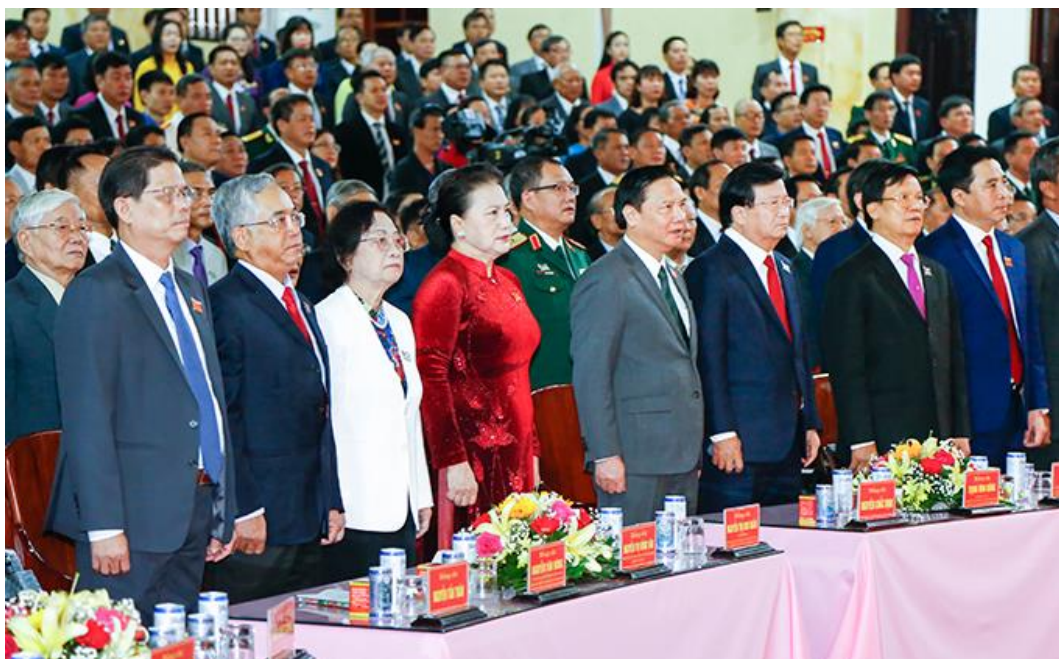
Chủ tịch Quốc hội Nguyễn Thị Kim Ngân dự Đại hội Đảng bộ tỉnh Khánh Hòa

Vikoda Alkaline là sản phẩm chứa đựng dòng nước khoáng kiềm thiên nhiên từ nguồn khoáng Đảnh Thạnh trứ danh với độ pH 8.8 tối ưu, có tác dụng nổi bật là trung hòa axit dư thừa trong cơ thể. Là một trong 12 mạch nước khoáng thiên nhiên trên toàn quốc được Bộ Y tế cho phép khai thác và sử dụng, có hàm lượng vi khoáng tốt kết hợp với dây chuyền công nghệ khép kín đạt tiêu chuẩn châu Âu, Vikoda Alkaline của của CTCP Nước khoáng Khánh Hòa khẳng định giữ nguyên vị ngon của nguồn khoáng, mang đến sự trọn vẹn tinh túy từ thiên nhiên, giúp bảo vệ và nâng cao sức khỏe. Bên cạnh chất lượng sản phẩm, Vikoda Alkaline còn được đánh giá cao bởi việc sử dụng bao bì lon nhôm có khả năng tái chế 100%, vô cùng thân thiện với môi trường, giúp giảm tải rác thải nhựa và thay đổi thói quen của người tiêu dùng. Chính vì vậy, Vikoda Alkaline đã được ưu tiên lựa chọn là sản phẩm phục vụ nước uống trong suốt thời gian diễn ra Đại hội.