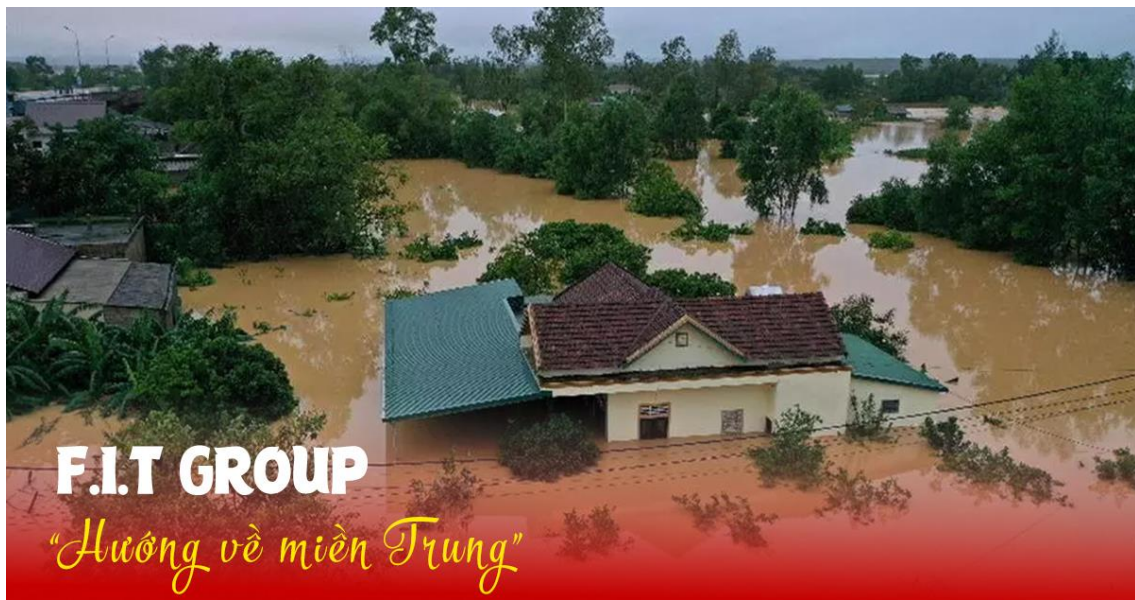
Hình ảnh cơn lũ lịch sử tháng 10/2020 tại miền Trung

Hơn lúc nào hết, người dân vùng bị thiên tai lũ lụt đang rất cần sự quan tâm giúp đỡ, chia sẻ từ các cấp, ngành, địa phương và toàn xã hội. Sự giúp đỡ thiết thực về vật chất và tinh thần sẽ góp phần cho bà con miền Trung vượt qua giai đoạn khó khăn do mưa bão.