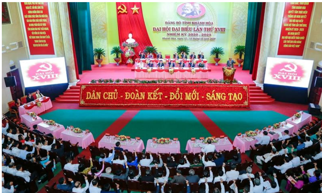
Toàn cảnh Đại hội Đảng bộ tỉnh Khánh Hòa lần thứ XVIII

Vikoda Alkaline là sản phẩm chứa đựng dòng nước khoáng kiềm thiên nhiên từ nguồn khoáng Đảnh Thạnh trứ danh với độ pH 8.8 tối ưu, có tác dụng nổi bật là trung hòa axit dư thừa trong cơ thể. Là một trong 12 mạch nước khoáng thiên nhiên trên toàn quốc được Bộ Y tế cho phép khai thác và sử dụng, có hàm lượng vi khoáng tốt kết hợp với dây chuyền công nghệ khép kín đạt tiêu chuẩn châu Âu, Vikoda Alkaline của của CTCP Nước khoáng Khánh Hòa khẳng định giữ nguyên vị ngon của nguồn khoáng, mang đến sự trọn vẹn tinh túy từ thiên nhiên, giúp bảo vệ và nâng cao sức khỏe. Bên cạnh chất lượng sản phẩm, Vikoda Alkaline còn được đánh giá cao bởi việc sử dụng bao bì lon nhôm có khả năng tái chế 100%, vô cùng thân thiện với môi trường, giúp giảm tải rác thải nhựa và thay đổi thói quen của người tiêu dùng. Chính vì vậy, Vikoda Alkaline đã được ưu tiên lựa chọn là sản phẩm phục vụ nước uống trong suốt thời gian diễn ra Đại hội.