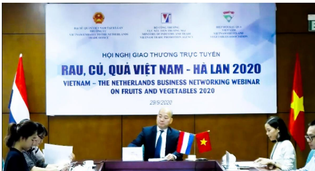
Ông Vũ Bá Phú, Cục trưởng Cục Xúc tiến thương mại phát biểu tại hội nghị

(EVFTA) chính thức có hiệu lực từ ngày 1/8/2020, mở ra những cơ hội và triển vọng to lớn cho các doanh nghiệp tại Việt Nam nói chung và Westfood nói riêng.