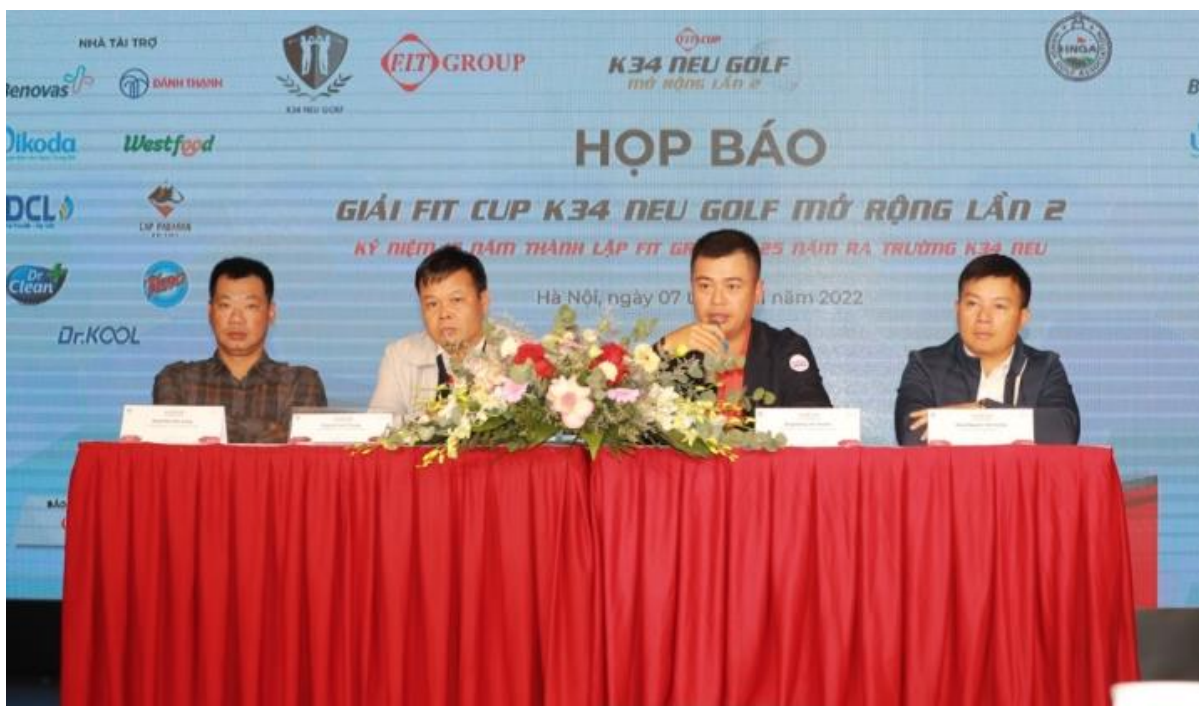
Họp báo tổ chức giải FIT Cup.

Các Golfer thi đấu 18 lỗ theo thể thức tính gậy (stroke play) theo Handicap đối với tất cả các bảng A, B, C, D, bảng Lady và cắt (-3). Kết quả tính theo tổng điểm Net của 18 hố.