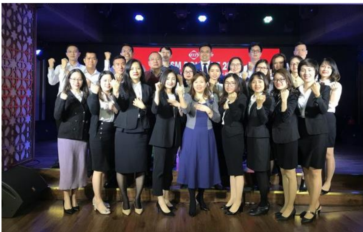
Tập thể FIT hô vang câu cam kết, quyết tâm gặt hái những thành công trong năm 2020

Với nỗ lực không ngừng nghỉ của một tập thể gắn kết, năm 2020 hứa hẹn sẽ là một năm mà toàn FIT gặt hái được nhiều thành quả như kế hoạch đặt ra, tiếp tục đưa FIT không chỉ là một Tập đoàn vững mạnh trong hoạt động kinh doanh mà còn là một doanh nghiệp luôn thể hiện trách nhiệm cao vì sự phát triển bền vững của đất nước, và là một công ty với môi trường làm việc đáng sống.