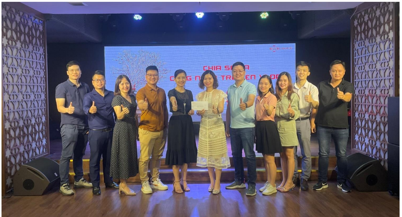
Ban Kiểm toán; Nguồn vốn & Đầu tư Tài chính và Văn phòng Hội đồng quản trị đã đạt giải Nhất khi chia sẻ chương "Bánh đà và vòng luẩn quẩn"

Đặc biệt, những kinh nghiệm, bài học về kỹ thuật được rút ra từ cuốn sách đã được CBNV F.I.T Group đúc kết lại để áp dụng thực tiễn nhằm nâng cao năng suất công việc, tiết kiệm thời gian và công sức.