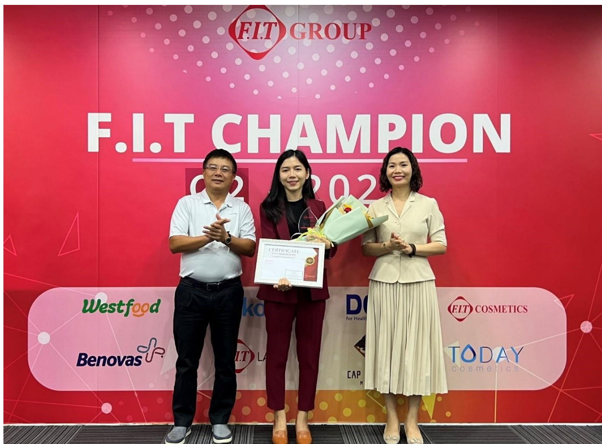
Nhân viên Westfood được trao giải F.I.T Champion tại TP. HCM