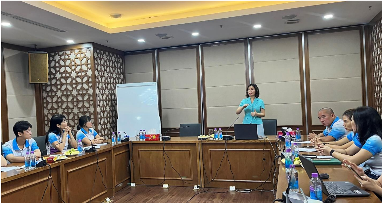
Ban Lãnh đạo F.I.T Group và đội ngũ kinh doanh Vikoda tại Hà Nội