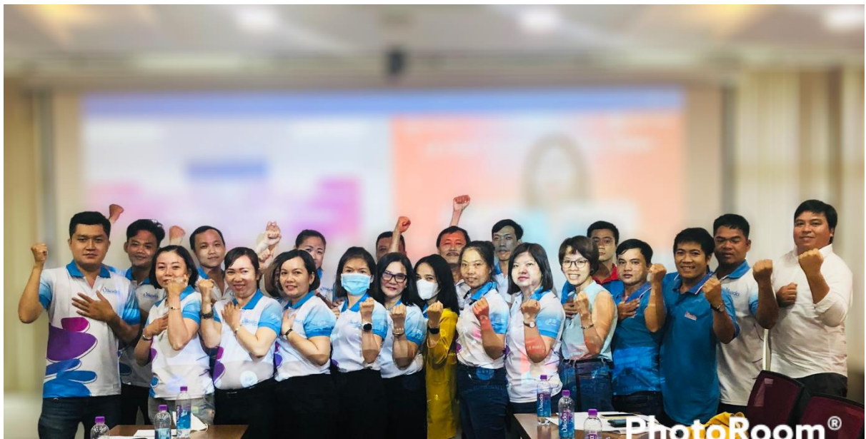
Đội ngũ cán bộ nhân viên kinh doanh tại TP. Hồ Chí Minh quyết tâm chinh phục F.I.T Champion