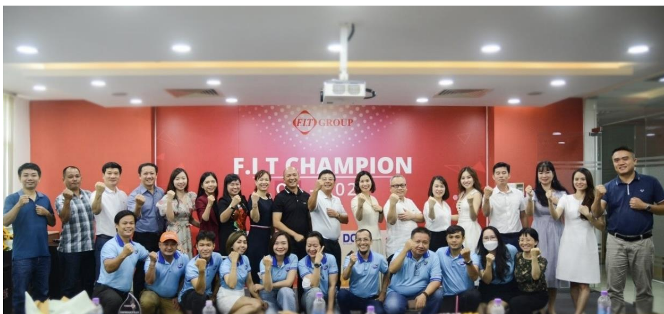
Cán bộ nhân viên đạt giải F.I.T Champion tại TP. Hồ Chí Minh chụp ảnh lưu niệm cam kết với BLĐ