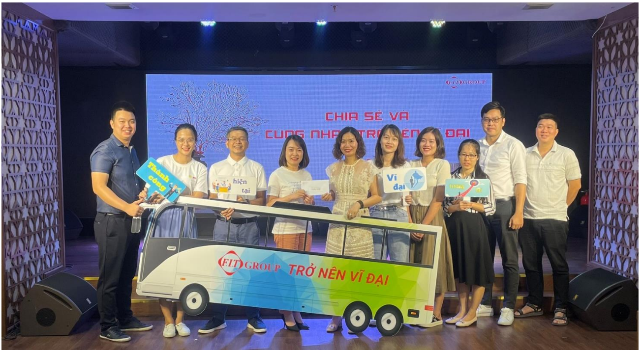
Ban Hành chính Nhân sự đạt giải Nhì chia sẻ nội dung toàn bộ cuốn sách