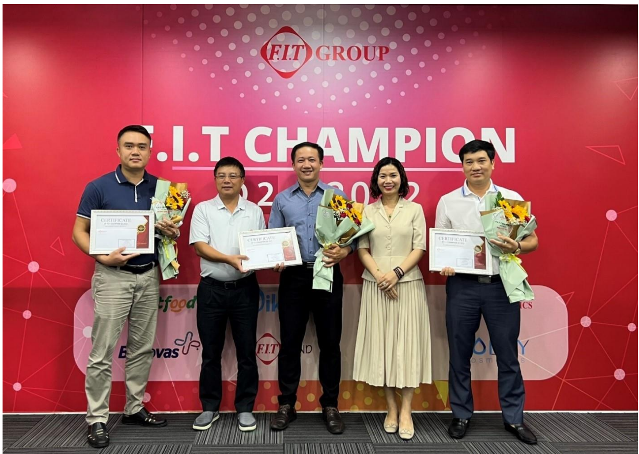
Các thành viên của team Capsule – DCL được trao giải F.I.T Champion tại TP. HCM