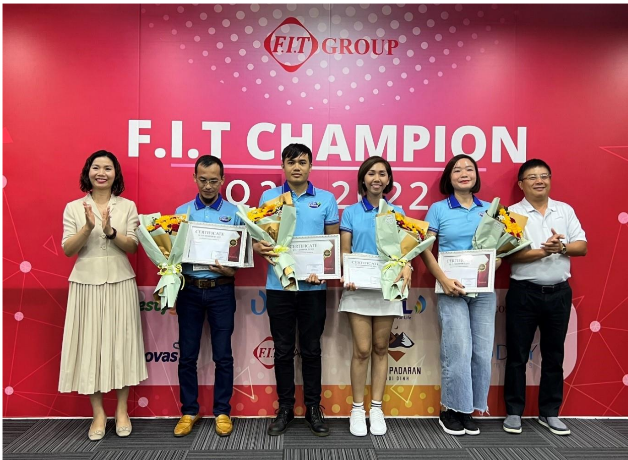
Các cán bộ nhân viên của FIT Cosmetics được trao giải F.I.T Champion tại TP. HCM