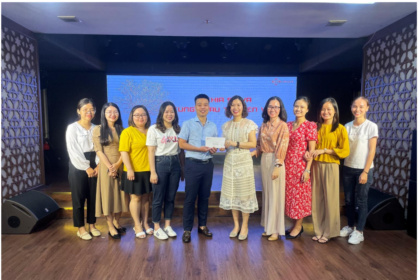
Ban Kế toán giành giải Ba khi chia sẻ và vận dụng chương “Khái niệm con nhím”

Trong quá trình xây dựng và phát triển văn hóa doanh nghiệp, Ban Lãnh đạo Tập đoàn F.I.T luôn chú trọng đến việc hình thành thói quen đọc sách cho đội ngũ CBNV và coi đây là một nét văn hóa không thể thiếu ở tất cả các đơn vị. Tại Tập đoàn F.I.T, song song với văn hóa đọc sách chính là văn hóa chia sẻ để cùng hành động, từ đó góp phần vào sự phát triển bền vững của doanh nghiệp.