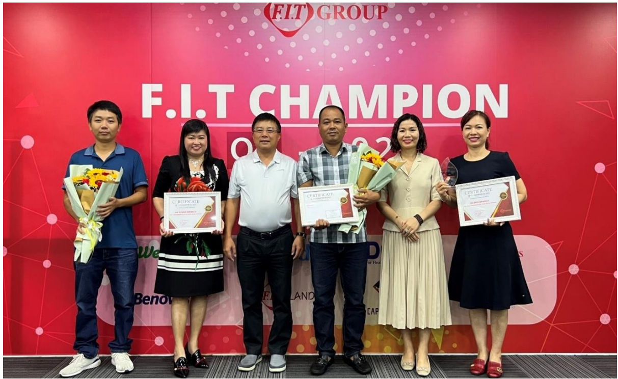
3 chi nhánh được trao giải F.I.T Champion của DCL tại TP. HCM gồm: Nghệ An, An Giang, Hà Nội