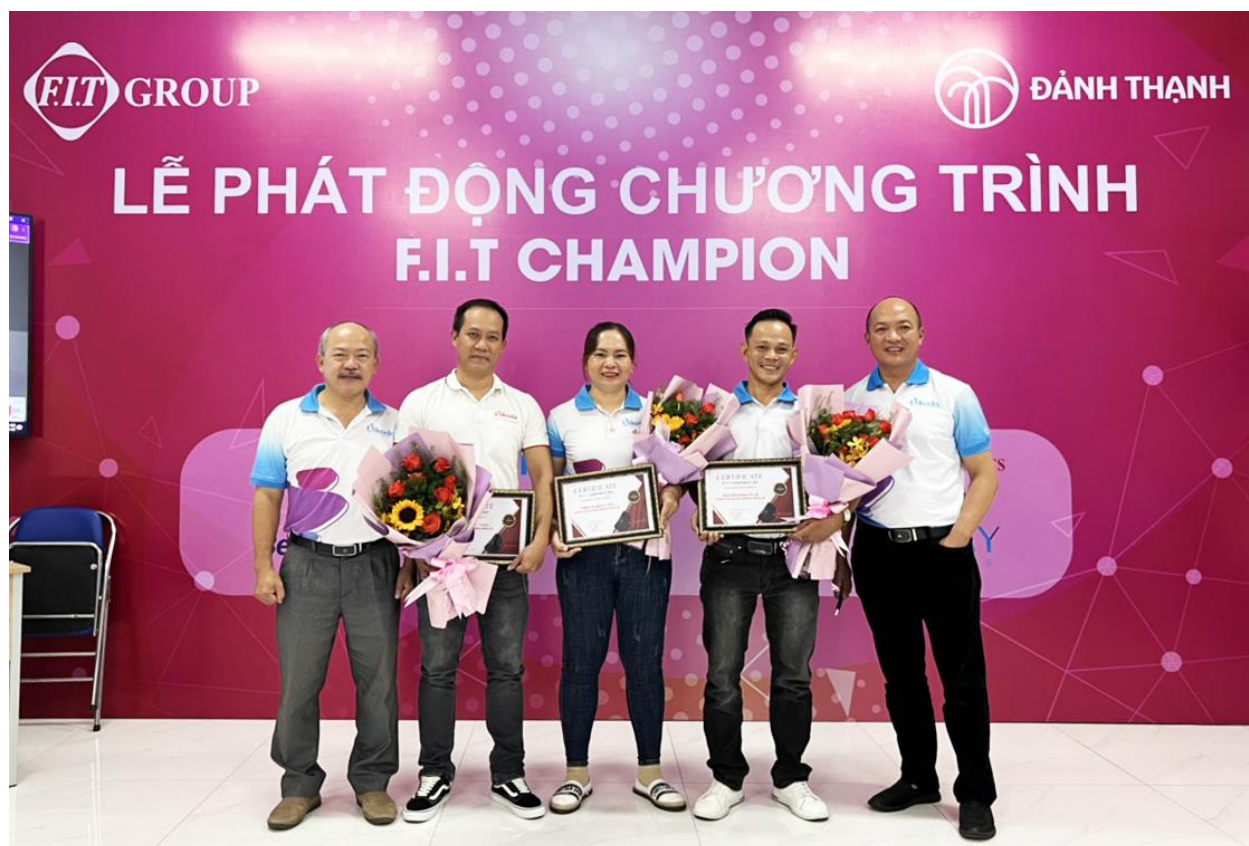
Ba Nhà vô địch F.I.T Champion Quý II/2022 của Vikoda