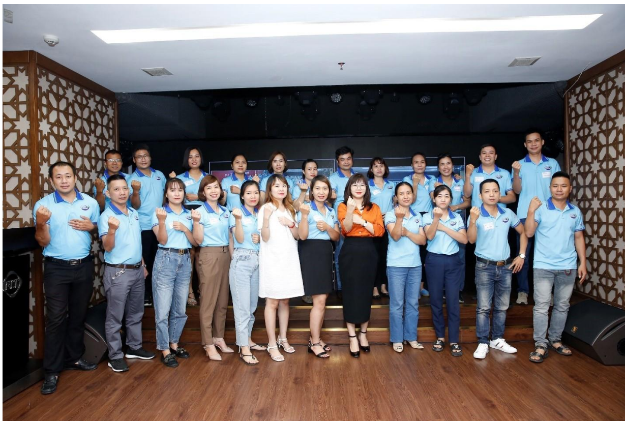
Cán bộ, nhân viên đạt giải F.I.T Champion tại Hà Nội chụp ảnh lưu niệm cam kết với BLĐ tại Hà Nội