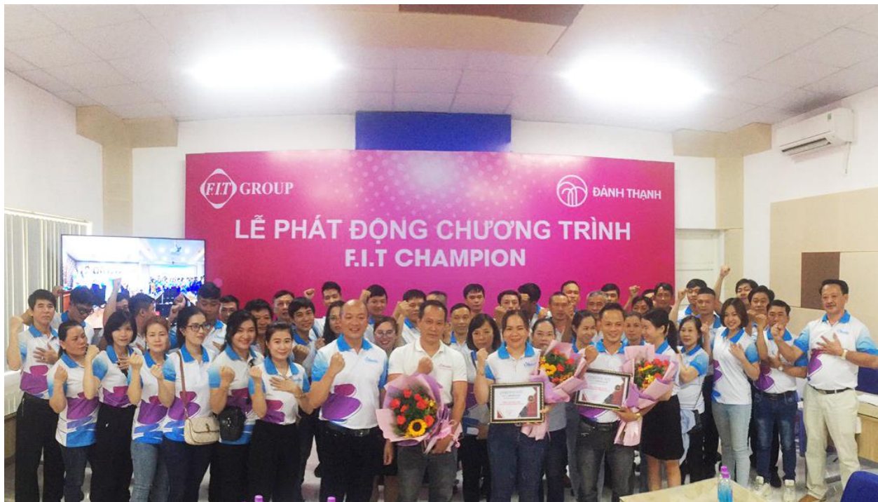
Đội ngũ cán bộ nhân viên kinh doanh Vikoda tại Khánh Hòa quyết tâm chinh phục F.I.T Champion