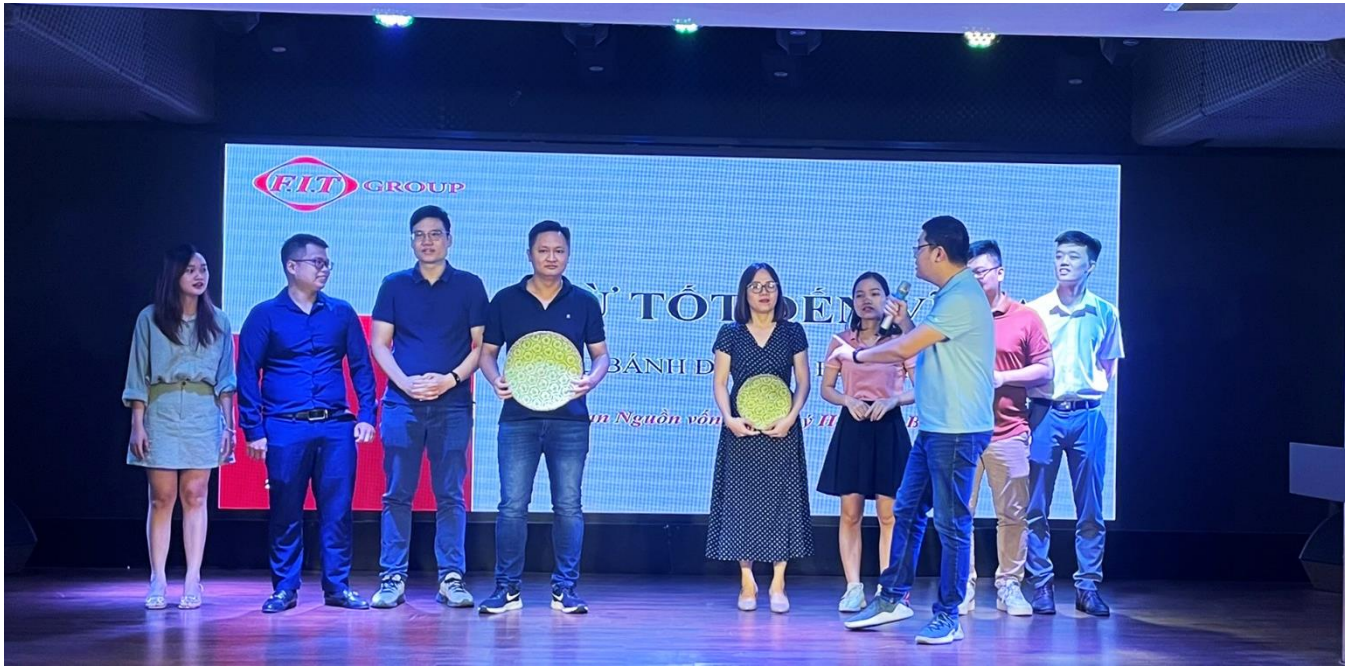
Các ban thể hiện sự sáng tạo trong bài thuyết trình

Đặc biệt, những kinh nghiệm, bài học về kỹ thuật được rút ra từ cuốn sách đã được CBNV F.I.T Group đúc kết lại để áp dụng thực tiễn nhằm nâng cao năng suất công việc, tiết kiệm thời gian và công sức.