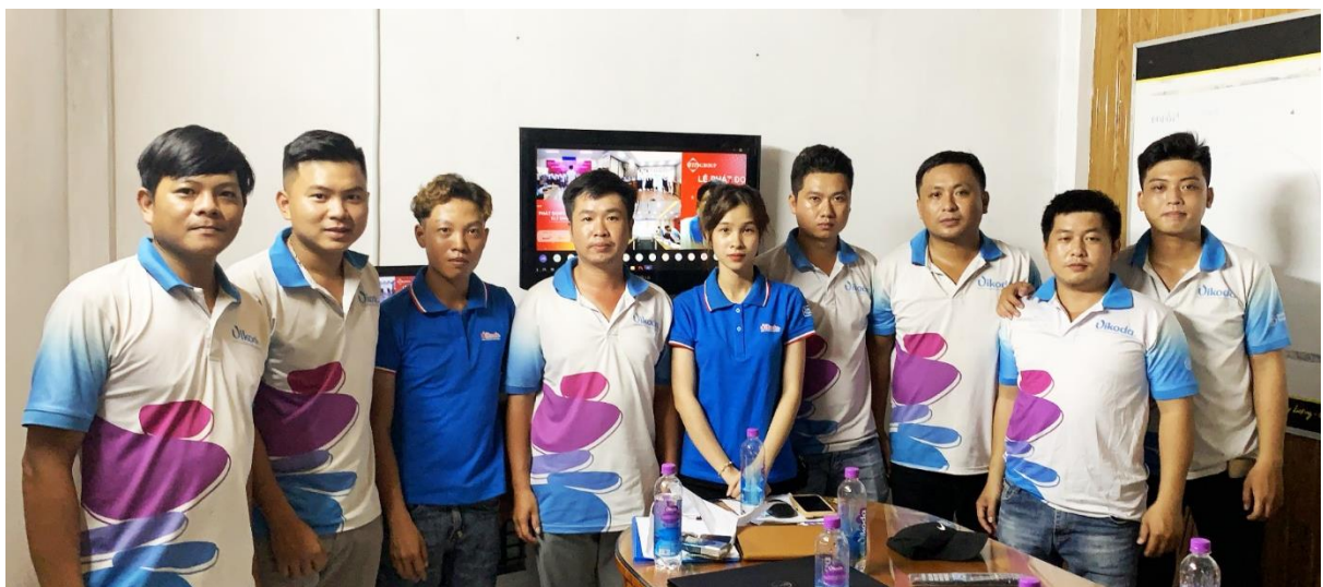
Đội ngũ cán bộ nhân viên kinh doanh tại Huế, Quảng Trị quyết tâm chinh phục F.I.T Champion