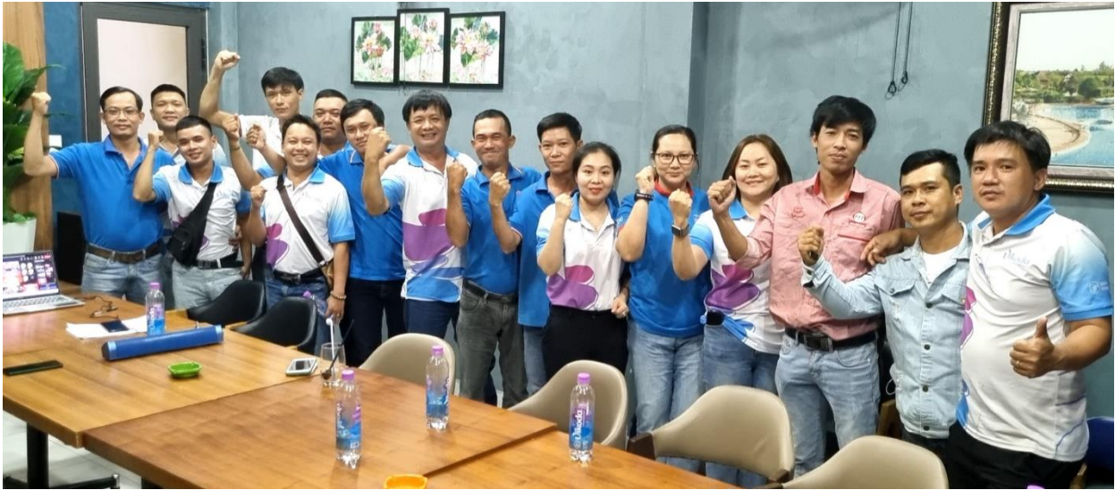
Đội ngũ cán bộ nhân viên kinh doanh Vikoda tại Đà Nẵng quyết tâm chinh phục F.I.T Champion