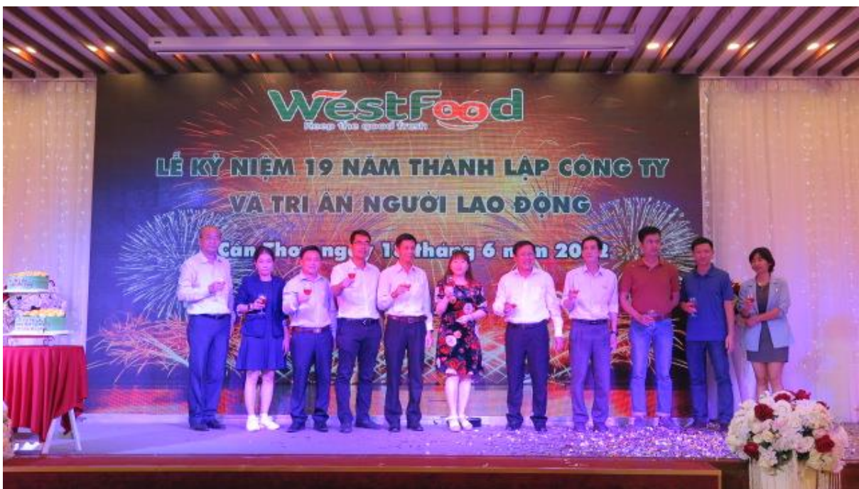
Ban lãnh đạo Công ty Westfood nâng ly chúc mừng 19 năm thành lập Westfood

Bên cạnh đó, việc liên tiếp 2 lần đạt danh hiệu “ Top 10 Thương hiệu mạnh ASEAN” năm 2020 và năm 2022 là thành tích đáng tự hào đối với Westfood; là minh chứng cho qui mô, vị thế của doanh nghiệp trong lĩnh vực chế biến xuất khẩu nông sản trên thị trường quốc tế.