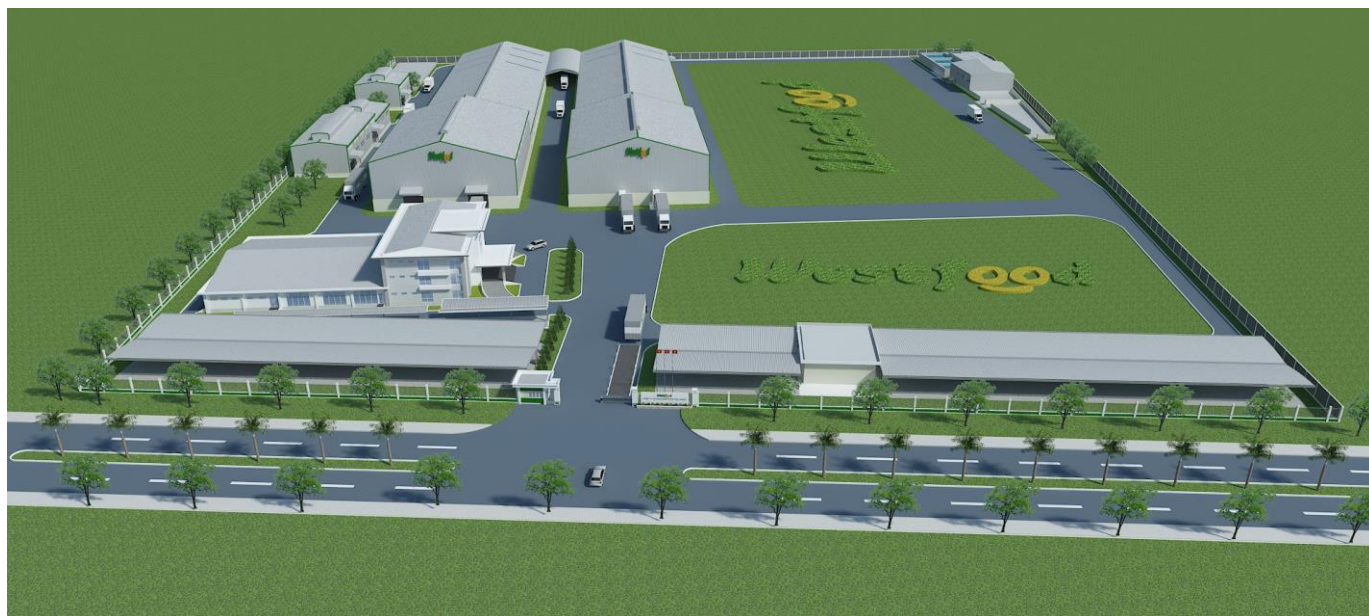
Thiết kế dự án nhà máy Westfood Hậu Giang

Dự án được xây dựng trên tổng diện tích đất 70,000m 2 với mức tổng chi phí đầu tư ban đầu ước tính khoảng 500 tỷ đồng tại Khu Công nghiệp Sông Hậu, Xã Đông Phú, Huyện Châu Thành, Tỉnh Hậu Giang. Vị trí này được xem như là trung tâm vùng nguyên liệu của khu vực ĐBSCL.