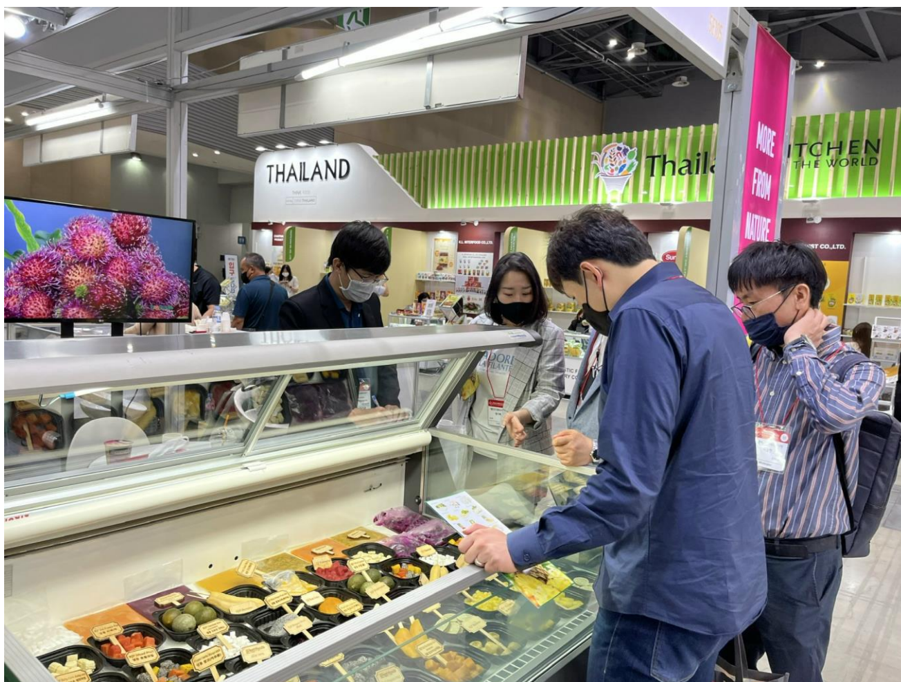
Gian hàng của Westfood tại Triển lãm Seoul Food 2022