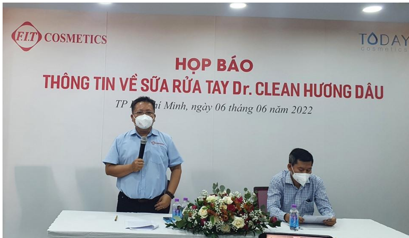
Họp báo thông tin về sản phẩm sữa rửa tay Dr.Clean hương dâu số lô 088U1.

thương hiệu toàn cầu tại thị trường Việt Nam. Trong đợt bùng phát dịch Covid-19 lần thứ 4 vừa qua, các sản phẩm mang Dr.Clean đã được Doanh nghiệp mang tặng đến các bệnh viện, các cơ sở cách ly, điều trị... ở những vùng “tâm dịch” như Hà Nội, TP.HCM, Bắc Ninh, Bắc Giang, Hưng Yên, Hà Tĩnh,... đóng góp một phần nhỏ hỗ trợ đội ngũ y bác sỹ, cùng các bệnh nhân F0 lẫn F1 tự bảo vệ được bản thân, từ đó kìm chế và đẩy lùi được dịch bệnh.