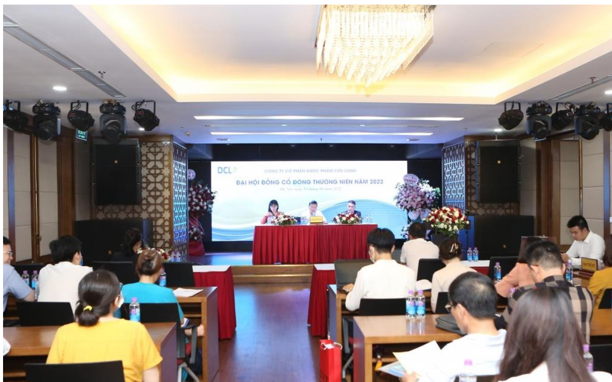
Đại hội đồng cổ đông năm 2022 Dược Cửu Long

Năm 2021, dịch Covid-19 tái bùng phát trên cả nước làm ảnh hưởng nghiêm trọng đến tình hình sản xuất kinh doanh nói chung và DCL nói riêng. Tại ĐHCĐ năm 2022, Ban lãnh đạo DCL cho biết, nhiều thời điểm do quy định giãn cách xã hội và thực hiện 3 tại chỗ, nên Công ty chỉ bố trí sản xuất dưới 30% công suất và tập trung sản xuất các sản phẩm chủ lực, nhưng doanh thu thuần vẫn giữ vững đạt 704 tỷ đồng tăng 4,83%. Đáng chú ý, lợi nhuận trước thuế tăng trưởng tốt đạt trên 110 tỷ đồng, tăng 28.32% so với cùng kỳ.