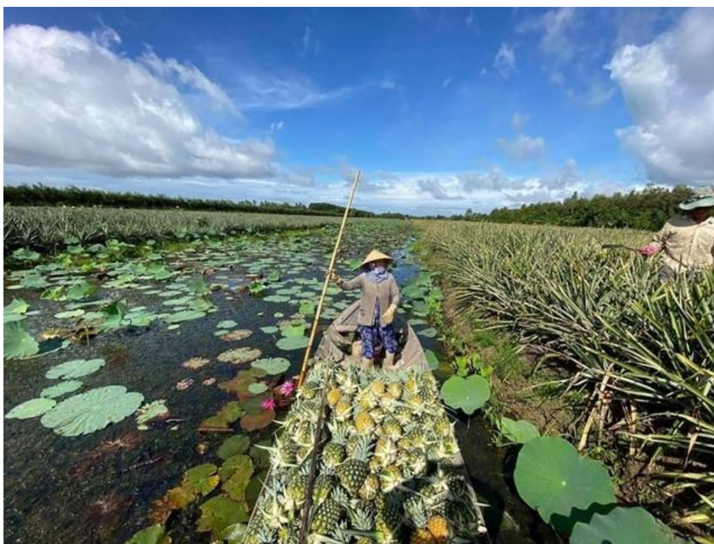
Westfood hợp tác với người dân mở rộng vùng nguyên liệu dứa MD2

Năm 2022, khi tình hình dịch COVID-19 ổn định, Westfood quyết tâm tập trung tăng tốc phát triển sản xuất. Đến nay, trên 95% cán bộ, công nhân viên đã hoàn thành mũi tiêm thứ 3, và 100% cán bộ, nhân viên đều đã tiêm xong mũi thứ 2, đáp ứng đủ nhân lực tham gia sản xuất cho các đơn hàng và các đối tác lớn. Bên cạnh đó, Westfood đang tập trung mở rộng vùng nguyên liệu dứa MD2 tại các tỉnh ĐBSCL và Tây Nguyên để đáp ứng nhu cầu ngày càng lớn của thị trường với mục tiêu lên đến 1000ha, nâng tổng sản lượng thu hoạch lên tới 30,000 tấn/ năm nhằm tạo thêm sự ổn định nguyên liệu cho nhà máy và cung cấp cho các thị trường hiện có của Westfood.