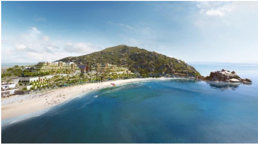
Phối cảnh 3D của dự án Cap Padaran Mũi Dinh – Khu du lịch nghỉ dưỡng đẳng cấp quốc tế

Với dãy núi đá bao quanh các đồi cát, các tiểu sa mạc xen kẽ là những hồ nước tự nhiên, kéo dài sát bờ biển xanh và cát trắng tạo nên khung cảnh thiên nhiên đẹp mê lòng người. Dự án được chia làm nhiều phân khu bao gồm các chức năng khách sạn, resort, biệt thự biển, các khu tổ hợp căn hộ khách sạn, tổ hợp vui chơi giải trí và thể dục thể thao.