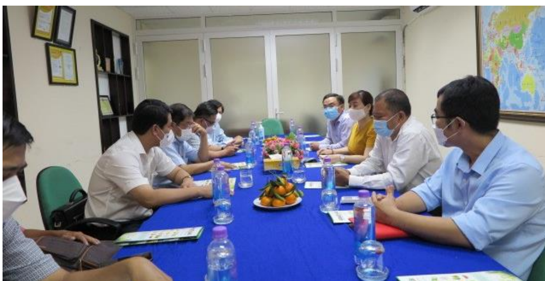
Westfood tại buổi làm việc với Ban lãnh đạo thành phố

Năm 2021 mặc dù chịu ảnh hưởng nặng nề từ dịch bệnh Covid-19 nhưng CTCP Chế biến Thực phẩm Xuất khẩu Miền Tây (Westfood) vẫn đạt doanh thu gần 280 tỷ đồng; lợi nhuận trước thuế đạt gần 23 tỷ đồng. Có được kết quả này, ngoài sự nỗ lực của Westfood còn có sự đồng viên, hỗ trợ rất hiệu quả của các cơ quan, ban, ngành Thành phố Cần Thơ. Bước sang năm 2022, Westfood vẫn tiếp tục nhận được sự đồng viên, quan tâm quý báu này.