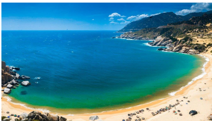
Bãi Tràng với đường bờ biển tuyệt đẹp tại Mũi Dinh

Thời gian qua, Ninh Thuận đã chứng minh nơi đây không phải trạm dừng trung chuyển. Ninh Thuận đã là điểm liên kết vùng không thể thiếu của tam giác, tứ giác du lịch Nam Trung Bộ – Tây Nguyên. Mũi Dinh- một điểm đến của du lịch Ninh Thuận với vẻ đẹp bình dị, hoang sơ của biển xanh, cát trắng, nắng vàng. Mũi Dinh đang trở thành “mỏ kim cương” thu hút hàng loạt nhà đầu tư lớn đến khai phá tạo nên những sản phẩm có sức lôi cuốn bất tận đối với du khách.