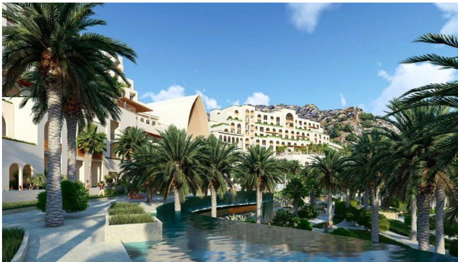
Phối cảnh 3D của dự án Cap Padaran Mũi Dinh – Khu du lịch nghỉ dưỡng đẳng cấp quốc tế

Với dãy núi đá bao quanh các đồi cát, các tiểu sa mạc xen kẽ là những hồ nước tự nhiên, kéo dài sát bờ biển xanh và cát trắng tạo nên khung cảnh thiên nhiên đẹp mê lòng người. Dự án được chia làm nhiều phân khu bao gồm các chức năng khách sạn, resort, biệt thự biển, các khu tổ hợp căn hộ khách sạn, tổ hợp vui chơi giải trí và thể dục thể thao.