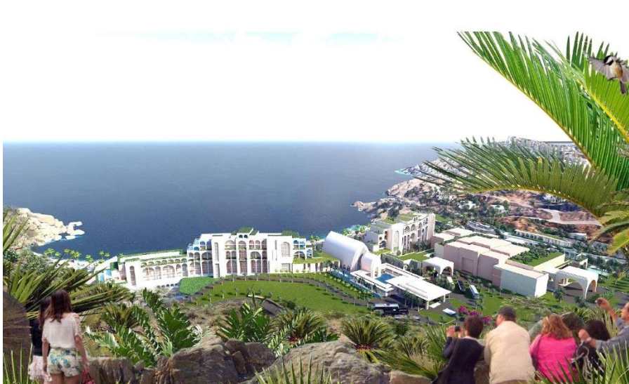
Phối cảnh 3D của dự án Cap Padaran Mũi Dinh – Khu du lịch nghỉ dưỡng đẳng cấp quốc tế

Theo đại diện Tập đoàn F.I.T Group, cho rằng: Với đặc trưng đa dạng địa hình cũng như sở hữu bãi biển dài gần 8km, chúng tôi sẽ mang đến cho quý khách các sản phẩm du lịch nghỉ dưỡng, kết hợp các loại hình du lịch trải nghiệm như leo núi, trượt cát, trải nghiệm đua xe địa hình trên sa mạc, ngắm bình minh và hoàng hôn trên lưng lạc đà, vui chơi giải trí công viên nước, công viên chuyên đề, thưởng thức chương trình văn hoá nghệ thuật ban đêm, trải nghiệm mua sắm hàng hiệu, chơi golf trên cát... Những hệ sinh thái nghỉ dưỡng đẳng cấp cùng các sản phẩm mới lạ mà thị trường này chưa từng có chính là cách để Ninh Thuận đi tắt đón đầu dòng khách hiện đại với xu hướng trải nghiệm đa dạng và tối đa hóa tiện ích”.