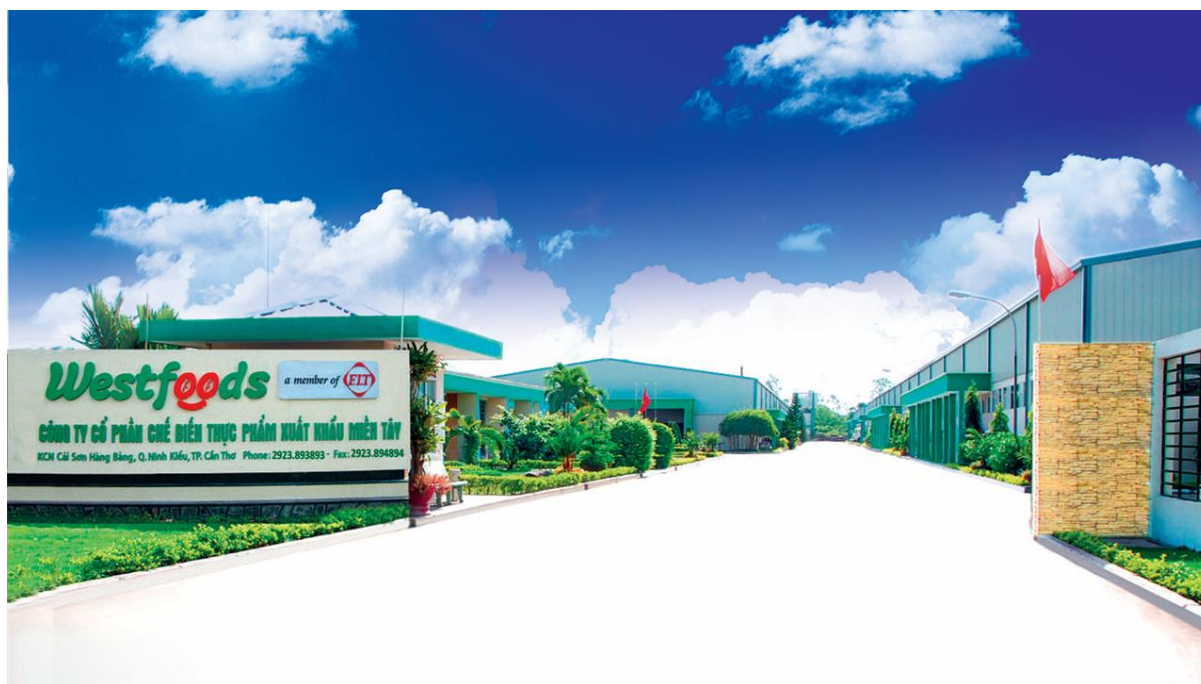
Nhà máy Westfood tại Cần Thơ