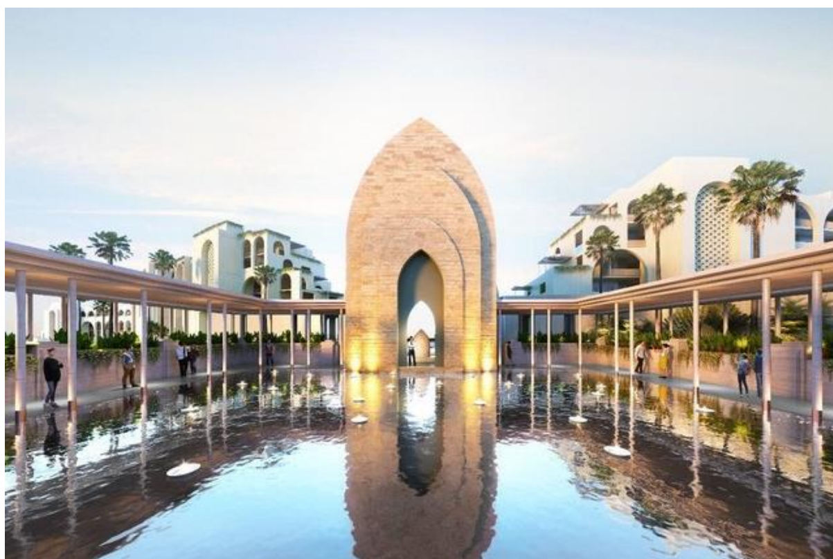
Phối cảnh 3D của dự án Cap Padaran Mũi Dinh với thiết kế mang đậm phong cách Chăm – Pa độc đáo

Theo cam kết của chủ đầu tư tại lễ khởi công, Cap Padaran sẽ có tốc độ triển khai thần tốc. Trong giai đoạn 1, dự án sẽ triển khai xây dựng Khu nghỉ dưỡng Bãi Tràng có diện tích gần 64 ha bao gồm khách sạn tiêu chuẩn năm sao quốc tế, biệt thự nghỉ dưỡng cùng hạ tầng và các tiện ích đồng bộ, với tổng mức đầu tư khoảng 150 triệu USD, dự kiến sẽ đưa vào khai thác trong năm 2024 và hoàn thành toàn bộ dự án trong tháng 6/2025.