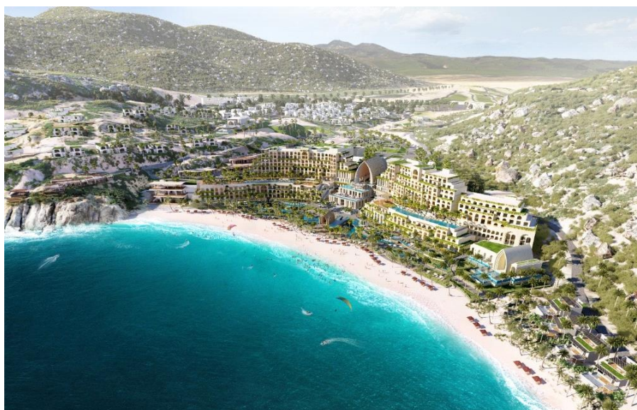
Phối cảnh 3D của dự án Cap Padaran Mũi Dinh – Khu du lịch nghỉ dưỡng đẳng cấp quốc tế

Với Đề án vừa được công bố, Mũi Dinh được quy hoạch sẽ là khu vực du lịch nghỉ dưỡng và khám phá độc đáo cát – muối – biển gắn với các sản phẩm độc đáo, khẳng định thương hiệu du lịch Ninh Thuận mới trong khu vực và cả nước. Sức hấp dẫn của Mũi Dinh không chỉ dừng lại ở phong cảnh hữu tình cùng vẻ đẹp bí ẩn trải dài theo tuyến đường ven biển Bình Tiên-Cà Ná với những Làng Chài Sơn Hải, Sa Mạc Cát Sơn Hải, Hải Đăng Mũi Dinh, Biển Bãi Tràng, Biển Bãi Vũng, Biển Đá Trứng, núi Mũi Dinh; mà trên suốt tuyến đường ven biển này đoạn qua khu vực Mũi Dinh còn bởi những rặng núi đá nhấp nhô, những bãi biển đẹp đến nao lòng, những đồi cát vàng đầy nắng gió là nét duyên dáng có một không hai trên cả nước.