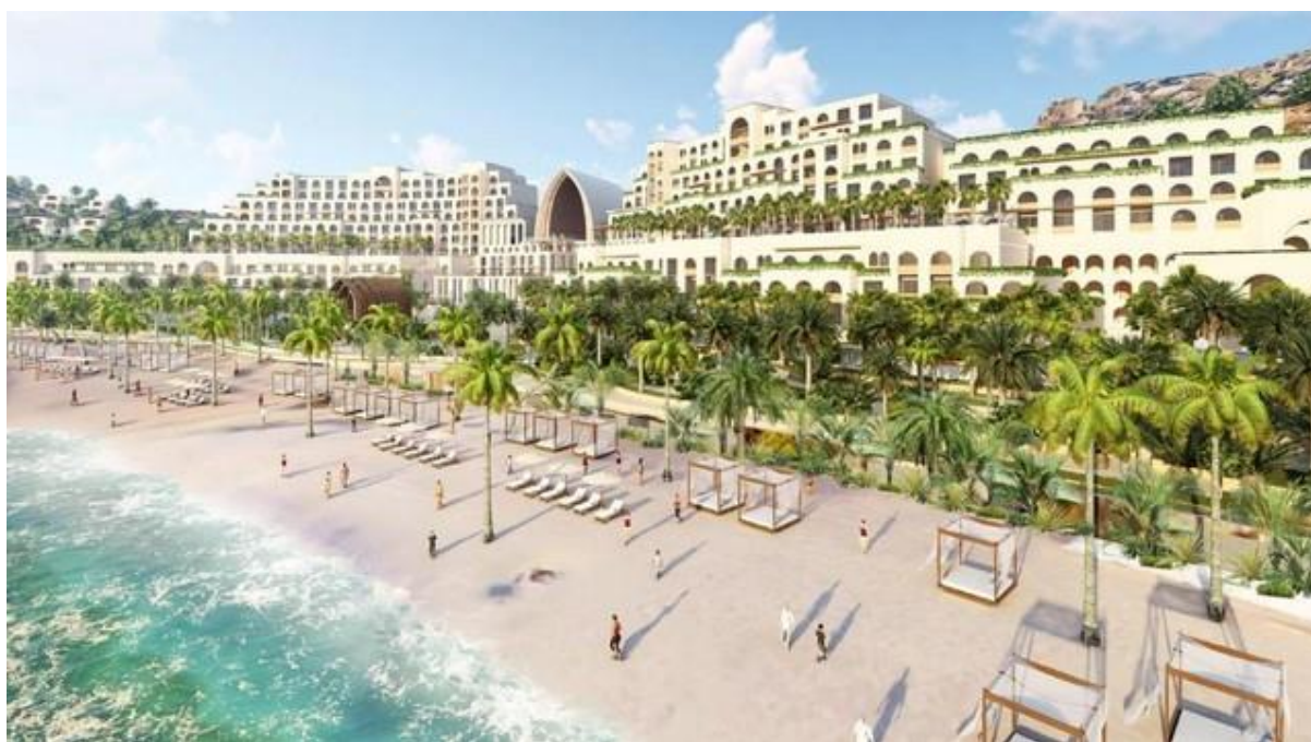
Phối cảnh 3D của dự án Cap Padaran Mũi Dinh – Khu du lịch nghỉ dưỡng đẳng cấp quốc tế

Điểm đặc biệt của dự án Cap Padaran là tọa lạc trên một địa hình độc đáo nhất Việt Nam, với dãy núi đá bao quanh các đồi cát, các tiểu sa mạc xen kẽ là những hồ nước tự nhiên, kéo dài sát bờ biển xanh và cát trắng nên có khung cảnh thiên nhiên thơ mộng, lãng mạn.