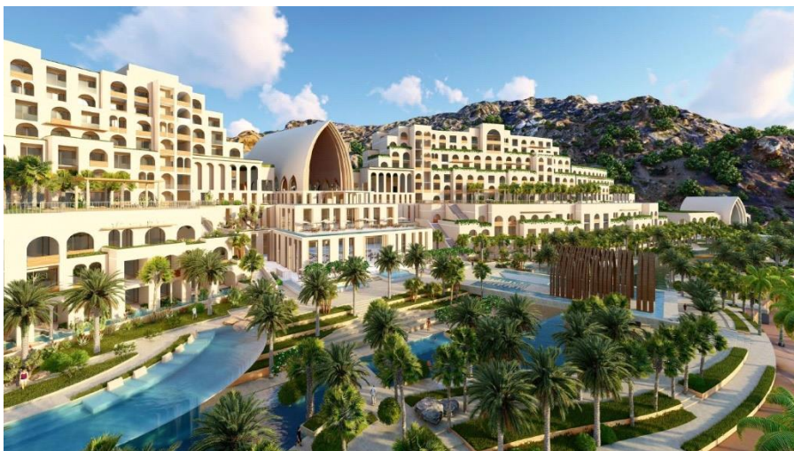
Phối cảnh 3D của dự án Cap Padaran Mũi Dinh – Khu du lịch nghỉ dưỡng đẳng cấp quốc tế

lành mạnh đến từ nguồn nước trời lạnh mà thiên nhiên đặc biệt ban tặng cho vùng biển này. Đây là một trong những tính năng đặc biệt, mang đến cho dự án những thể mạnh trong spa, trị liệu và chăm sóc sức khỏe.