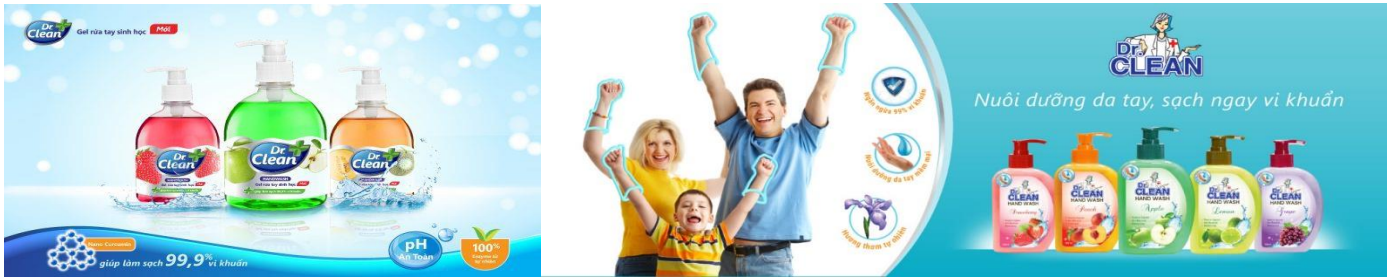
Hình (bên trái) là sản phẩm Gel rửa tay sinh học Dr.Clean và (hình bên phải) là Sữa rửa tay diệt khuẩn Dr.Clean của FIT Cosmetics

Là công ty con thuộc Tập đoàn FIT, các sản phẩm của FIT Cosmetics ngày càng trở nên đa dạng về sản phẩm, mẫu mã, được đông đảo người tiêu dùng tin tưởng và đặt nhiều kỳ vọng. Từ khi thành lập đến nay, Ban Lãnh đạo và toàn thể CBNV FIT Cosmetics đã và đang nỗ lực thực hiện sứ mệnh kết nối và nâng cao đời sống của người tiêu dùng Việt thông qua các sản phẩm và dịch vụ có giá trị ưu việt như công ty mẹ đã định hướng. Vì vậy, FIT Cosmetics luôn đặt cảm nhận của khách hàng lên hàng đầu và mong muốn bảo vệ quyền lợi của mỗi người tiêu dùng. Để ngăn chặn sự nhầm lẫn giữa nhãn hiệu khác với các nhãn hiệu của FIT Cosmetics, khi mua sắm tại các cửa hàng, siêu thị, khách hàng cần để ý kỹ thông tin bao bì, nhãn mác trên mỗi sản phẩm.