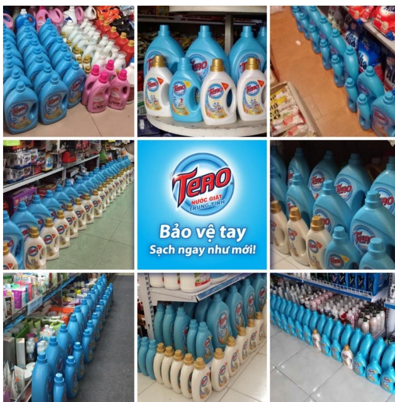
Hình ảnh trong quý 1/2018, Nước giặt Trung tính TERO đã phủ xanh tại nhiều cửa hàng trên khắp các tỉnh thành Việt Nam.

Nước giặt Trung tính TERO sử dụng cho cả giặt tay và giặt máy (máy giặt cửa trên và cửa ngang) với nồng độ pH = 7 thân thiện với da tay, không gây hao mòn máy giặt. Công nghệ làm sạch Ultra Clean đánh bay vết bẩn cứng đầu mạnh gấp 3 lần so với sản phẩm giặt tẩy thông thường. Ngoài ra, hương thơm tự nhiên sẵn có trong nước giặt giúp bạn không lo mùi hôi ẩm mốc trên quần áo vào ngày mưa gió.