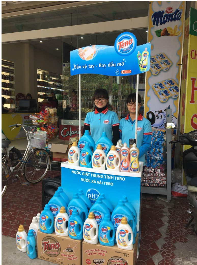
Hình ảnh hoạt động hoạt náo tại shop Long Xoan tỉnh Hải Dương

Bên cạnh đó, nhãn hàng TERO còn tổ chức các hoạt động hoạt náo tại điểm bán và các chợ nhằm giới thiệu đến người tiêu dùng các sản phẩm của TERO để có cơ hội trải nghiệm về sản phẩm.