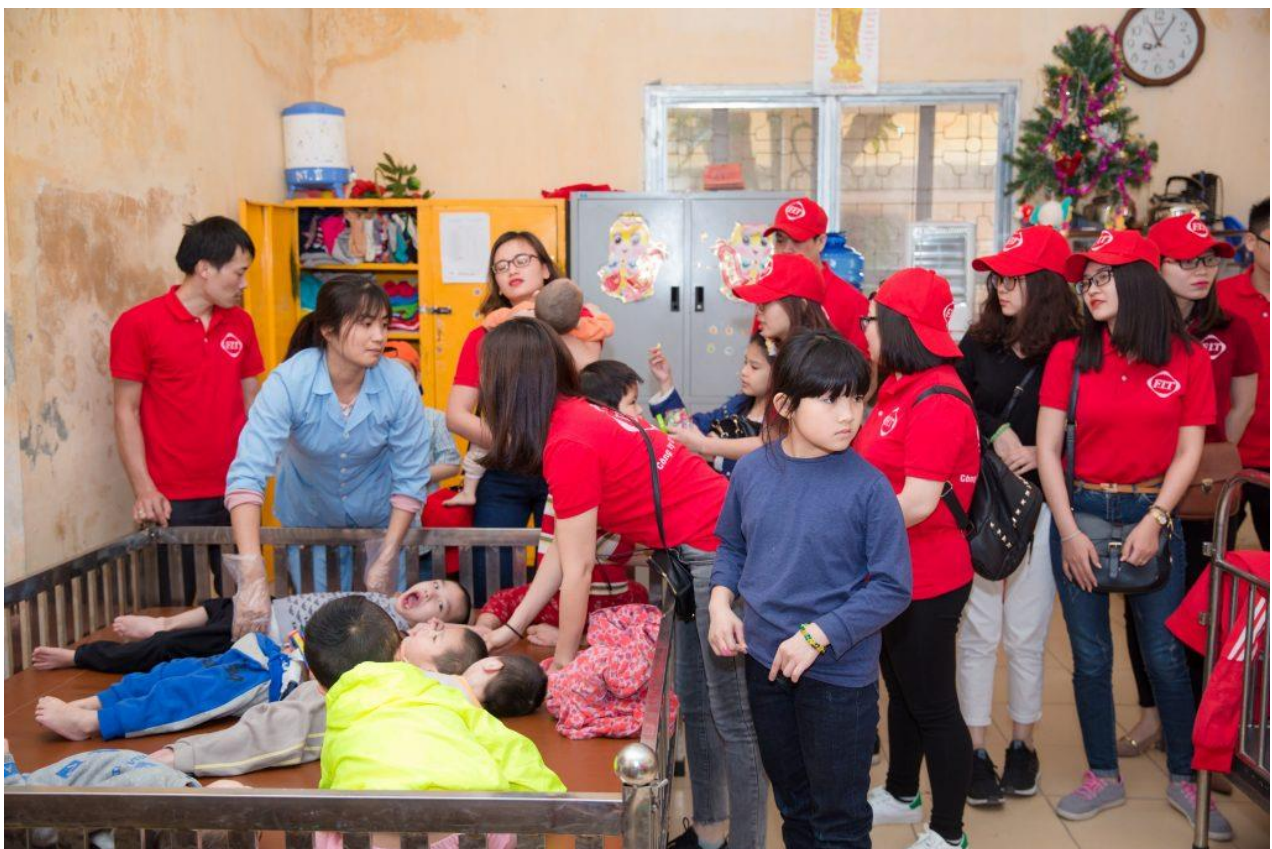
CBNV F.I.T đến thăm và hỏi han các em nhỏ tàn tật