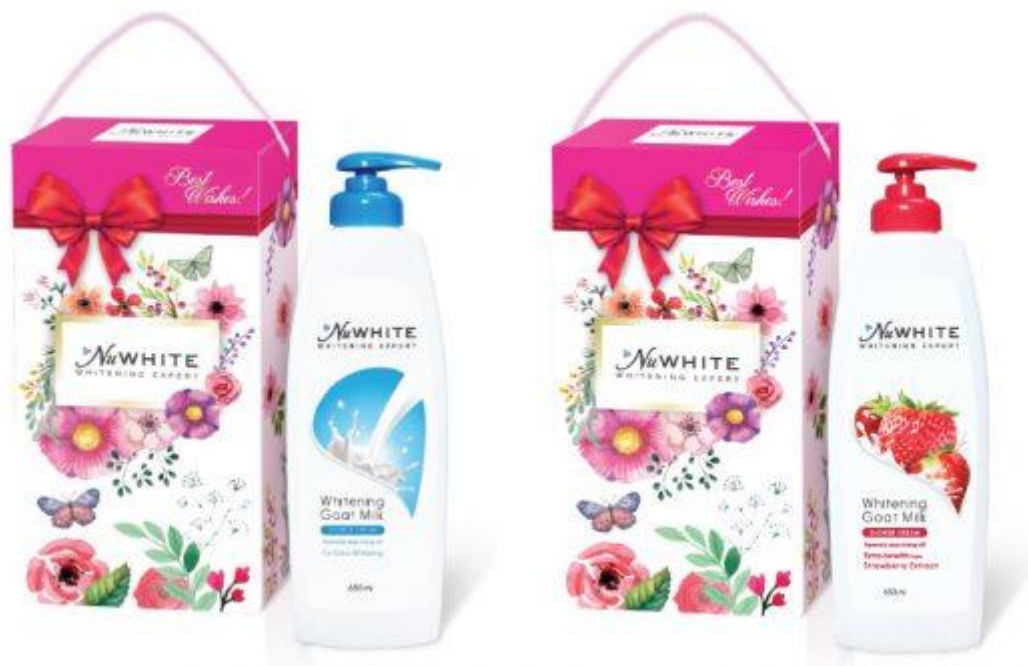
Hộp quà: Sữa tắm NuWHITE Goat Milk & Nuwhite Whitening Goat Milk.

cho người tiêu dùng Việt những sản phẩm chất lượng cao, góp phần nâng tầm thương hiệu Việt trên thị trường Quốc tế.