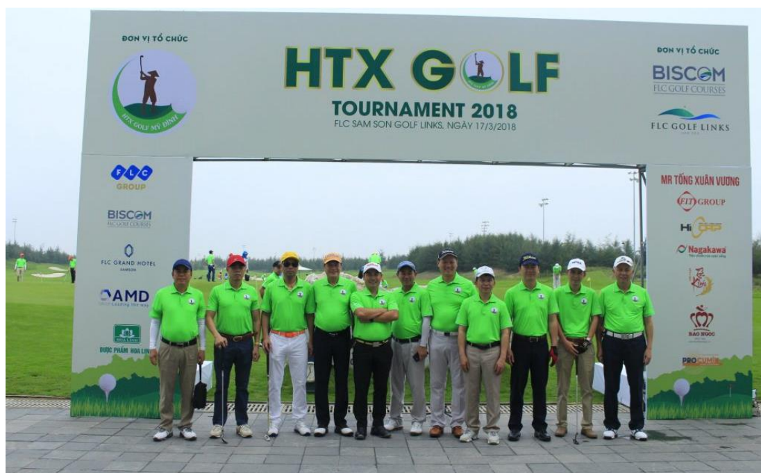
Hình ảnh tại Lễ khai mạc giải HTX Golf Tournament 2018