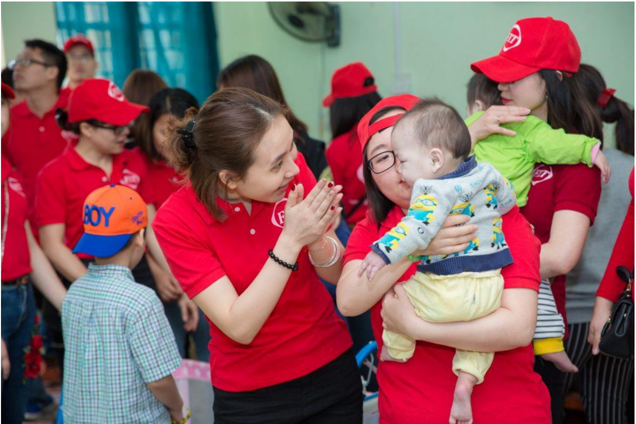
F.I.T đổ dành các em nhỏ tại khu trẻ sơ sinh