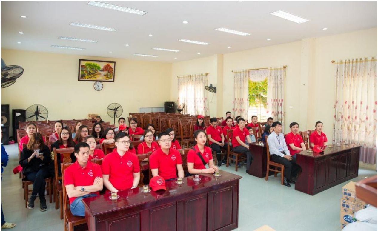
CBNV F.I.T có mặt tại hội trường trung tâm

Cùng nhìn lại hành trình “Trao gửi yêu thương” của CBNV F.I.T: