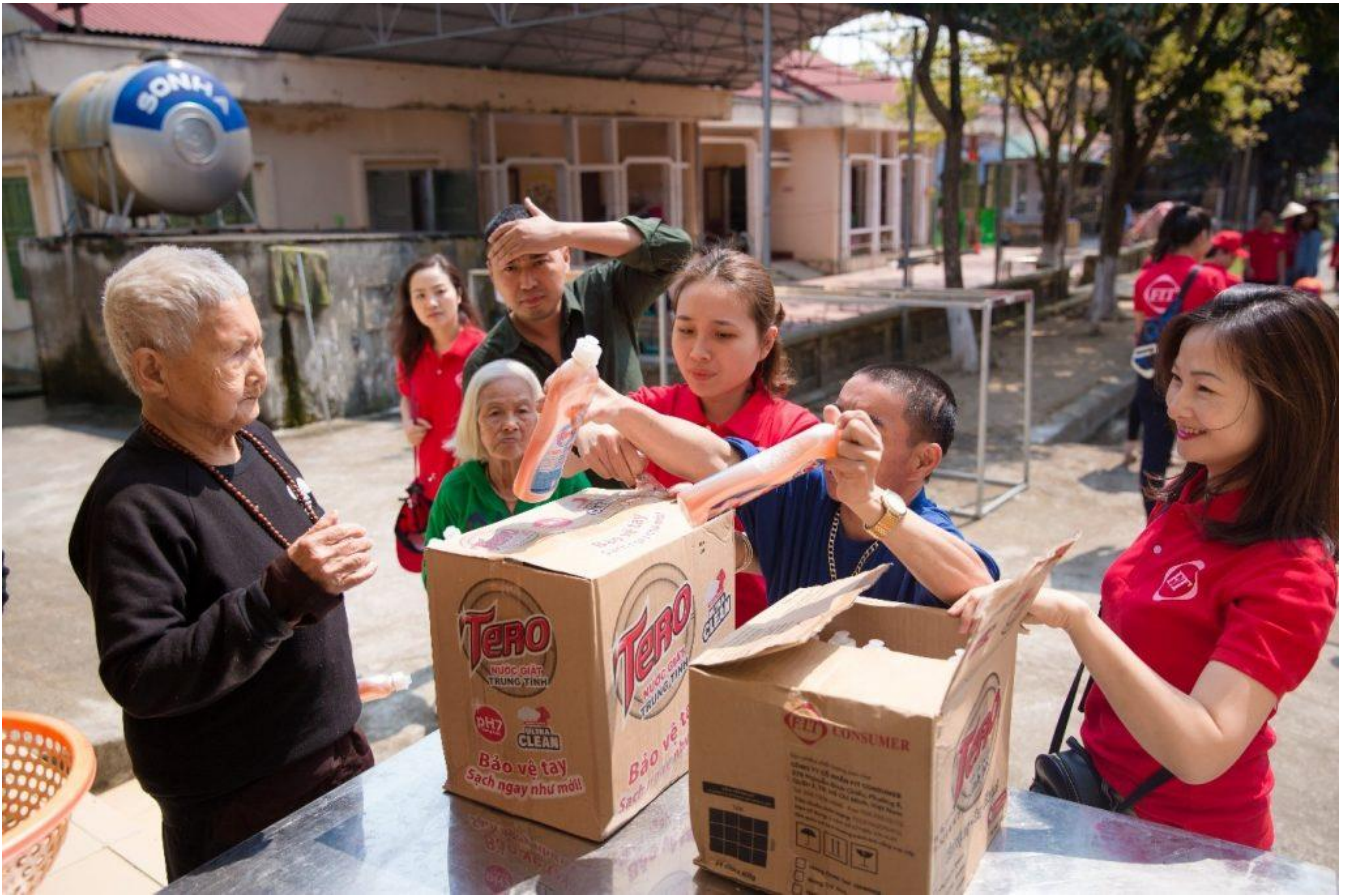
CBNV F.I.T trao quà đến tận tay từng người già, trẻ nhỏ trong trung tâm