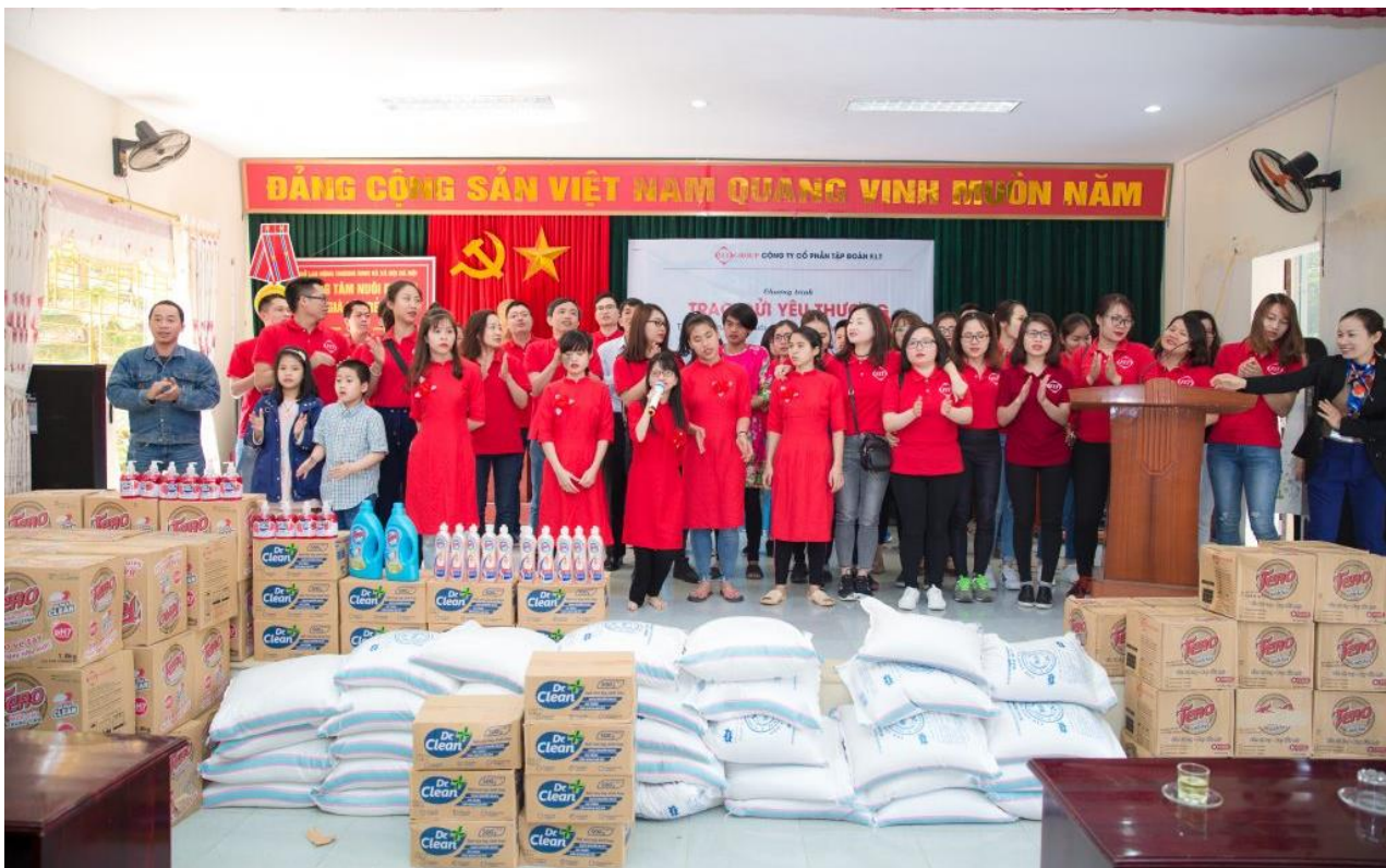
CBNV F.I.T cùng các em thiếu nhi tại trung tâm chung tay hát vang bài hát “Nối vòng tay lớn”