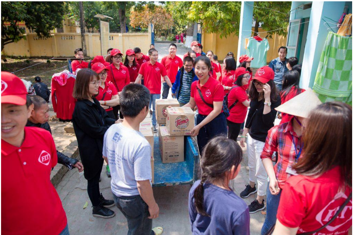
CBNV F.I.T chở quà trên những chiếc xe cải tiến để đến từng khu trao tặng