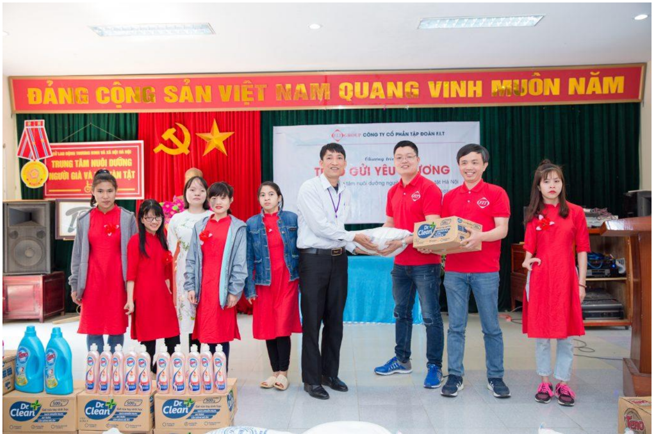
CBNV F.I.T trao quà tặng cho trung tâm