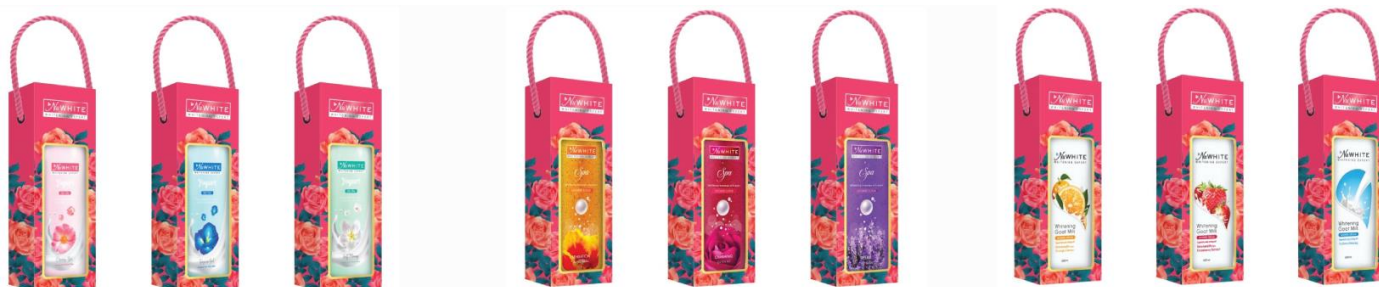
Hộp quà: Sữa tắm NuWhite Yogurt