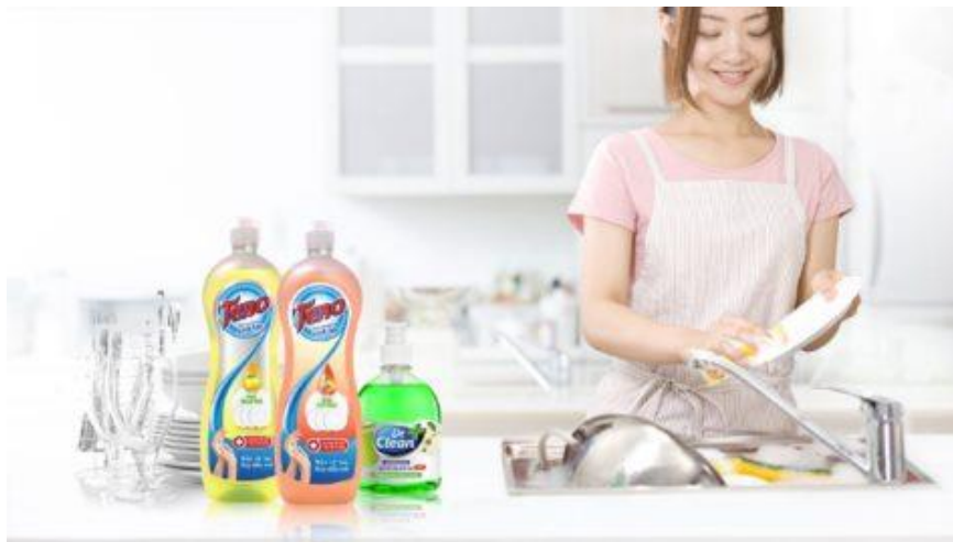
Nước rửa chén sinh học Tero 100% từ enzym tự nhiên của FIT Cosmetics “Bảo vệ tay – Bay đầu mỡ”

Nắm bắt được xu thế toàn cầu này, ngay từ khi trở thành một thành viên của FIT Group, FIT Cosmetics đã được định hướng chiến lược trong việc phát triển các loại sản phẩm thân thiện với môi trường, an toàn cho người sử dụng. Chính vì thế các dòng sản phẩm xanh, sạch, an toàn của công ty như: nước rửa chén sinh học Tero với 100% thành phần từ enzym tự nhiên, nước giặt trung tính Tero, đã và đang là lựa chọn yêu thích của người tiêu dùng.