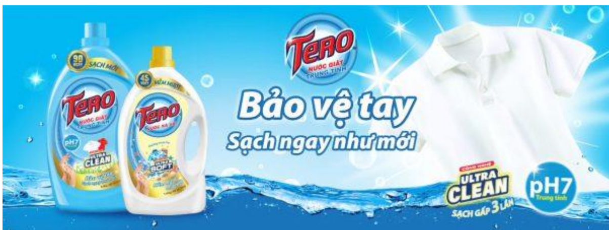
Bộ sản phẩm giặt xả Tero của FIT Cosmetics

Có thể thấy trong tương lai, các sản phẩm thân thiện với môi trường có thể sẽ trở thành nhu cầu thiết yếu trong cuộc sống của con người. Xu hướng này đang mở ra những thách thức cũng như cơ hội mới cho các công ty trong ngành sản xuất mỹ phẩm và các sản phẩm chăm sóc cơ thể.