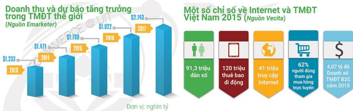
Biểu đồ tăng trưởng Thương mại điện tử trên thế giới và Việt Nam

Tại Việt Nam, theo kết quả khảo sát năm 2015 của Cục TMĐT và CNTT, giá trị mua hàng của một người mua hàng trực tuyến trong năm ước đạt 160 USD, doanh số TMĐT B2C đạt khoảng 4,07 tỷ USD.