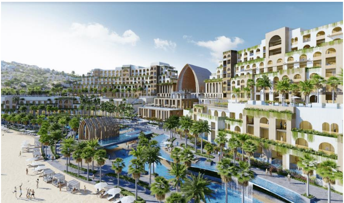
Các thiết kế trong dự án mang đậm phong cách Chăm-pa độc đáo.

Trên thực tế, hợp tác giữa Tập đoàn F.I.T và Tập đoàn Banyan Tree, đánh dấu một bước quan trọng để mở đầu chiến lược dài hạn của dự án, chính thức ghi dấu ấn lên bản đồ du lịch thế giới, trở thành điểm đến lý tưởng cho du khách trong nước và Quốc tế. Với kinh nghiệm quản lý và vận hành gần 100 khách sạn và khu nghỉ dưỡng cao cấp ở 30 quốc gia trên thế giới, Tập đoàn Singapore Banyan Tree sẽ định hướng chiến lược, tư vấn kỹ thuật và quản lý vận hành dự án theo mô hình quản lý tiên tiến, quy trình kiểm soát chất lượng quốc tế.