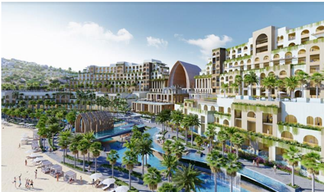
Các thiết kế trong dự án mang đậm phong cách Chăm-pa độc đáo

đoạn 1, dự án triển khai xây dựng Khu nghỉ dưỡng Bãi Tràng trên diện tích 64 ha bao gồm khách sạn tiêu chuẩn quốc tế, biệt thự nghỉ dưỡng cùng hạ tầng và các tiện ích đồng bộ. Các thiết kế trong dự án mang đậm phong cách Chăm-pa độc đáo.