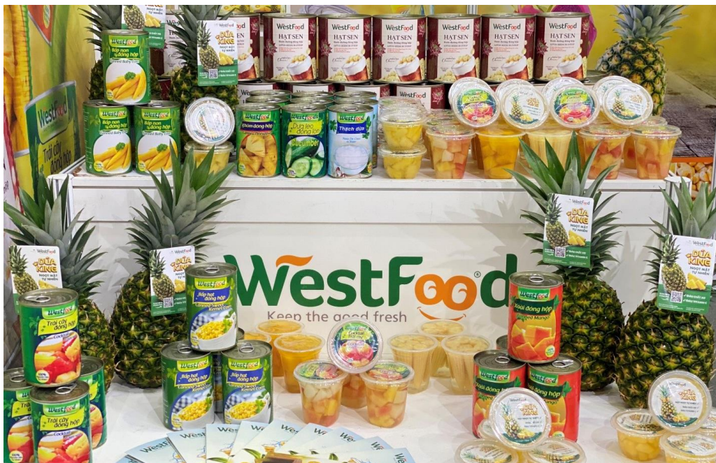
Các sản phẩm của Westfood tại Triển lãm Vietnam Foodexpo 2022

Đến với triển lãm Vietnam Foodexpo 2022, bên cạnh các sản phẩm trái cây đóng lon xuất khẩu, Westfood còn giới thiệu đến khách hàng nội địa và quốc tế sản phẩm dứa King MD2. Đây là giống dứa có chất lượng vượt trội với ưu điểm mỏng nước, có màu vàng tươi, thơm, ngon, ngọt mà Westfood đang hoàn toàn độc quyền và làm chủ công nghệ về giống, góp phần làm nên tên tuổi của Westfood trên thị trường thế giới.