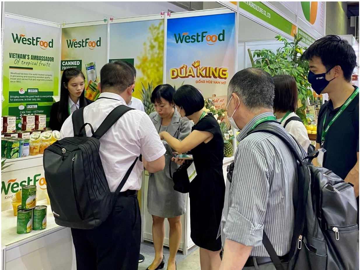
Khách hàng ấn tượng với sản phẩm của Westfood tại triển lãm Vietnam Foodexpo 2022

Đến với triển lãm Vietnam Foodexpo 2022, bên cạnh các sản phẩm trái cây đóng lon xuất khẩu, Westfood còn giới thiệu đến khách hàng nội địa và quốc tế sản phẩm dứa King MD2. Đây là giống dứa có chất lượng vượt trội với ưu điểm mỏng nước, có màu vàng tươi, thơm, ngon, ngọt mà Westfood đang hoàn toàn độc quyền và làm chủ công nghệ về giống, góp phần làm nên tên tuổi của Westfood trên thị trường thế giới.