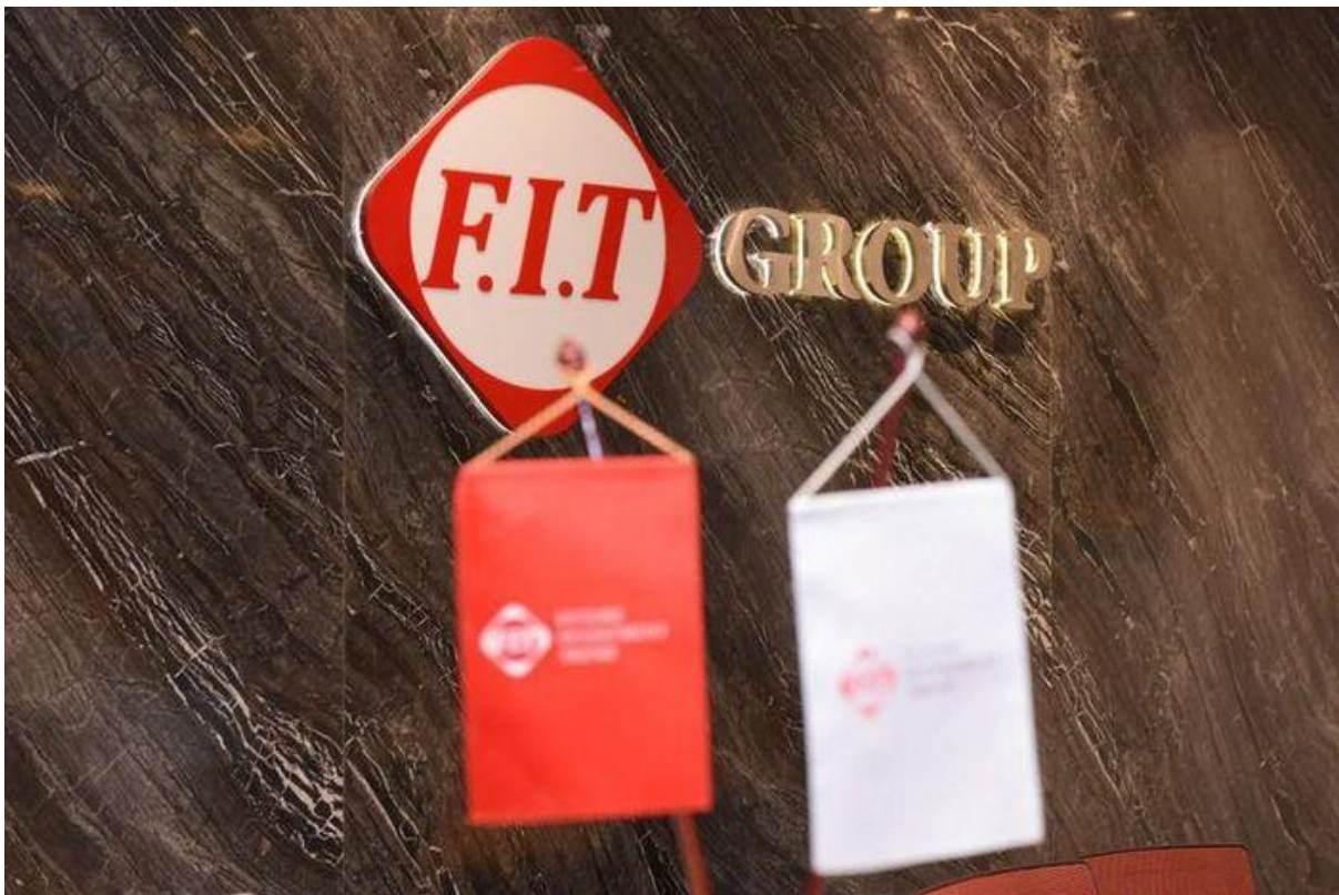
FIT có lãi tăng trưởng mạnh quý 3

Sau cùng, FIT báo lãi sau thuế quý 3 đạt hơn 30 tỷ đồng, tăng 50% so với cùng kỳ năm 2020.