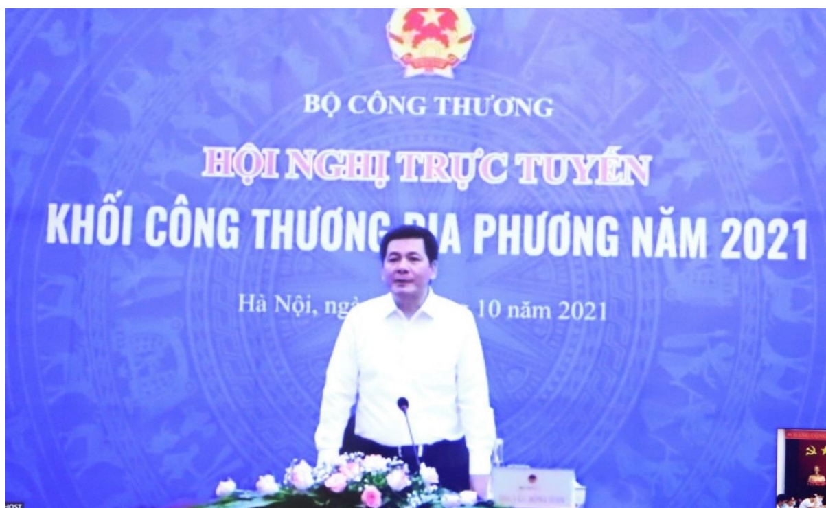
Đồng chí Nguyễn Hồng Diên – Bộ Trưởng Bộ Công Thương chủ trì Hội nghị.