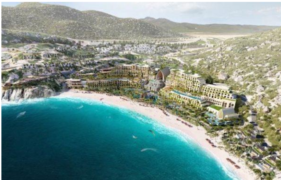
Tổng thể dự án Cap Padaran Mũi Dinh trên diện tích gần 800ha với khoảng 8km bờ biển

Dự án có nhiều phân khu được bố trí theo các chủ đề và chức năng khác nhau. Nổi bật với khu phức hợp Khách sạn nghỉ dưỡng 5 sao có diện tích 63 ha và diện tích xây dựng lên đến 88.667 m 2 , bao gồm 86 biệt thự đôi, 420 phòng khách sạn, cùng khu giải trí và thư giãn rộng lớn như: Làng thương mại, spa, trung tâm hội nghị và trò chơi, nhà hàng. Tòa khách sạn có chiều cao 37,2m với 12 tầng, 1 tầng hầm và 300 chỗ đậu xe. Các công trình trong dự án được thiết kế mô phỏng kiến trúc Champa được kết hợp khéo léo với cảnh quan thiên nhiên, để tạo nên một tuyệt phẩm kiến trúc mà không giống bất cứ nơi đâu.