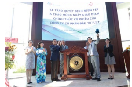
BLĐ F.I.T đánh công niêm yết cổ phiếu FIT trên sàn HSX

Đồng thời, sự kiện này được kỳ vọng sẽ khiến cổ phiếu FIT sớm vào danh mục quỹ đầu tư chỉ số (ETF).