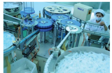
Nhà máy sản xuất ống kim tiêm của DCL

Số tiền thu được từ đợt phát hành là 137,5 tỷ đồng, phần lớn sẽ được đầu tư vào việc mua sắm 4 dây chuyền sản xuất capsule và mở rộng nhà máy capsule. Số còn lại được đầu tư vào việc mua sắm các thiết bị máy móc khác và bổ sung vốn lưu động công ty.