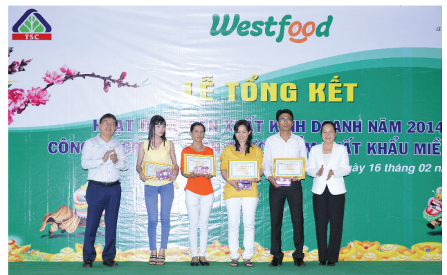
Ban lãnh đạo TSC và West Food trao bằng khen thưởng cho các cá nhân có thành tích lao động xuất sắc trong năm 2014

Như thường lệ, mỗi dịp Tết Nguyên đán, CTCP Chế biến Thực phẩm Xuất khẩu Miền Tây (West Food) - một thành viên của F.I.T - lại tổ chức Hội thi Tiếng hát mùa xuân để CBCNV Công ty có dịp giao lưu, gắn bó với nhau vào 28 tết âm lịch. Năm trong chương trình Tổng kết năm của toàn West Food, 16 tiết mục văn nghệ tham dự do công nhân các phân xưởng tự dàn dựng và tập luyện, đã mang không khí mùa xuân vui tươi, rộn rã đến với tất cả CBCNV Công ty.