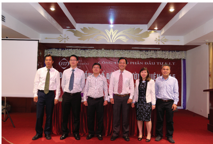
HĐQT mới của CTCP Đầu tư F.I.T

Tờ trình Ủy quyền HĐQT sửa đổi điều lệ phù hợp với luật doanh nghiệp 2014