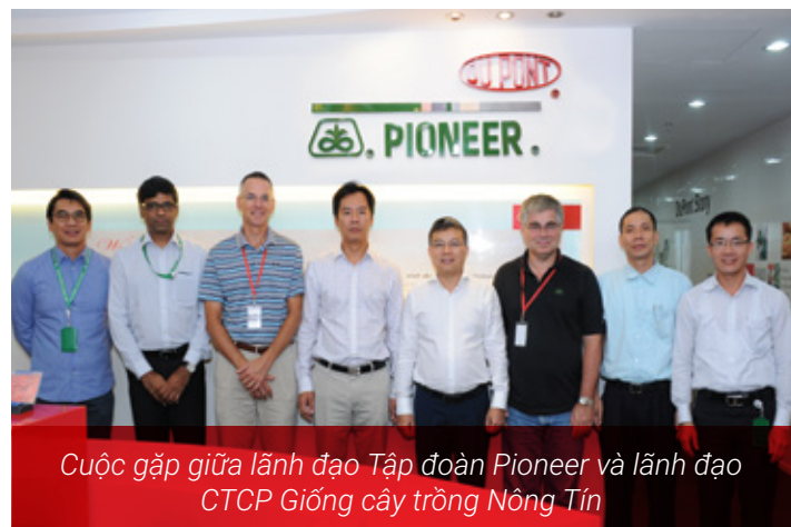
Cuộc gặp giữa lãnh đạo Tập đoàn Pioneer và lãnh đạo CTCP Giống cây trồng Nông Tín

Nông Tín và TSS là 2 công ty hoạt động trong ngành thương mại hạt giống của TSC.