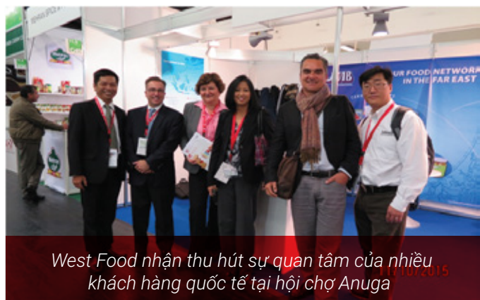
West Food nhận thu hút sự quan tâm của nhiều khách hàng quốc tế tại hội chợ Anuga

ANUGA 2015 VÀ NHỮNG THÀNH CÔNG MỚI CỦA WEST FOOD