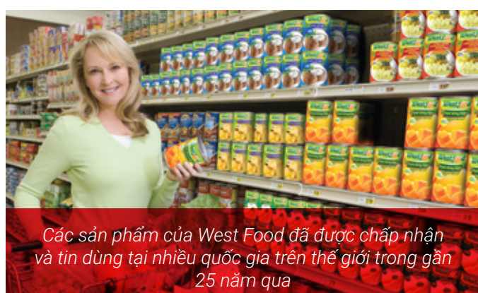
Các sản phẩm của West Food đã được chấp nhận và tin dùng tại nhiều quốc gia trên thế giới trong gần 25 năm qua

Sau Lotte, các sản phẩm khác của West Food tiếp tục được phân phối vào các siêu thị khác trên toàn lãnh thổ Việt Nam. Hoạt động phân phối được thực hiện bởi Công ty TNHH XNK & TM F.I.T Việt Nam (F.I.T Trading) – một công ty con khác của F.I.T.