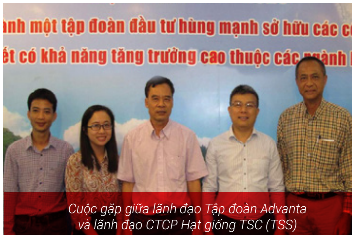
Cuộc gặp giữa lãnh đạo Tập đoàn Advanta và lãnh đạo CTCP Hạt giống TSC (TSS)

Các cuộc gặp gỡ nhằm tăng cường mối quan hệ hợp tác chiến lược giữa các tập đoàn hạt giống nước ngoài với các công ty con của TSC trong việc phát triển thị trường hạt giống Việt Nam. Hiện nay, Nông Tín và TSS đã là đối tác phân phối độc quyền của các tập đoàn trên trong nhiều năm qua.