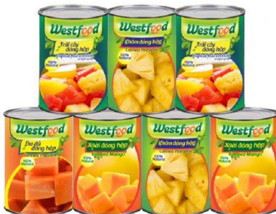
Một số sản phẩm tiêu biểu của Westfood

Cùng với đà tăng trưởng chung của ngành, và đặc biệt là sự đầu tư chiến lược của công ty mẹ FIT Group, kết quả kinh doanh của Westfood trong năm 2019 dự kiến sẽ đạt được những kết quả tốt như mong đợi. Tính tới 9 tháng đầu năm, lợi nhuận gộp tăng 10% so với cùng kỳ năm trước, kéo theo đó là lợi nhuận sau thuế tăng 1% và theo kế hoạch với sự tăng tốc của các đơn hàng lớn dịp cuối năm, sẽ giúp Westfood đạt được những chỉ tiêu theo kế hoạch đặt ra ban đầu, làm tiền đề vững chắc cho những năm sau.