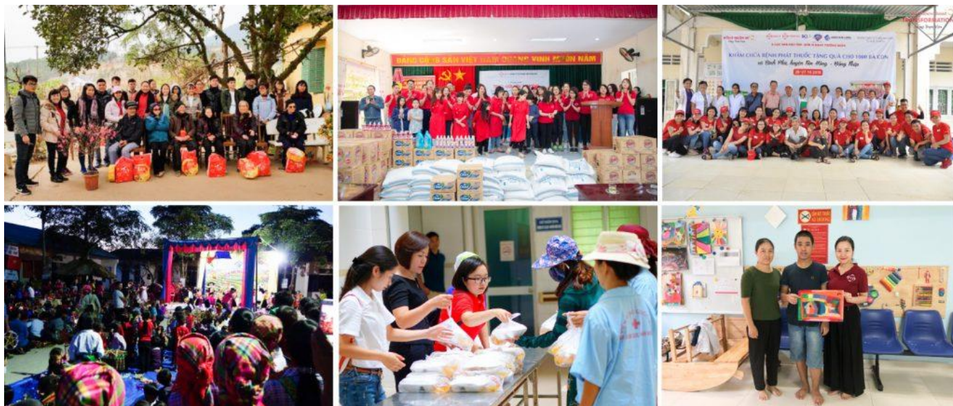
Hình ảnh một vài chuyến hành trình san sẻ yêu thương FIT và các công ty thành viên đã thực hiện trong năm 2018

rõ nét, mang đậm nhận thức nhân văn, nhân ái sâu sắc trong cam kết vì cộng đồng của Ban Lãnh đạo và toàn thể CBNV FIT.