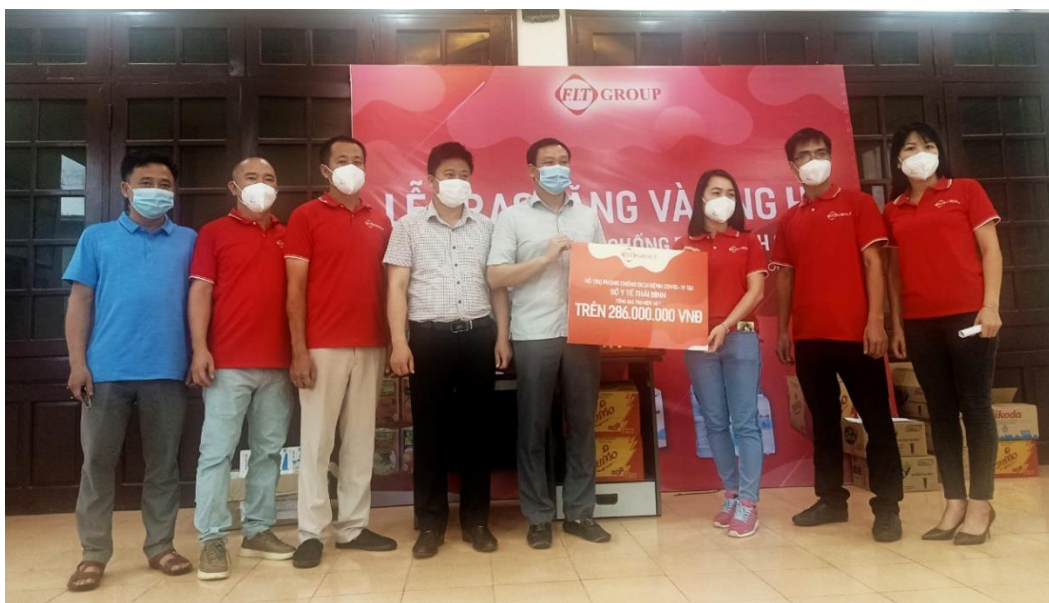
Đại diện FIT Group trao quà hỗ trợ tại Sở Y Tế Thái Bình

Được biết, FIT Group đã trao tặng cho Sở Y Tế Thái Bình 286 thùng nước Vikoda các loại, 654 thùng nước lã lực Sumo các loại; 2.340 sản phẩm là gel rửa tay không dùng nước Dr.Clean cùng 120 hộp thuốc các loại, trong đó chủ yếu là thuốc giảm đau hạ sốt Panalgan. Sở Y Tế Thái Bình sẽ phân bổ các sản phẩm tài trợ cho 2 huyện chịu ảnh hưởng nặng nề của dịch Covid-19 trên địa bàn tỉnh là huyện Thái Thụy và Huyện Kiến Xương.