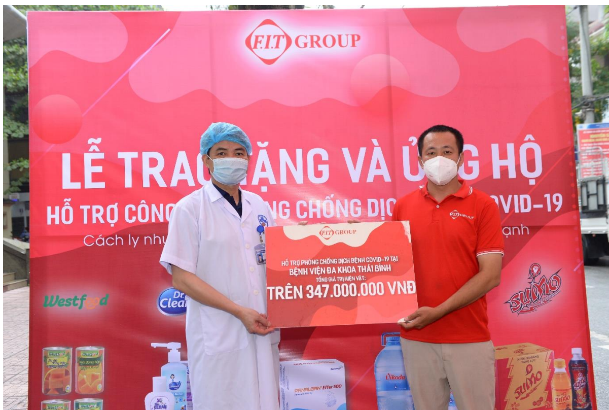
Đại diện FIT Group trao quà hỗ trợ tại bệnh viện Đa khoa Thái Bình

Cùng ngày, FIT Group đã trao tặng cho Bệnh viện Đa Khoa Thái Bình 200 thùng nước Vikoda các loại; 554 thùng nước tăng lực Sumo các loại; 2.040 sản phẩm là gel và dung dịch nước rửa tay Dr.Clean cùng 2.010 hộp thuốc các loại. Bệnh viện Đa khoa Thái Bình là nơi tiếp nhận, cách ly điều trị nhiều ca mắc Covid – 19 trên địa bàn tỉnh. Với sự hỗ trợ của FIT Group, bệnh viện sẽ có thêm nguồn lực để ứng phó với dịch bệnh.