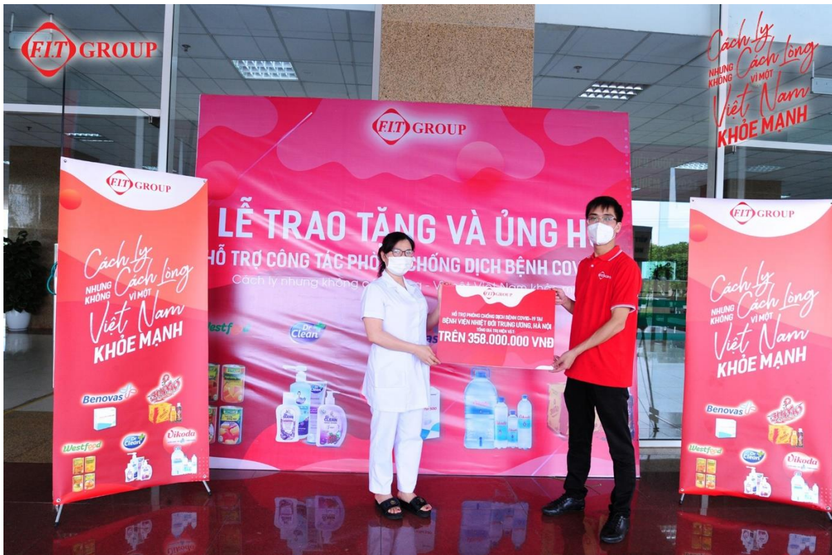
FIT Group trao quà hỗ trợ bệnh viện Nhiệt Đới

Sáng ngày 28/5/2021, Bệnh viện Nhiệt Đới Trung Ương cơ sở 2, Đông Anh, Hà Nội đã tiếp nhận những vật phẩm hỗ trợ thiết yếu có giá trị hơn 357 triệu đồng. Các vật phẩm bao gồm 100 thùng nước khoáng Vikoda đóng chai 1,5L; 3,120 sản phẩm là gel và dung dịch nước rửa tay Dr.Clean. Ngoài ra, FIT Group còn trao tặng thêm 2,211 hộp thuốc các loại, chủ yếu là giảm đau hạ sốt Panalgan, đây là loại thuốc rất cần cho người bệnh tại các bệnh viện, cơ sở đang bị cách ly và các loại thuốc hỗ trợ điều trị, tăng sức đề kháng khác. Đây là lần thứ 2 bệnh viện nhận được sự hỗ trợ từ FIT Group. Trước đó ngày 13/5/2021, FIT Group đã trao tặng bệnh viện 30 triệu đồng tiền mặt và các hàng hóa, vật phẩm kèm 200 thùng nước khoáng Vikoda, 100 thùng nước tăng lực Sumo và 336 tuýp gel rửa tay không dùng nước Dr.Clean.