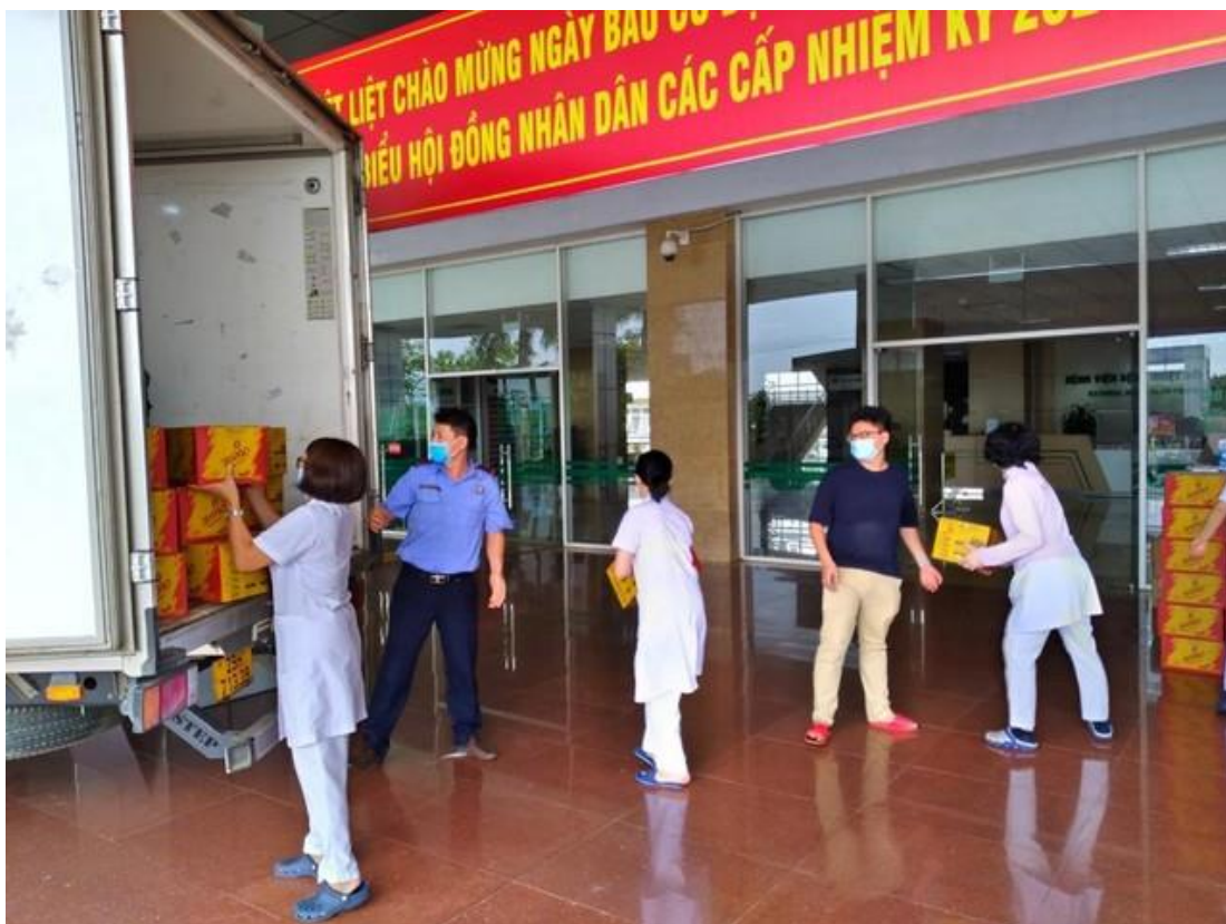
Tập đoàn F.I.T trao quà hỗ trợ cho Bệnh viện Nhiệt đới Trung ương tại cơ sở 2, Đông Anh, Hà Nội.

Gói hỗ trợ đang được khẩn trương triển khai tới các cơ sở tiếp nhận khác trong cả nước và Tập đoàn hy vọng rằng sự chung tay hỗ trợ kịp thời sẽ tiếp thêm sức mạnh cho hệ thống y tế và xã hội đẩy lùi dịch bệnh.