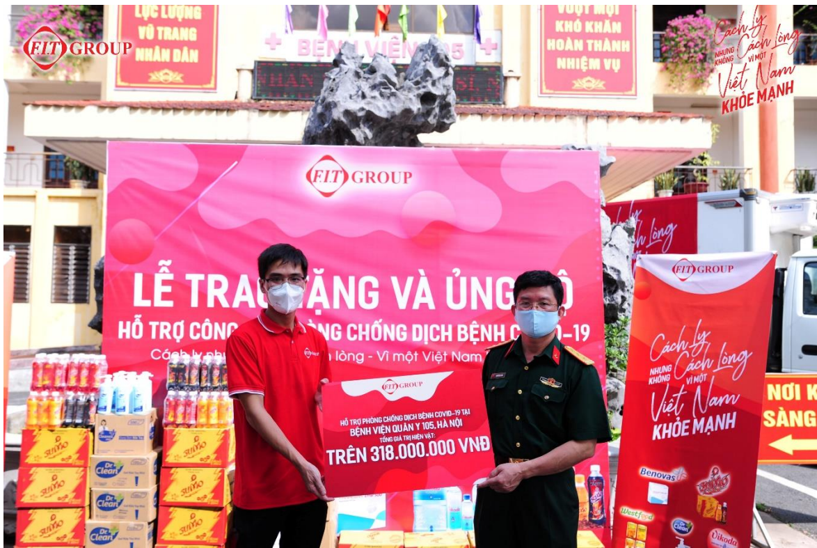
FIT Group trao quà hỗ trợ bệnh viện Quân y 105

Trong những năm qua, hoạt động trách nhiệm xã hội của doanh nghiệp CSR luôn được FIT Group quan tâm đặc biệt, bởi việc lựa chọn thực thi các hoạt động xã hội là thể hiện sự chân thành và tấm lòng của lãnh đạo và cán bộ công nhân viên Tập đoàn đối với cộng đồng và xã hội. Trong bối cảnh cả nước đang nỗ lực tối đa phòng chống sự trở lại của dịch bệnh, FIT Group và các công ty thành viên đã thực hiện chương trình “FIT Group chung tay đẩy lùi Covid – 19” từ ngày 15/5. “Cách ly nhưng không cách lòng – vì một Việt Nam khỏe mạnh” là thông điệp nhân văn mà cán bộ nhân viên Tập đoàn mong muốn gửi tới xã hội thông qua chương trình này.