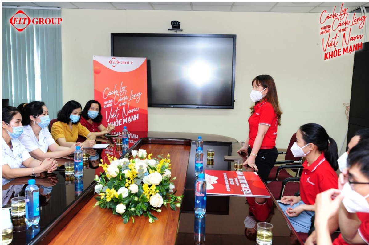
Đại diện CDC Hà Nội cảm ơn sự hỗ trợ của FIT Group

Nội cũng đang gặp nhiều khó khăn trong việc mua sắm các trang thiết bị, vật tư tiêu hao... Các vật phẩm do FIT Group trao tặng vô cùng cần thiết cho công tác đẩy lùi dịch bệnh hiện nay.