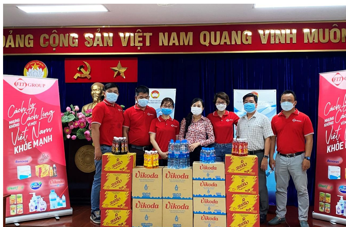
Đại diện FIT Group trao quà cho Ủy Ban Mặt Trận Tổ Quốc Việt Nam TP. Hồ Chí Minh

Hồ Chí Minh là đô thị lớn, tập trung đông dân cư, trung tâm lớn về các hoạt động kinh tế, giao lưu trong nước và quốc tế, là địa bàn trọng yếu về phòng, chống dịch COVID-19. Việc bảo đảm an toàn phòng chống dịch của Thành phố có ý nghĩa to lớn, góp phần ổn định xã hội, phát triển kinh tế, thực hiện mục tiêu kép không chỉ đối với Thành phố mà còn đối với cả nước.