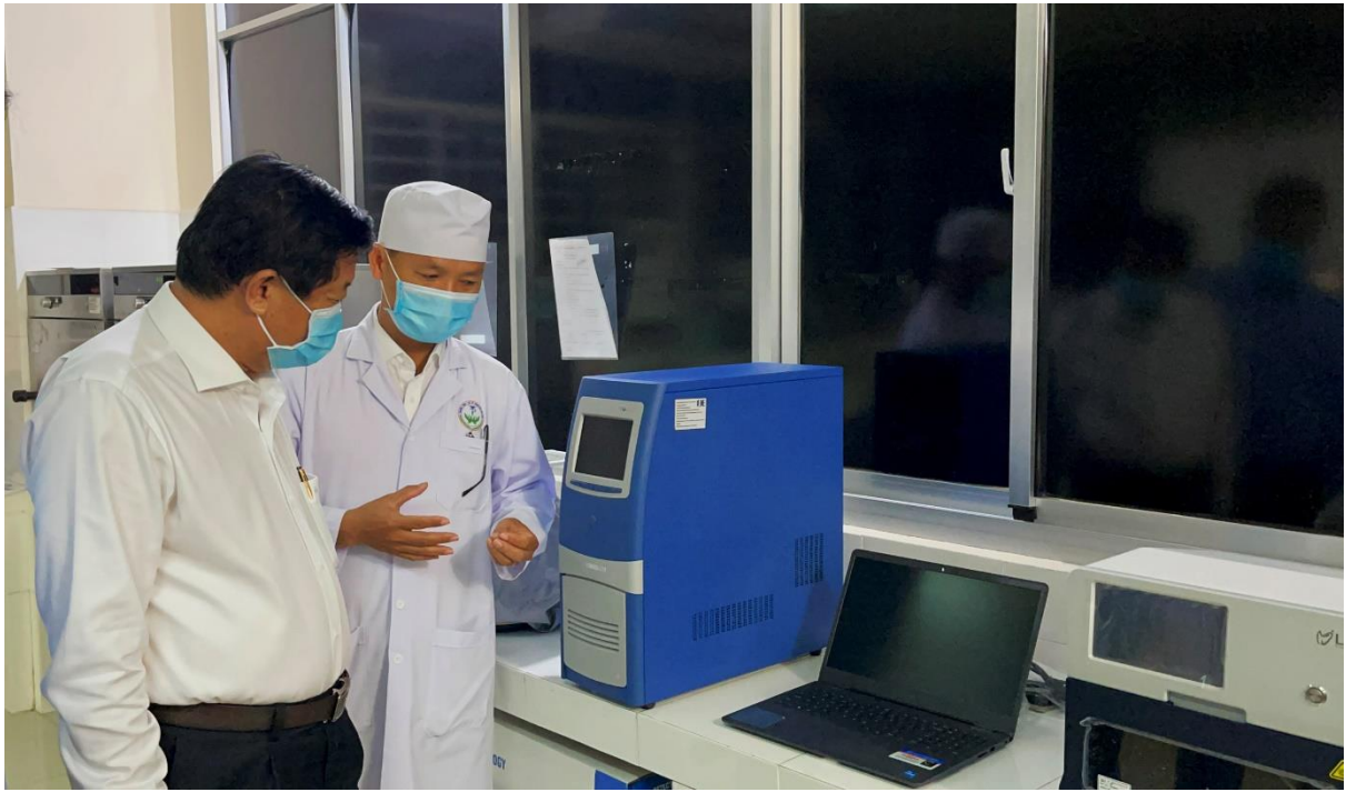
Bí thư tỉnh ủy Vĩnh Long Bùi Văn Nghiêm kiểm tra hệ thống xét nghiệm nhanh Real – Time PCR do DCL trao tặng tại Trung Tâm Y Tế thành phố Vĩnh Long

Ngoài việc hỗ trợ hệ thống xét nghiệm nhanh Real – Time PCR cho Trung tâm Y tế Thành phố Vĩnh Long, trong đợt dịch này Dược Cửu Long còn hỗ trợ hơn 1 tỷ đồng bằng các sản phẩm thuốc Giảm đau hạ sốt Panalgan – loại thuốc rất cần cho người bệnh tại các bệnh viện đang bị cách ly, các địa phương đang có dịch bệnh Covid -19 diễn biến phức tạp trong cả nước. Được biết, các hoạt động tài trợ của Dược Cửu Long nằm trong chương trình chung tay cùng cộng đồng đẩy lùi Covid – 19 do công ty mẹ – Tập đoàn F.I.T phát động từ ngày 15/5/2021 với giá trị lên đến 10 tỷ đồng.