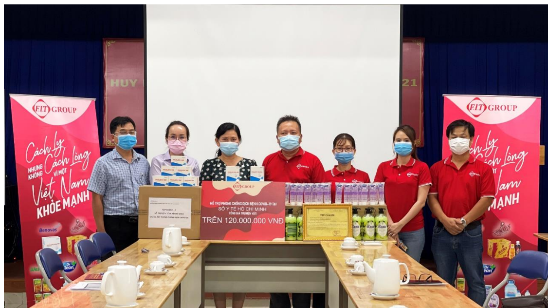
Đại diện FIT Group trao quà cho Sở Y Tế TP. Hồ Chí Minh

Giảm đau hạ sốt Panalgan – loại thuốc rất cần thiết cho các bệnh viện, cơ sở y tế. Bên cạnh đó, FIT Group còn tài trợ thêm 1.500 khẩu trang y tế N95 và 2.168 sản phẩm trái cây đóng lon Westfood các loại.