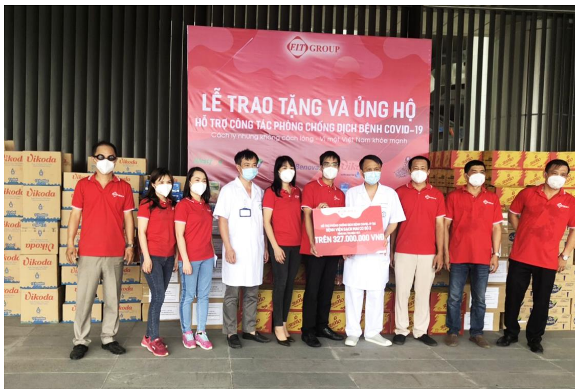
FIT Group trao quà tại Bệnh viện Bạch Mai cơ sở 2 tại Hà Nam

Cùng ngày, cũng trên địa phận tỉnh Hà Nam, FIT Group còn trao tặng Bệnh viện Bạch Mai cơ sở 2, nơi đang tiếp nhận, cách ly, điều trị 344 trường hợp tiếp xúc gần có yếu tố nguy cơ về sức khỏe của tỉnh Hà Nam và các ca bệnh âm tính với SARS-CoV-2 của Bệnh viện Bệnh nhiệt đới Trung ương chuyển về với cơ cấu hàng hóa như trên trị giá trên 320 triệu đồng.