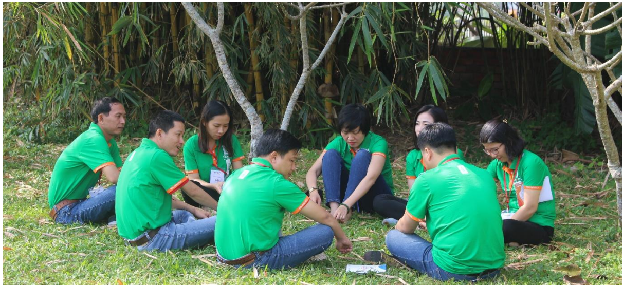
Các học viên họp đội nhóm