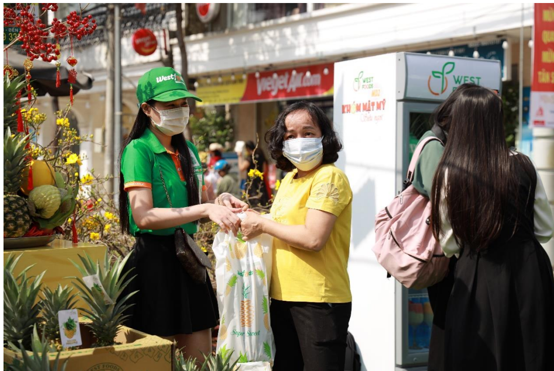
Gian hàng của Westfood tại Hội chợ xuân Cần Thơ