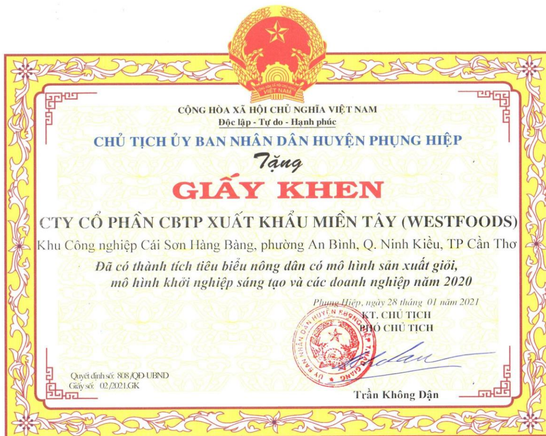
Bằng khen do Lãnh đạo huyện Phụng Hiệp, tỉnh Hậu Giang trao tặng cho Westfood