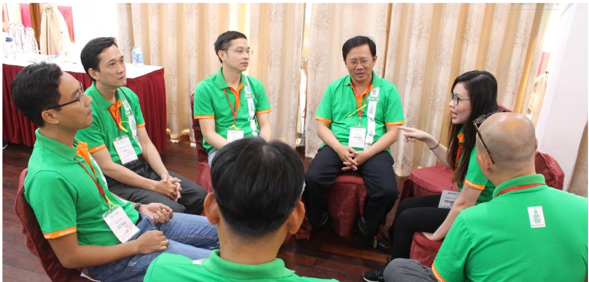
Vòng tròn chia sẻ trong khóa học