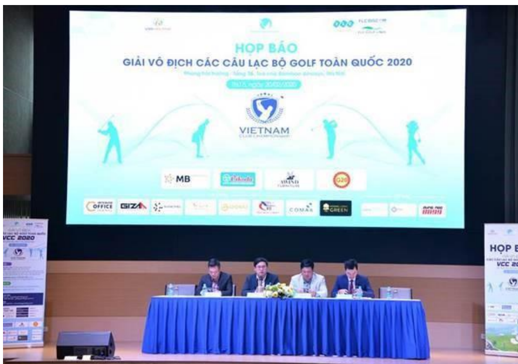
Hình ảnh nước uống Vikoda tại buổi họp báo công bố thông tin VCC 2020

Bên cạnh việc thương hiệu Vikoda của Công ty Cổ Phần Nước Khoáng Khánh Hòa trở thành nhà tài trợ Kim Cương cho cả 6 mùa giải, trên cương vị là một công ty nước khoáng lâu đời tại Việt Nam, với chất lượng nguồn nước khoáng 100% thiên nhiên có độ kiềm tự nhiên pH = 8.5, rất tốt cho sức khỏe , được sự tin dùng của đông đảo người tiêu dùng trong cả nước, Vikoda đồng thời cũng sẽ là đơn vị cung cấp nước uống độc quyền trong suốt thời gian diễn ra các giải đấu trong năm nay. Điều này không chỉ khẳng định tên tuổi, chất lượng của Vikoda tại Việt Nam, mà còn khẳng định được niềm tin lớn của người tiêu dùng đặt vào thương hiệu Vikoda trong các sự kiện lớn, đặc biệt là trong các giải đấu golf chuyên nghiệp cấp quốc gia.