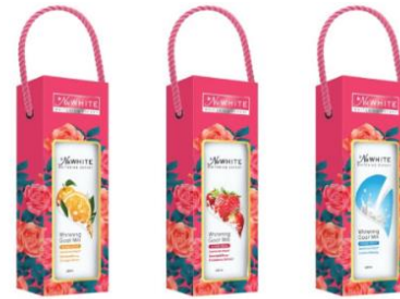
Hộp quà: Sữa tắm NuWhite Goat Milk

Sữa tắm toàn thân NuWhite là thương hiệu uy tín đến từ CTCP FIT Cosmetics vốn nổi tiếng với các sản phẩm chăm sóc gia đình và chăm sóc cá nhân tại thị trường Việt Nam. Được sản xuất từ các thành phần tự nhiên trên dây chuyền, máy móc hiện đại, cùng với các dòng sản phẩm và các mùi hương đa dạng,