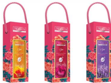
Hộp quà: Sữa tắm NuWhite Spa