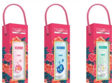
Hộp quà: Sữa tắm NuWhite Yogurt

Hình ảnh các hộp quà đặc biệt của NuWhite ra mắt nhân dịp 8/3: