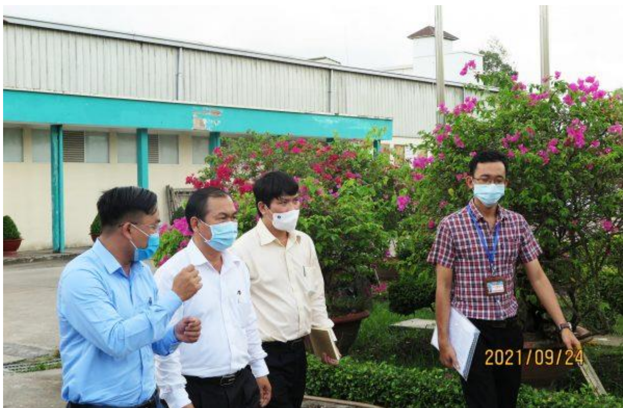
Ông Lê Văn Thành ghé thăm nhà máy Westfood

Để đảm bảo công tác sản xuất an toàn trong điều kiện bình thường, Wesfood mong thành phố hỗ trợ cho 312 lao động còn lại của công ty được tiêm vaccine phòng COVID-19.