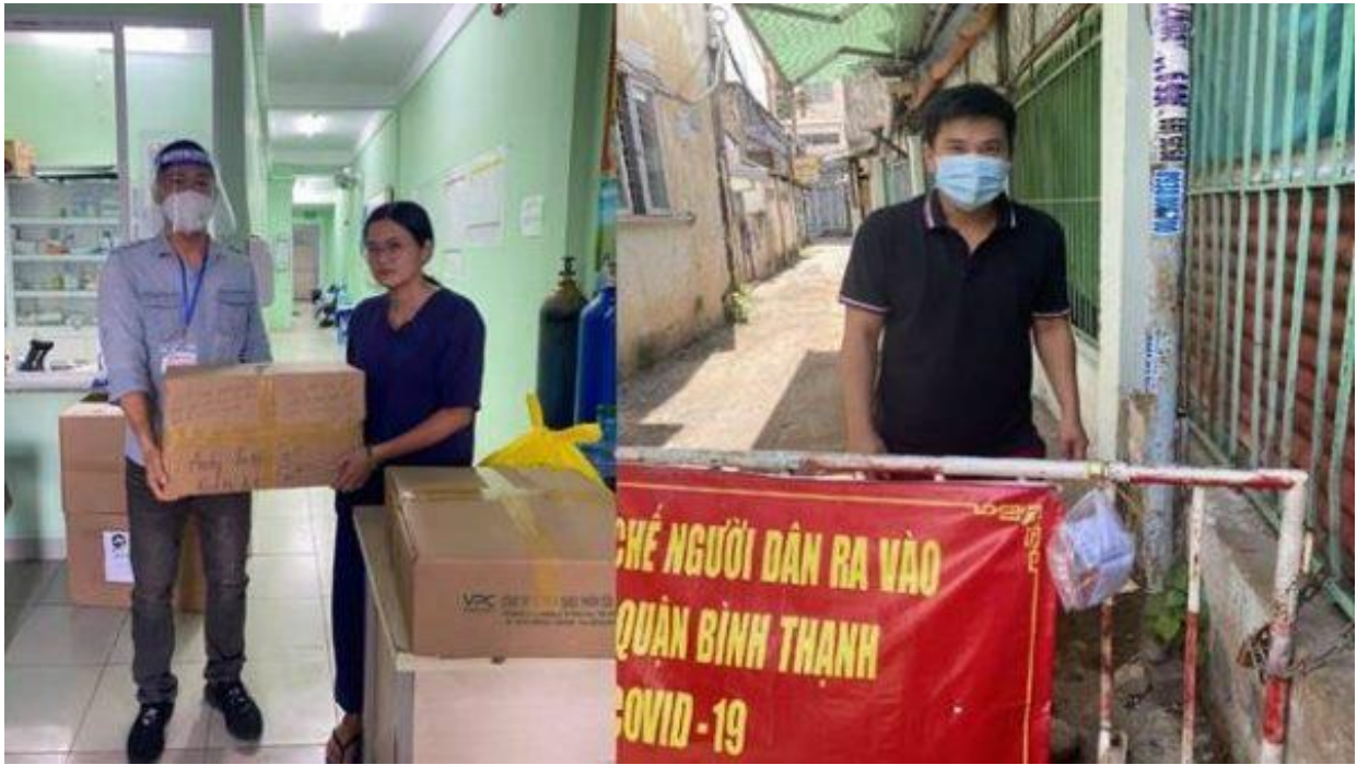
Các túi thuốc được trao đến tận tay các bệnh nhân F0