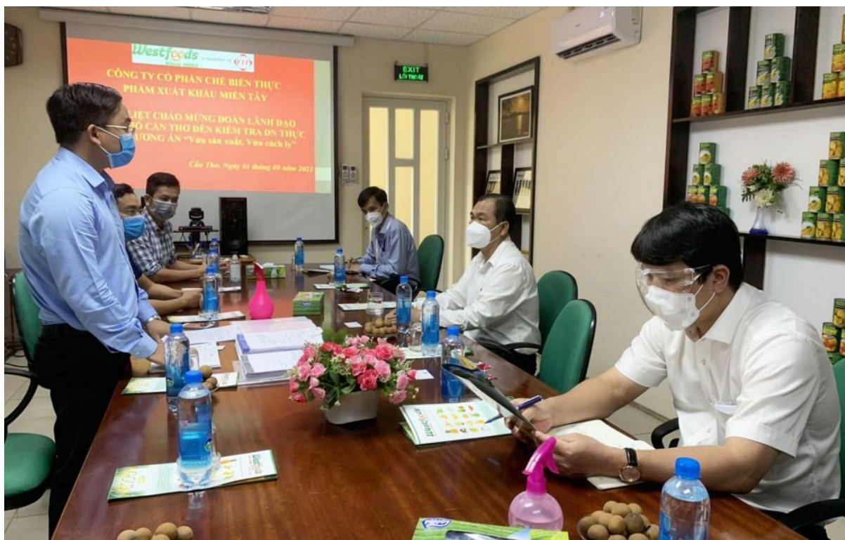
Đoàn trao đổi với lãnh đạo Westfood.

cùng với sản xuất dược phẩm phục vụ cho nhu cầu chăm sóc sức khỏe người dân, DHG Pharma còn tham gia cung ứng một số sản phẩm thuốc hỗ trợ điều trị COVID-19. Công ty đã xác định nhiệm vụ là chung tay cùng thành phố, vừa sản xuất, vừa chống dịch.