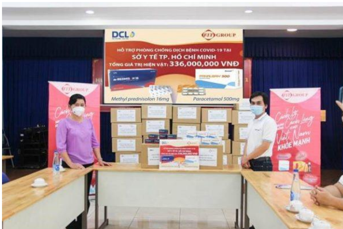
DCL trao tặng thuốc hỗ trợ điều trị Covi-19 cho Sở Y tế Tp Hồ Chí Minh

địa phương có dịch Covid-19 diễn biến phức tạp gồm: Hà Nội, Bắc Ninh, Bắc Giang, Hà Tĩnh, Đà Nẵng, Cần Thơ... với tổng giá trị chương trình lên đến trên 13 tỷ đồng.