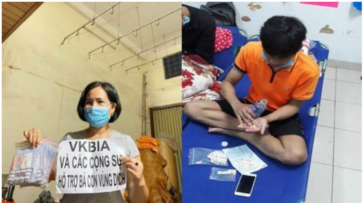
Các túi thuốc được trao đến tận tay các bệnh nhân F0

Trước đó, nhằm giúp công tác điều trị F0 tại nhà trên địa bàn đạt hiệu quả, DCL cũng trao tặng Sở Y tế TP.HCM 400.000 viên thuốc hỗ trợ điều trị Covid-19 các loại do DCL sản xuất và phân phối gồm 300.000 viên thuốc Paracetamol 500mg với thương hiệu Panalgin 500 và 100.000 viên thuốc Methyl Prednisolon 16mg với thương hiệu m-Rednison 16.