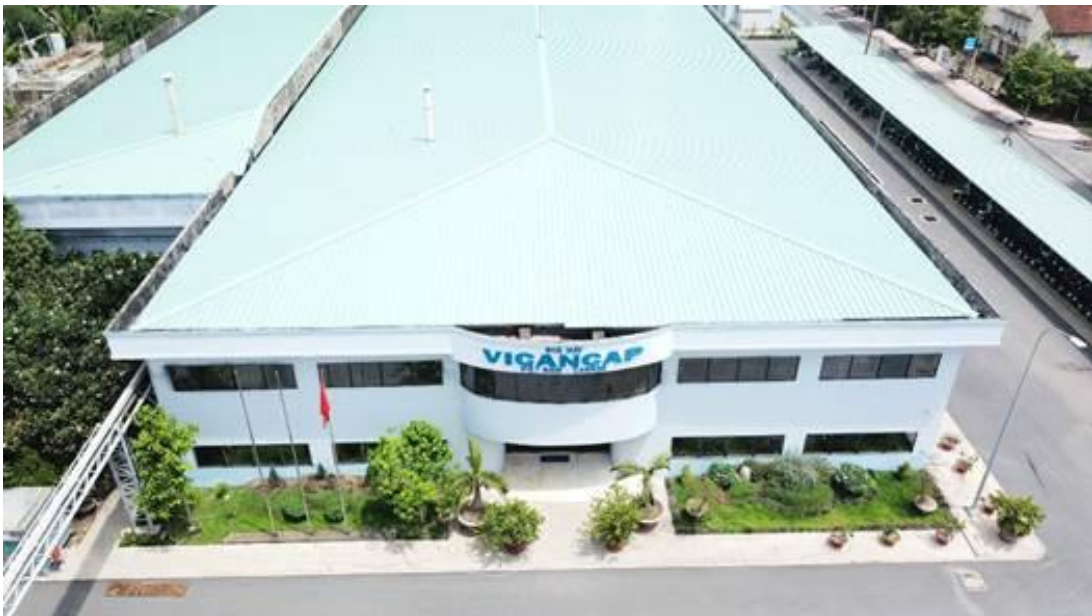
Bên ngoài nhà máy sản xuất viên nang rộng của Dược Cửu Long

Đầu tư cơ bản vào xây dựng nhà máy viên nang số 3 là một quyết định bước ngoặt, đồng thời là một ví dụ điển hình phản ánh chân thực quá trình tái cơ cấu công ty và cả tập đoàn. Trước tái cơ cấu, Dược Cửu Long loay hoay với bài toán phát triển kinh doanh dựa trên nền tảng cũ với năng lực và công nghệ hạn chế. Việc mua nhà máy Euvipharm khi đó thể hiện niềm tin ngây thơ về việc mở rộng kinh doanh nhờ quy mô thông qua đầu tư. Nhưng Dược Cửu Long đã không thể tạo ra sự cộng hưởng kỳ vọng từ việc đầu tư này, mà ngược lại đã phải chịu lỗ hợp nhất do nhà máy Euvipharm không hoạt động như kỳ vọng trong và sau quá trình chuyển giao.