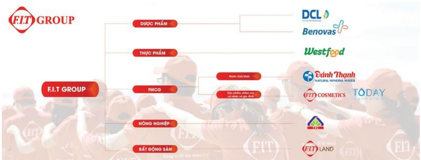
Cấu trúc ngành nghề Tập đoàn FIT

Bảy năm sau, hình ảnh một công ty FIT bé nhỏ với vốn điều lệ 300 tỷ đồng nay đã được thay thế bởi một tập đoàn hoạt động đa ngành với vốn chủ sở hữu hơn 4.000 tỷ đồng. Các mảng hoạt động của các công ty con và công ty thành viên của FIT đa dạng nhưng tập trung vào thế mạnh của nền kinh tế Việt Nam, với những thương hiệu và sản phẩm đã có truyền thống và chỗ đứng trên thị trường.