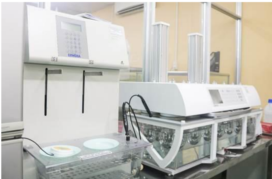
Phòng thí nghiệm với thiết bị tiên tiến của Dược Cửu Long

Việc bán Euvipharm được hoàn tất ngày 30/08/2019, đồng nghĩa từ đó công ty không phải chịu lỗ hợp nhất, đồng thời mang lại dòng tiền lớn phục vụ cho hoạt động thế mạnh của công ty ở lĩnh vực dược phẩm, sản xuất viên nang và thiết bị y tế. Cụ thể, ngoài việc dự chi xây dựng nhà máy viên nang mới số 4 và nhà máy thiết bị y tế, khoản thu bán Euvipharm đã được sử dụng hợp lý và hiệu quả với việc hoàn thành đầu tư sửa chữa lớn hai nhà máy sản xuất viên nang cũ, số 1 và 2, và hai nhà máy Betalactam và Non-Betalactam. Đặc biệt, công ty đã bổ sung trang thiết bị hiện đại cho phòng thí nghiệm (Lab) của bộ phận Nghiên cứu và Phát triển (R&D), hứa hẹn hoàn thành danh mục các sản phẩm mới cho công ty trong năm 2020 và 2021.