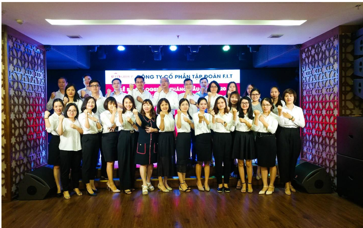
FITers cam kết thực hiện mục tiêu năm 2020 đã đề ra

Trong 6 tháng đầu năm vừa qua, nền kinh tế Việt Nam chứng kiến nhiều biến động và khó khăn do dịch bệnh Covid 19 gây ra, khiến cho các mảng kinh doanh của FIT gặp nhiều thách thức, nhưng với sự nỗ lực và tinh thần quyết tâm của một tập thể gắn kết, Ban Lãnh đạo và toàn thể CBNV đã bền vững tay lái, vượt qua mọi sóng gió và đã đạt được những kết quả ấn tượng. Lợi nhuận sau thuế hợp nhất ước tính đạt 106% kế hoạch 6 tháng đầu năm. Kết quả này một lần nữa khẳng định đường lối và chiến lược hoạt động đã đưa ra trong OGSM từ đầu năm là hoàn toàn đúng đắn, từ chủ trương tập trung vào các ngành hàng nòng cốt là Dược phẩm, Hàng tiêu dùng và Nông nghiệp – Thực phẩm tạo nền tảng cho sự phát triển bền vững của FIT trong các mảng kinh doanh, đến việc phối hợp nhân sự chặt chẽ giữa các phòng, ban trong Tập đoàn và đội ngũ nhân sự các công ty thành viên. Nhờ những nỗ lực đồng bộ đó mà các chỉ số % hoàn thành kế hoạch của 6 tháng đầu năm của các phòng, ban của Tập đoàn đều đạt mốc ấn tượng, giúp cho Ban Lãnh đạo và toàn thể CBNV FIT Group hoàn toàn tự tin để chinh phục các mục tiêu đã đặt ra của cả năm 2020.