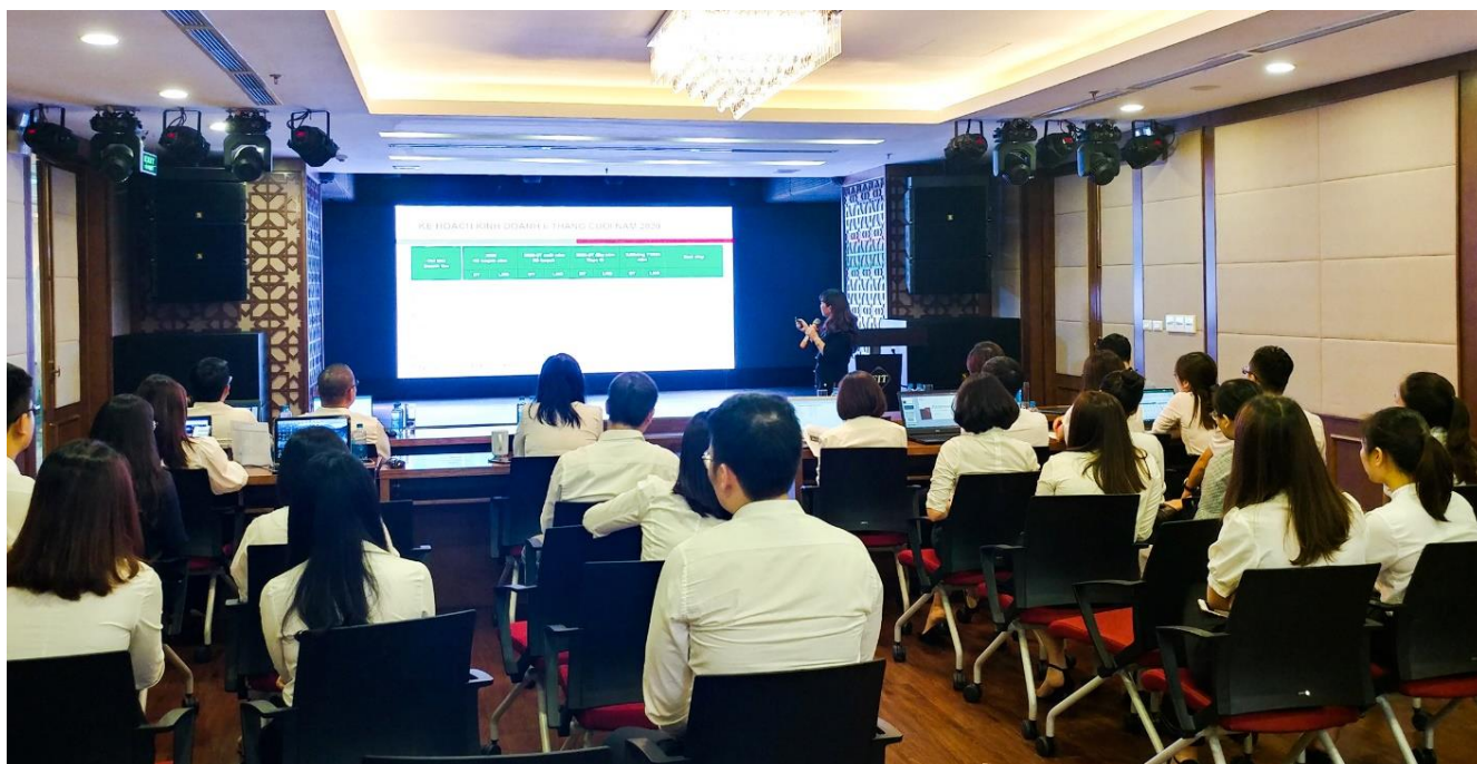
Hội nghị Sơ kết OGSM Tập đoàn FIT tổ chức ngày 15/07/2020

Sáng ngày 15/07/2020, Lễ sơ kết OGSM 6 tháng đầu năm của CTCP Tập đoàn FIT đã được tổ chức tại trụ sở Hà Nội. Thông qua lễ sơ kết, toàn thể lãnh đạo và toàn thể CBNV Tập đoàn đã cùng nhau nhìn lại và đánh giá kết quả hoạt động cụ thể của từng phòng, ban trong 6 tháng đầu năm vừa qua, từ đó có những điều chỉnh phù hợp và kịp thời cho kế hoạch hành động trong 6 tháng cuối năm, đảm bảo hoàn thành 100% mục tiêu đã đặt ra của cả Tập đoàn cho cả năm 2020.