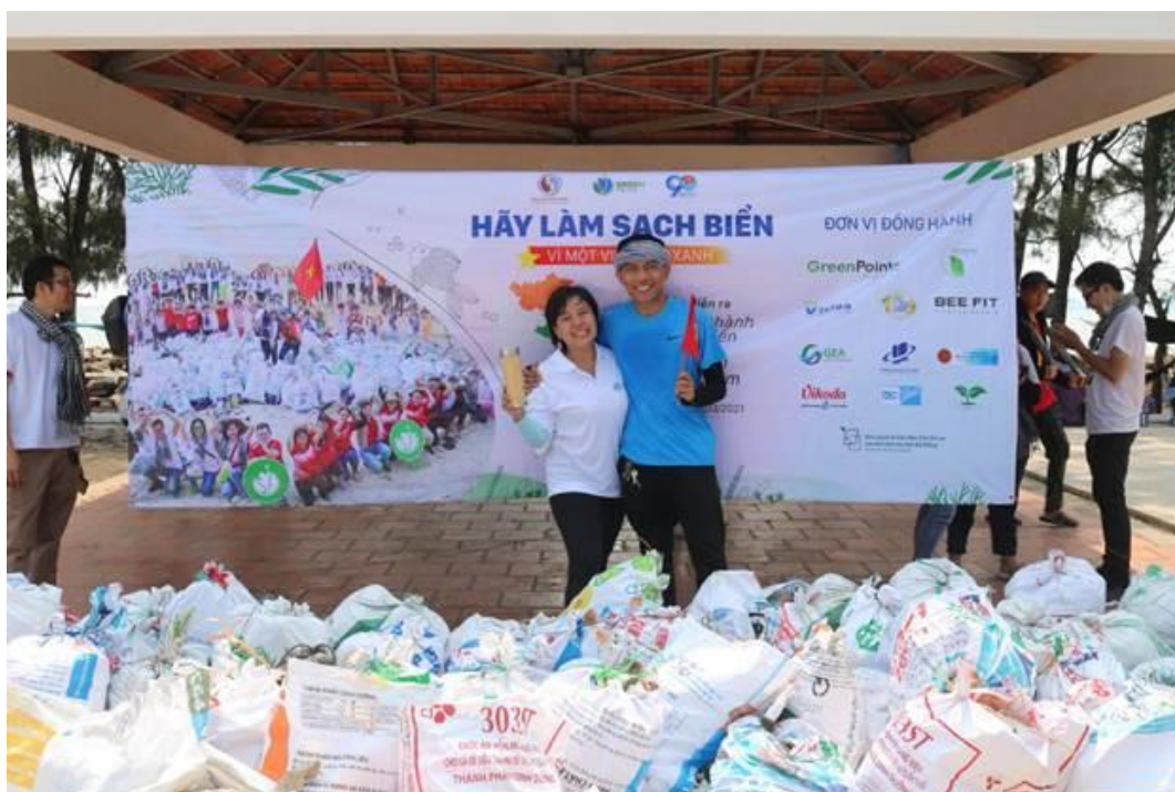
Người dân vui mừng vì đã đóng góp công sức bảo vệ môi trường biển

Với tầm nhìn “Vi một cộng đồng khỏe mạnh với thói quen tốt và cuộc sống cân bằng”, Vikoda không ngừng đầu tư sản xuất các sản phẩm nhằm giảm thiểu và hướng đến không gây tác động tiêu cực lên môi trường thông qua bao bì sản phẩm của công ty, góp phần đưa vấn đề ô nhiễm môi trường trở thành vấn đề của