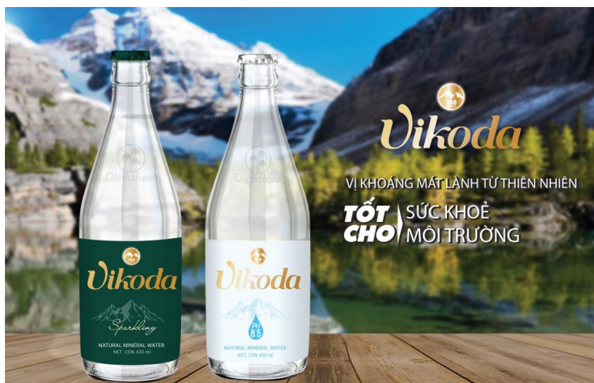
Hình ảnh chai nước khoáng thủy tinh ga và không ga của Vikoda

Dòng khoáng Đánh Thạnh tự nhiên do Vikoda khai thác là nguồn nước khoáng giàu vi chất được tinh lọc kỹ càng qua nhiều tầng địa chất trong lòng đất mẹ Khánh Hòa, với độ kiềm tự nhiên từ 8.5 – 9.5 ngọt mát, giúp nâng cao chất lượng cuộc sống của người tiêu dùng và hỗ trợ chăm sóc sức khỏe toàn diện. Cùng chung tay với thế giới hưởng ứng phong trào giảm thiểu rác thải nhựa, Vikoda đã lần lượt cho ra mắt sản phẩm nước khoáng Vikoda chai thủy tinh, mới đây nhất là sản phẩm Vikoda Alkaline, Vikoda Soda dạng lon nhôm với mong muốn các đưa sản phẩm này đến đồng đảo người tiêu dùng, từ đó giảm thiểu bao bì nhựa, góp phần chung tay bảo vệ môi trường sống.