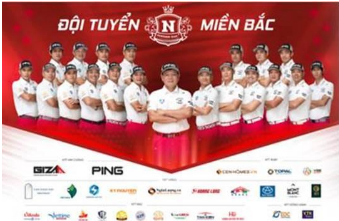
Đội hình ra sân của đội tuyển miền Bắc

Mới đây nhất, để giúp các Golfer đội tuyển miền bắc có thêm thể lực trong giải Golf đối kháng VGA Union Cup tranh cúp Vietnam Airlines 2021, Vikoda vinh dự là đơn vị tài trợ nước uống cho đội tuyển trong suốt thời gian diễn ra giải đấu.