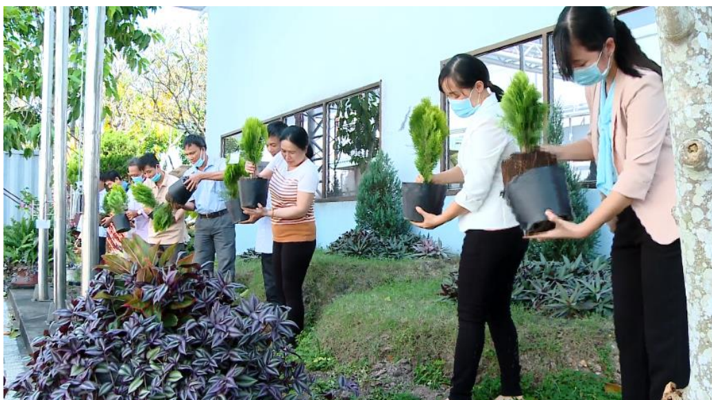
CBNV Dược Cửu Long hưởng ứng phong trào trồng cây xanh

Mỗi cây xanh được gắn biển tên của CBNV đã trồng cây xanh đó trên cây. Các CBNV sẽ có trách nhiệm chăm sóc cây vừa trồng để tạo dựng một không gian xanh trong khuôn viên làm việc của nhà máy của Dược Cửu Long.