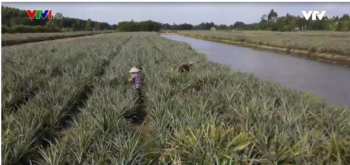
Người dân chuyển đổi canh tác sang trồng Khóm Mật Mỹ MD2

Đứng trước thực tế đó, Westfood đã triển khai hợp tác với người dân trong việc canh tác dưa MD2, giống dưa được nhập khẩu từ Nam Mỹ theo hướng Westfood cung cấp giống, phân bón, hỗ trợ kỹ thuật canh tác và bao tiêu sản phẩm. Mỗi một ha trồng dưa MD2 sẽ cho thu nhập từ 80 đến 110 triệu đồng.