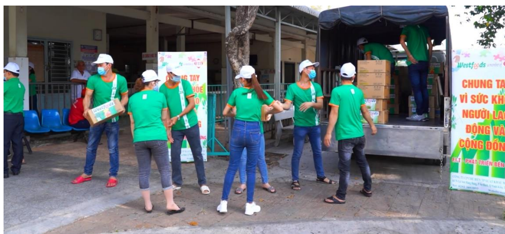
CBCNV Westfood vận chuyển quà cho bếp ăn bệnh viện

Từ lâu, việc chăm lo sức khỏe cho người lao động và cộng đồng luôn được Ban lãnh đạo Westfood quan tâm và đặt lên hàng đầu, gắn liền với một trong những giá trị cốt lõi của công ty: “Con người là trọng tâm và đánh giá cao con người phù hợp” . Từng bữa ăn của công nhân luôn được cải thiện, đảm bảo vệ sinh an toàn thực phẩm và giá trị dinh dưỡng trong khẩu phần ăn. Triển khai chương trình “Chung tay vì sức khỏe người lao động và cộng đồng” , Ban lãnh đạo công ty đã đặc biệt bổ sung sữa tươi và trái cây tươi trong khẩu phần ăn hàng ngày, giúp bổ sung khoáng chất, vitamin và các chất xơ cho cơ thể để người lao động có một sức khỏe tốt. Bên cạnh đó, trong các năm qua, Ban lãnh đạo Westfood luôn quan tâm đến cộng đồng, đặc biệt là các hoàn cảnh khó khăn tại địa phương.