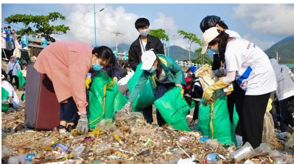
Các tình nguyện viên tham gia thu gom rác trên bãi biển Vĩnh Lương

Ngày 21-3, Vikoda đã đồng hành cùng Hội Liên hiệp Thanh niên Việt Nam tỉnh Khánh Hòa, Trung tâm Truyền thông Tài nguyên và Môi trường (Bộ Tài nguyên và Môi trường) và tổ chức Green Trips Việt Nam triển khai chiến dịch “ Hãy làm sạch biển ” - Vì một Việt Nam xanh tại bãi biển xã Vĩnh Lương (TP. Nha Trang) tại địa phương.