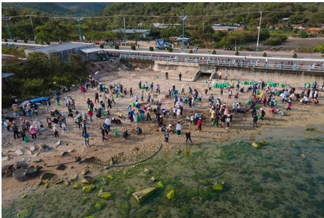
Trong đầu giờ buổi sáng, các tình nguyện viên đã dọn vệ sinh, thu gom hết rác trên bãi biển tại khu vực gần cảng Vĩnh Lương

Tham gia hoạt động, gần 800 tình nguyện viên là sinh viên, đoàn viên, thanh niên đến từ các trường đại học, cao đẳng... trên địa bàn tỉnh đã tổ chức thu gom rác, làm sạch tuyến đường dọc biển, bãi biển khu vực xã Vĩnh Lương, trả lại cảnh quan sạch, đẹp cho khu vực biển nơi đây.