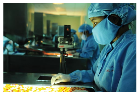
Bên trong nhà máy Dược Cửu Long

Ngày 14/5, F.I.T đã hoàn tất mua vào hơn 4,3 triệu cổ phiếu DCL (CTCP Dược phẩm Cửu Long – sàn HSX), nâng mức sở hữu của F.I.T lên công ty này lên hơn 60% vốn điều lệ. Với kết quả trên, DCL đã chính thức trở thành công ty con của F.I.T, và kết quả kinh doanh sẽ được hợp nhất trong BCTC của F.I.T kể từ quý II/2015