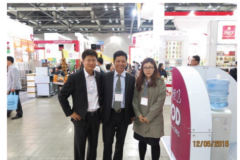
Đại diện West Food gặp gỡ khách hàng tại Hội chợ Hàn Quốc

Theo đó, song song với việc mang về nhiều đơn hàng mới, đại diện West Food đã có các buổi gặp gỡ và đàm phán với các khách hàng lớn tại Hàn Quốc như các tập đoàn phân phối, dịch vụ thực phẩm, các nhà cung cấp các sản phẩm đóng lon hàng đầu tại Hàn Quốc cho các chuỗi siêu thị và cửa hàng tiện lợi, ... và đã đạt được các thỏa thuận khung cho kế hoạch 2015 – 2016.